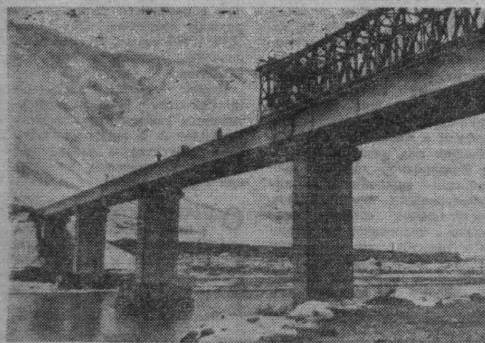
ГЭС НА РЕКЕ НАРЫН

На верхнем снимке: в машинном зале Токтогульской ГЭС работают первый и второй энергоблоки мощностью 300 тысяч киловатт каждый. На снимке слева: заканчивается сооружение нового моста через Нарын. Он свяжет новый поселок Токтогул с поселком гидростроителей Кара-Куль.