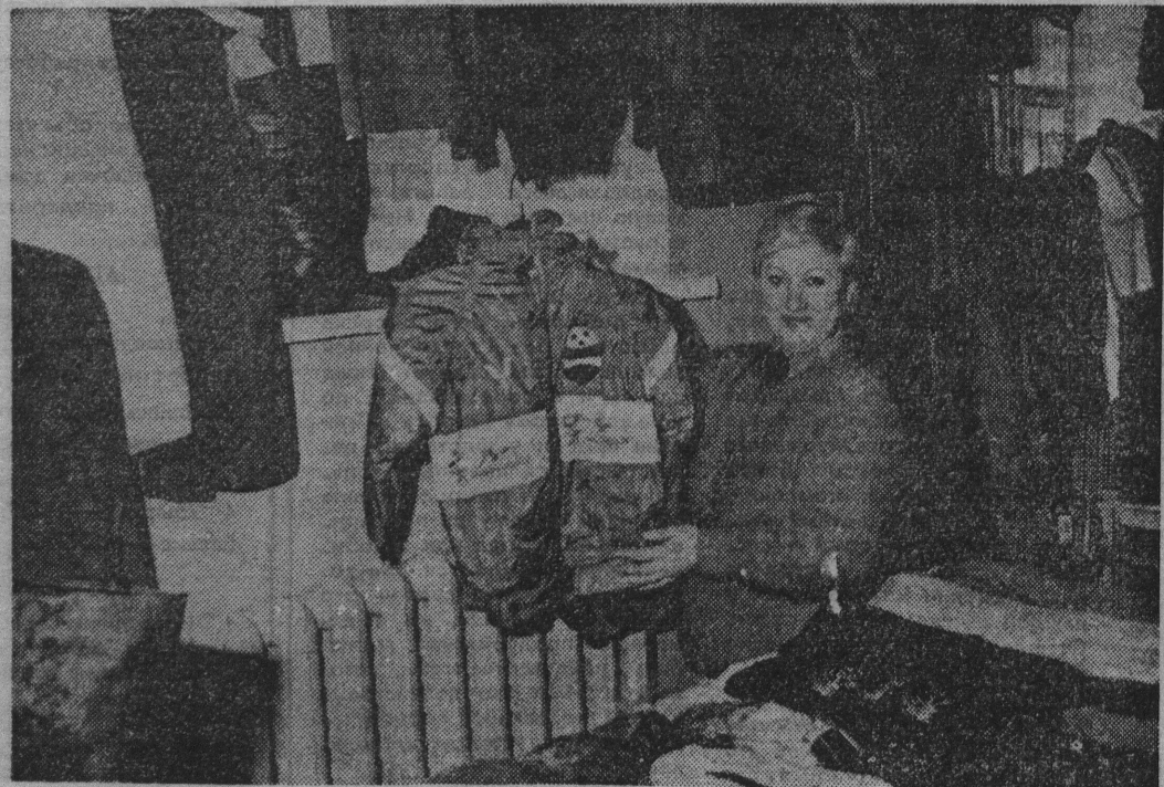
Рынок под крышей: приходите за покупками.