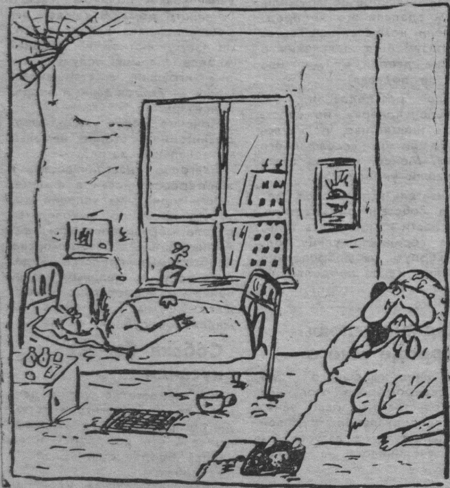
Сидина — в голову, а избирательная кампания — в ребро. Рис. В. Шилова.

Драматизм ситуации усугубляется тем, что отталкиваясь от соображений, которые уже высказаны выше, представители определенных политических движений выступают за то, чтобы губернатор выбирался областной Думой, ее депутатами, то есть в итоге оказался кем-то вроде председателя исполкома одного из хорошо известных всем Советов, то есть — никем. Е. ИВАНОВ.