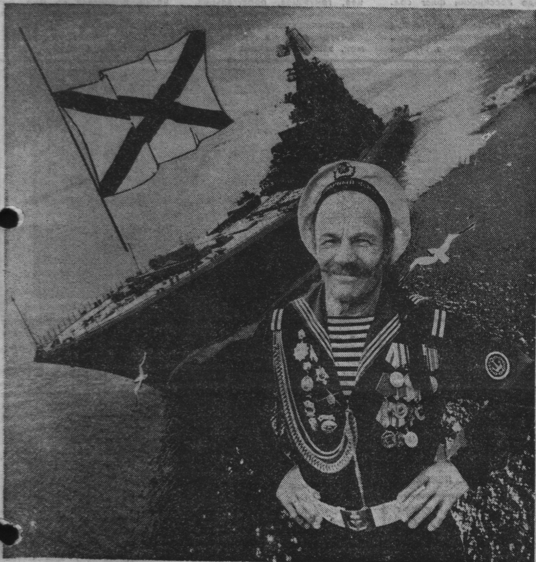
Морская душа — всегда молодая.