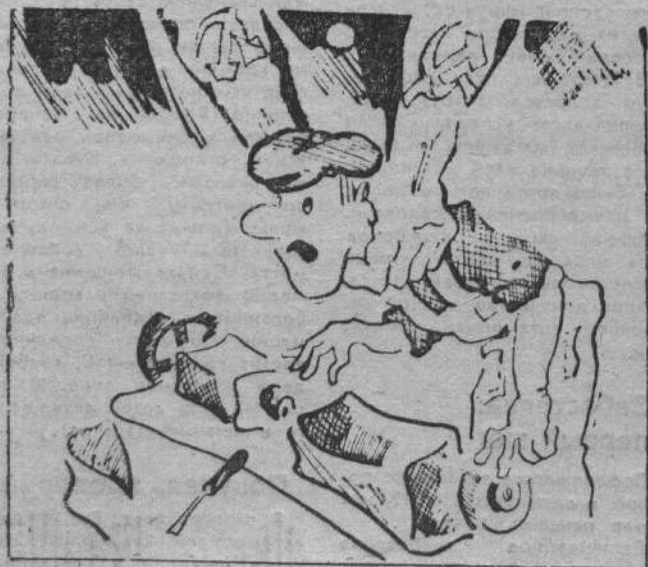
— Даешь социальный взрыв!

Консультации по вопросам налогообложения физических лиц можно получить по телефонам: 2-05-34, 7-78-14; или в кабинетах 507 и 517 налоговой инспекции, по адресу: г. Североморск, ул. Сгибнева, 13. ГОСНАЛОГИНСПЕКЦИЯ.