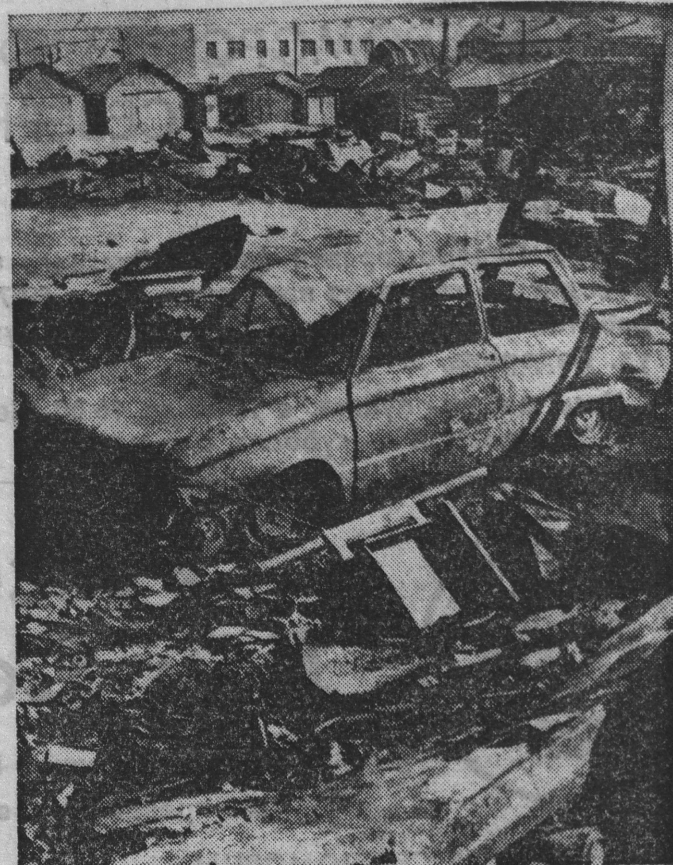
Пожар в гаражном городке Североморска-1 — самый крупный за последние десять лет. Пожалуй, только взрыв на ракетно-технической базе превосходит нынешнее несчастье по масштабам и степени опасности для жизни и здоровья людей.