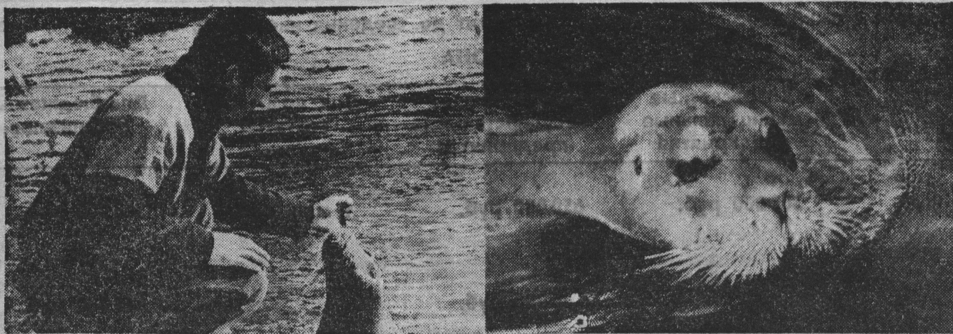
В Мурманском океанариуме открыт новый сезон.