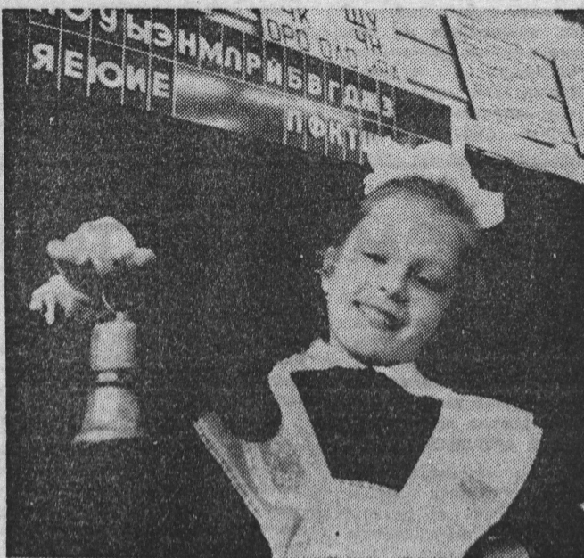
Впереди — каникулы!