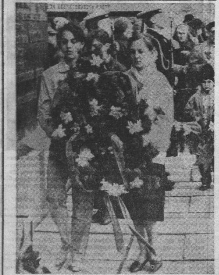
Североморск, 9 Мая...