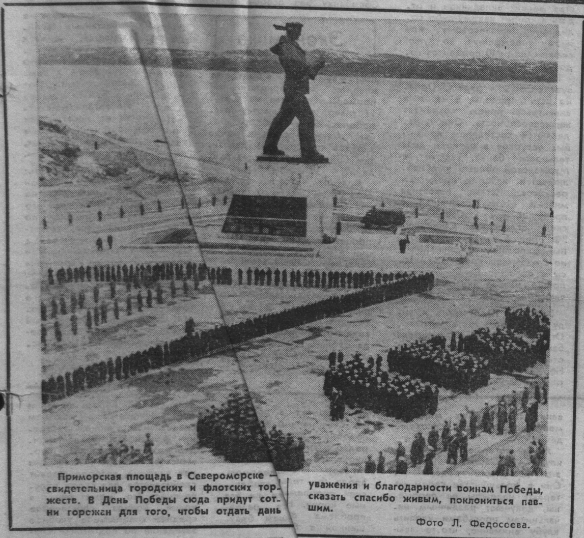
Приморская площадь в Североморске — свидетельница городских и флотских торжеств. В День Победы сюда придут сотни горожан для того, чтобы отдать дань

Межгородская общественно- политическая газета СУББОТА 7 МАЯ 1994 год № 53—54 (60—61) Цена договорная