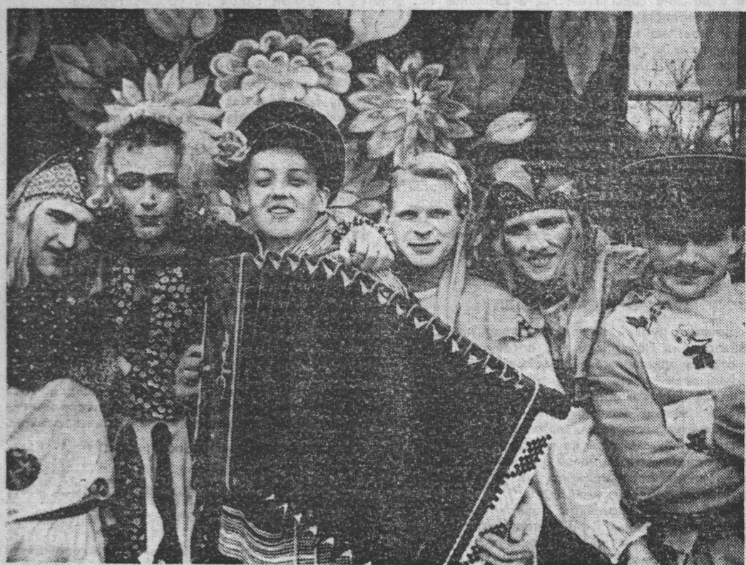
1 Мая на Приморской площади.