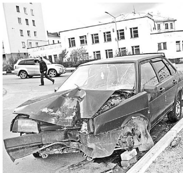
Разбитый ВАЗ так и стоит на Сев.Заставе как памятник человеческой беспечности.

Печальные примеры таких происшествий есть. На 10-м километре дороги Североморск-Североморск-3 6 июля в 10.20 автомобиль ВАЗ, за рулем которого был нетрезвый молодой человек, слетел в кювет и перевернулся. Пострадавшие пассажиры, очевидно, также находящиеся в состоянии алкогольного опьянения, были госпитализированы в ЦРБ. Затем, по неофициальной информации, они поспешно покинули стены больницы. На улице Северная Застава 14 июля в полпервого ночи в сильнейшем алкогольном опьянении водитель ВАЗа отправился на штурм световой опоры. Машина разбита и вряд ли