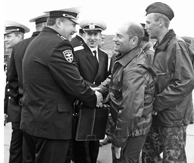
День авиации ВМФ ознаменовался для служащих авиабазы радостью встречи с товарищами.

благодаря помощи летчиков Тихоокеанского флота. Думаю, общение с коллегами было особенно полезным: и мы у них многому научились, и они у нас. Мы выполнили все поставленные задачи по поиску подводных лодок, по обеспечению ракетных стрельб, по осмотру районов и вскрытию надводной обстановки. Но главное, что все вернулись живыми и невредимыми.