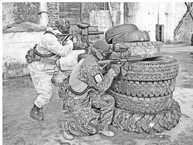
Стратегия, тактика и оружие у «Дельты» на высоте!