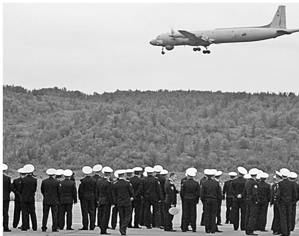
Перед торжественным построением все с волнением наблюдали за приземлением трех самолетов.

Поздравляю всех североморцев, в их числе уважаемых жителей улицы Кирова, с Днем Военно-морского флота!