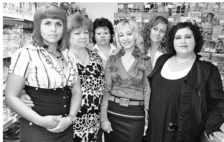
Победителем областного конкурса «Предприниматель года» стало ООО «Медведь». Немалая заслуга в этом сотрудников магазинов «Центральный», «Миллениум», «Лидер».