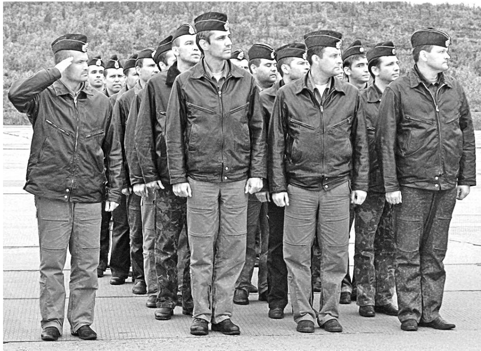
Летчики, совершившие двухдневный перелет, отличались от коллег отсутствием парадной формы и присутствием южного загара.

17 апреля, аккурат в День авиации ВМФ, на родную базу в Северноморск-1 вернулось несколько самолетов, представлявших Северный флот на масштабных оперативно-стратегических учениях «Восток-2010». Возвращение 21 летчика совпало с торжественным построением всего личного состава авиабазы.