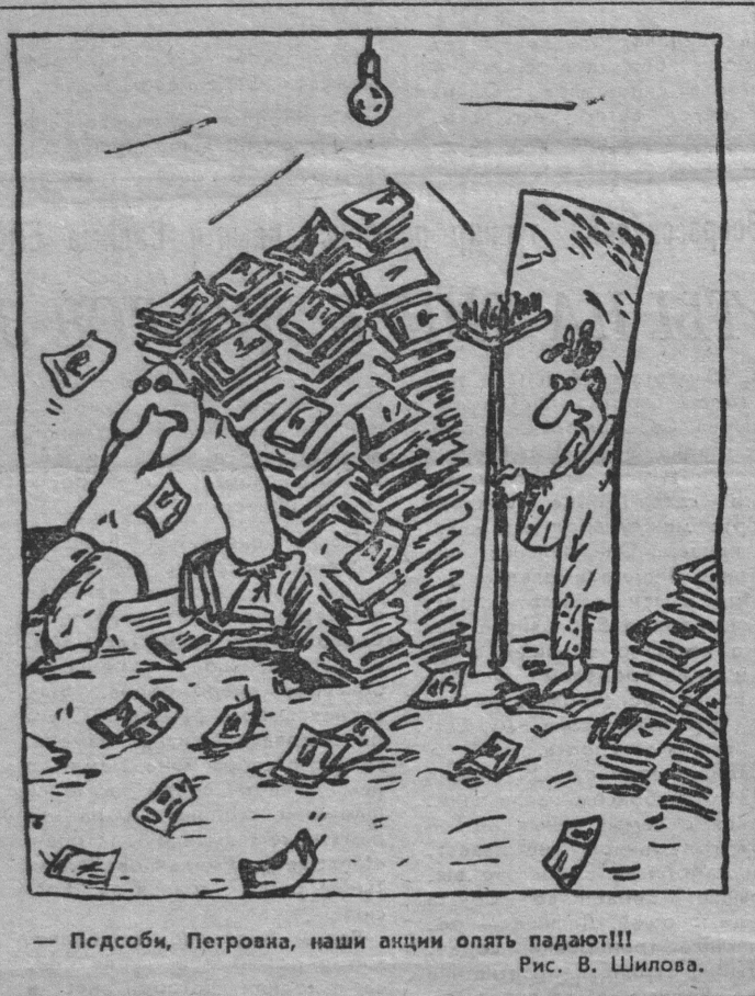
— Пасибя, Петровна, наши акции опять падают!!! Рис. В. Шилова.