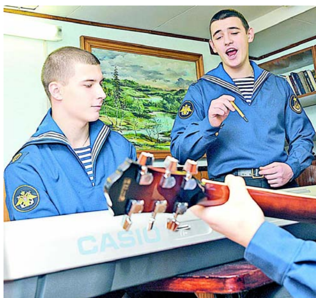
Репетиции корабельного ВИА идут полным ходом.

Любители народной музыки уже ждут выступле-