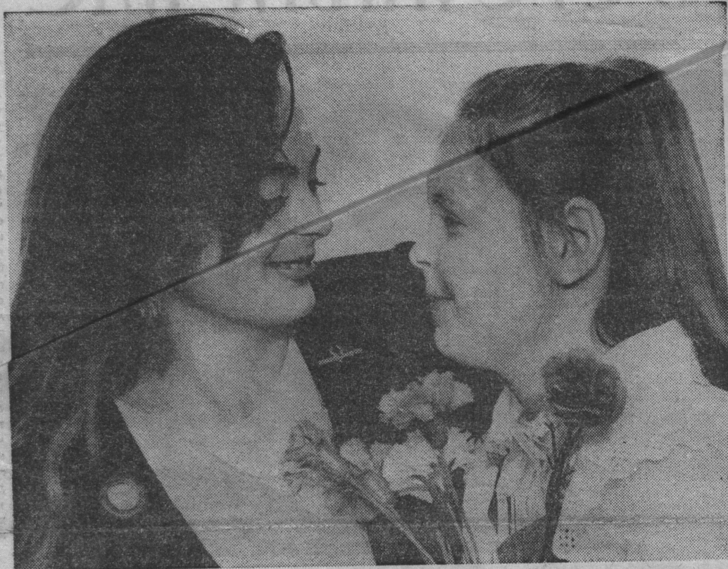
Цветы для мамы!