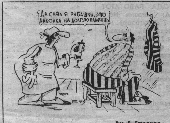
Рис. В. Евтушенко.