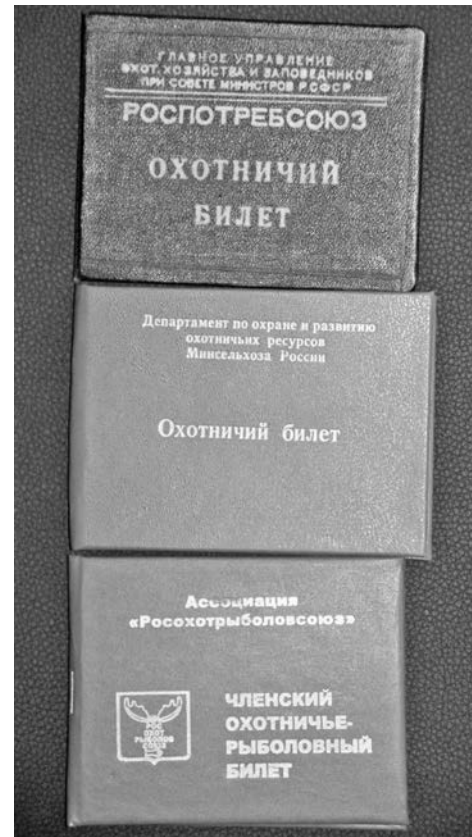
Уже в июле на смену таким разным охотбилетам должен прийти единый для всей страны.

Подготовила Ирина ФИЛИППОВА.