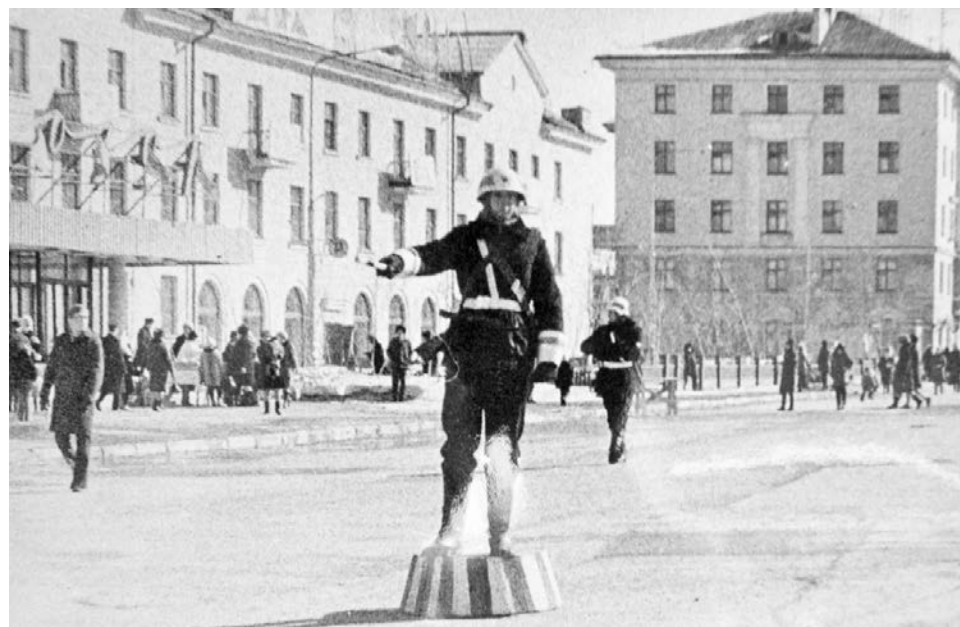
В 1970 году движение на площади Сафонова регулировали военные.