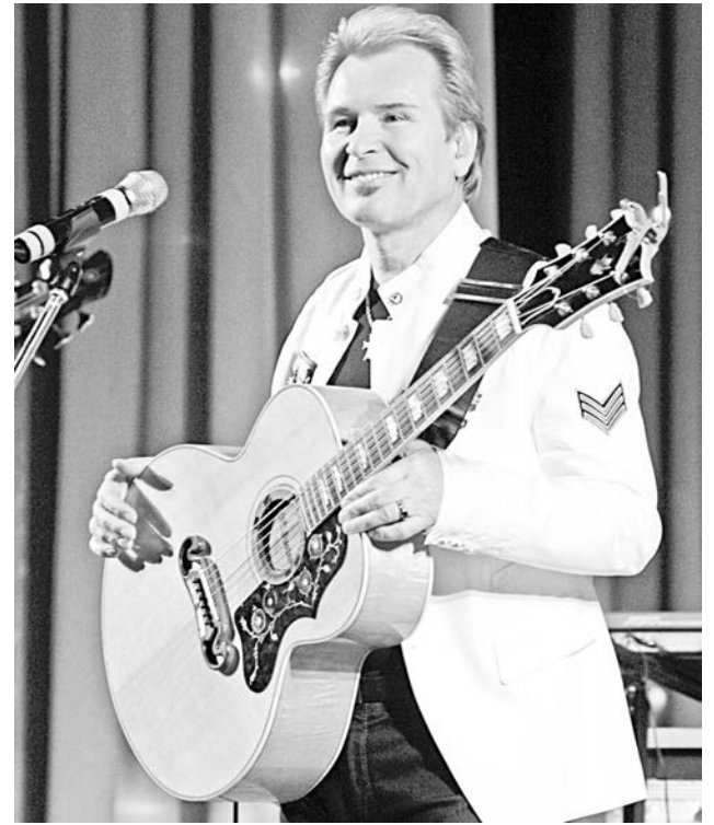
Чреду поздравлений на праздничном вечере в ДК «Строитель» продолжил народный артист России Александр Малинин.