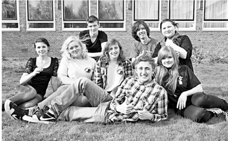
В Голландии наши гимназисты сдружились с местными учениками и теперь общаются по Интернету.