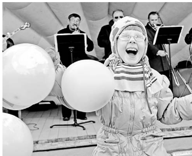
Для радости ребенку много не надо – сгодится простой воздушный шарик.