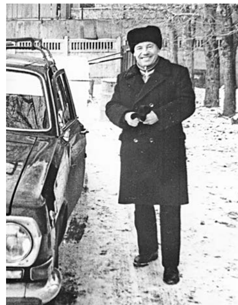
Редкий снимок главного героя. 1974 год.