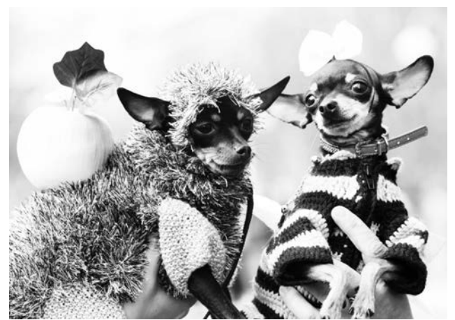
Пускай не неделя, но высокой собачьей моды прошла на ура в праздничный день в Североморске.