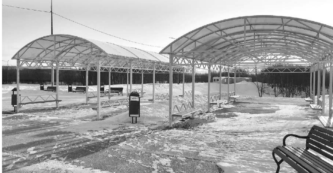
На новом городском кладбище предусмотрены крытые места для прощаний.

Со следующей недели начнет функционировать новое городское кладбище. Финальной точкой в реализации этого проекта стало оформление необходимых документов, а также набор сотрудников.