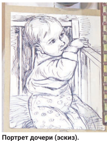
Портрет дочери (эскиз).