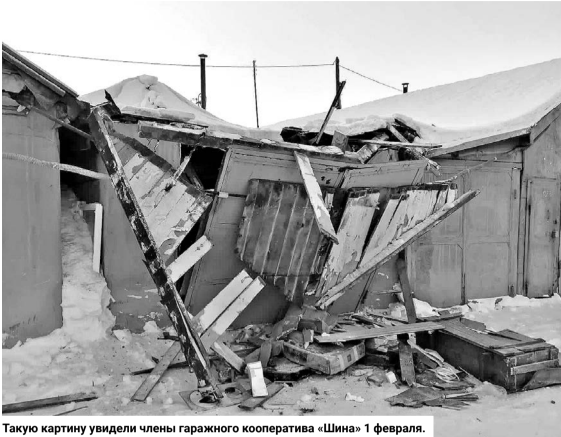
Такую картину увидели члены гаражного кооператива «Шина» 1 февраля.