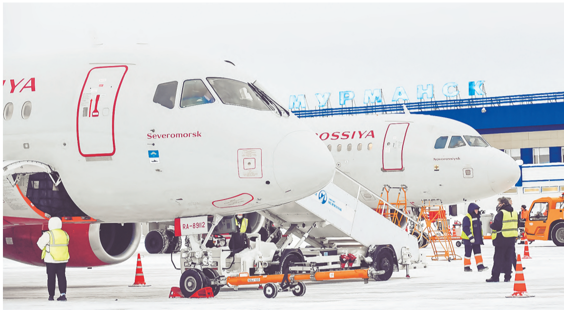
Самолет авиакомпании «Россия» с гордым именем «Североморск» встал под разгрузку-погрузку в мурманском аэропорту.

ра Евгения Светланова. Практика эта продолжается: летают «Ломоносов», «Гагарин», «Высоцкий», «Бродский», «Ожегов» — всего порядка двухсот именных бортов.