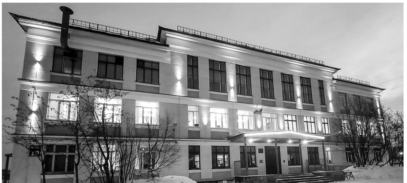
Старейшая школа Североморска с новой архитектурной подсветкой заметно преобразилась.