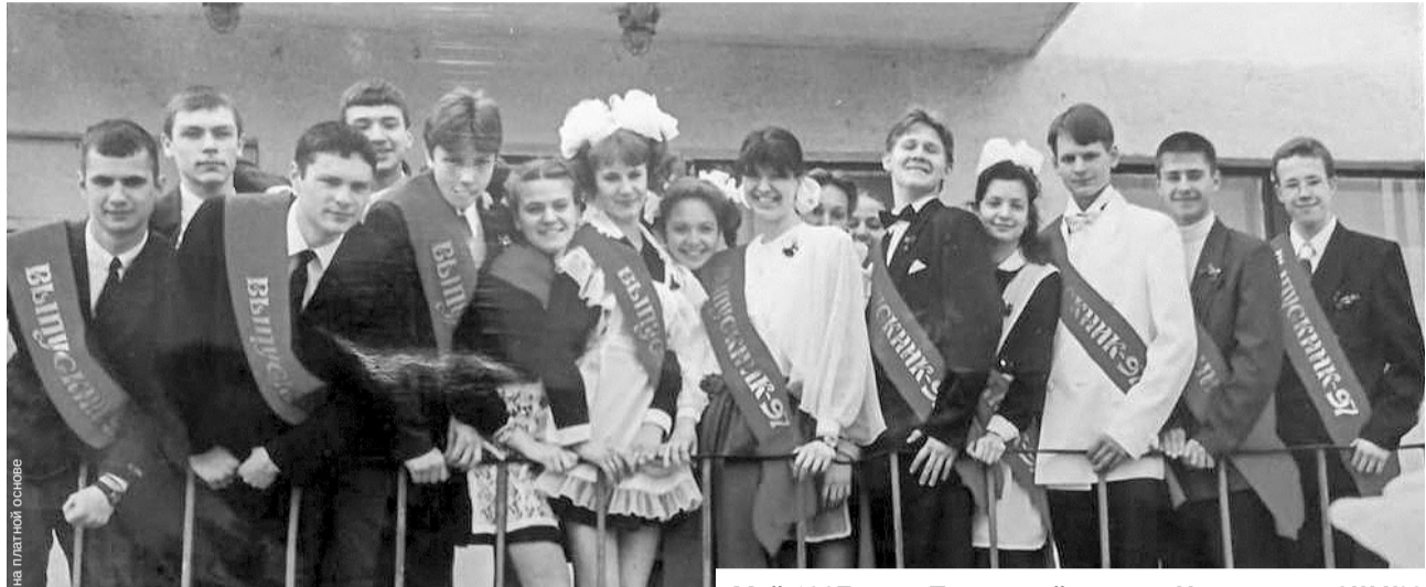
Май 1997 года. Последний звонок. На крыльце СШ №9 выпускники 11 «А» и «В» классов.