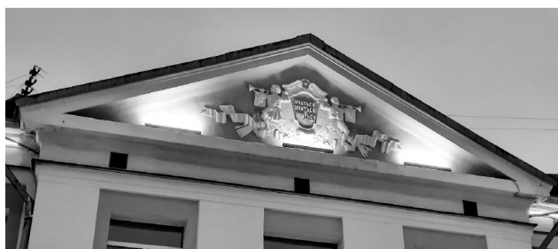
Советская изюминка бывшей начальной школы №14 (ныне ЦДО) теперь не останется незамеченной.