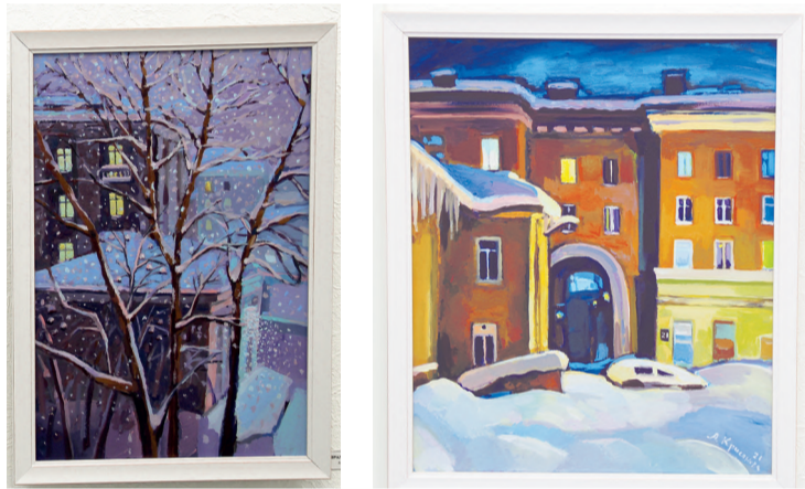
«Двор на Октябрьской», «Февраль. Снежный вечер» (холст, акрил, 2021 г.).