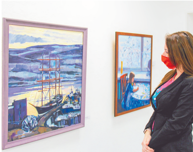
У картины «Скоро весна» (холст, акрил, 2010-2011 гг.).