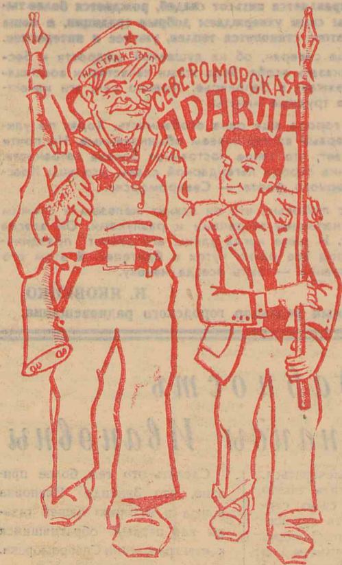
Отличное содружество — Пера, труда и мужества! Дружеский шарж худ. О. Туркова.

А. МИЛАНОВ, наш спец. корр. пос. Териберка — г. Североморск.