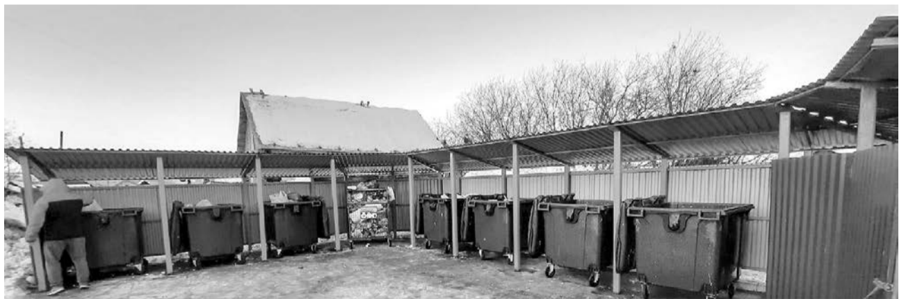
Контейнерная площадка на ул. Школьной, 15, теперь выглядит эстетично и опрятно.

Также во время рейда глава муниципалитета оценил модернизацию контейнерной площадки на ул. Школьной, 15. Здесь был произведен традиционный перечень работ: демонтаж старого материала, обновление бетонного покрытия, а также установка крытых конструкций, которые защищают баки от осадков и ветра. Также предусмотрен отсек с закрывающейся дверью для крупногабаритных отходов. Кроме того, в ближайшее время рядом с площадкой по просьбе перевозчика дополнительно появится сетка для пластика и стекла.