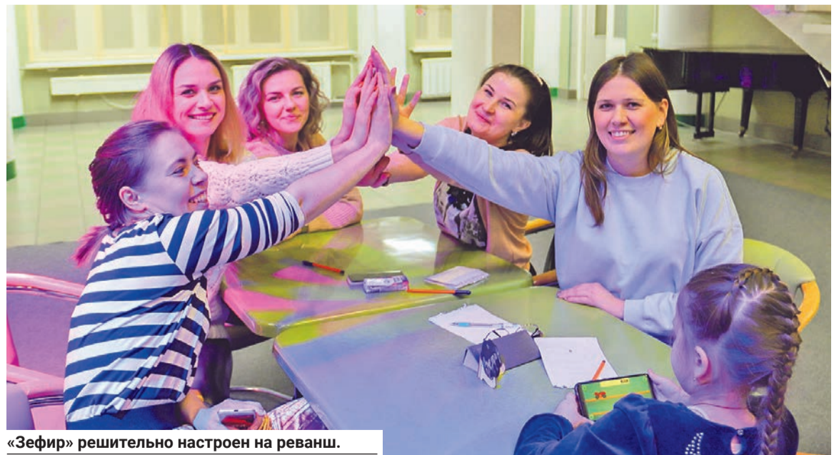
«Зефир» решительно настроен на реванш.

На этот раз «Зефир» стал вторым, уступив лидеру — команде «Продам гараж» — 4 балла. «Шары ярости» — третья, «Jazz» —