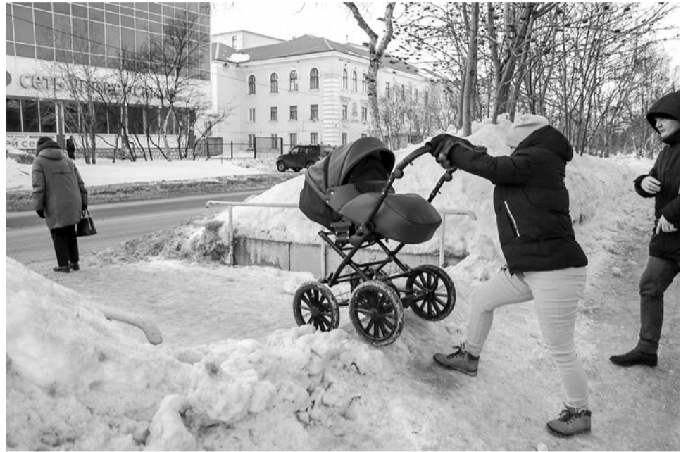
Тротуар почистили, переход забыли. На улице Советской жители поневоле осваивали новый вид спорта - ходьбу с препятствиями. Всем не понравилось.

Последним пунктом рейда был пешеходный переход напротив кинотеатра «Планета 51». Очистив и посыпав песком тротуары у домов № 25 и 20 по ул. Советской, компания «СеверАвто» оставила снежные барьеры