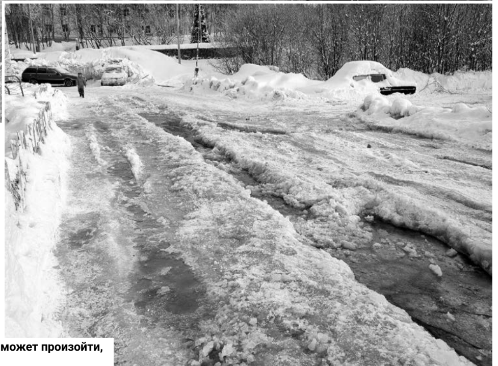
Наглядный пример того, что может произойти, если забилась ливневка.