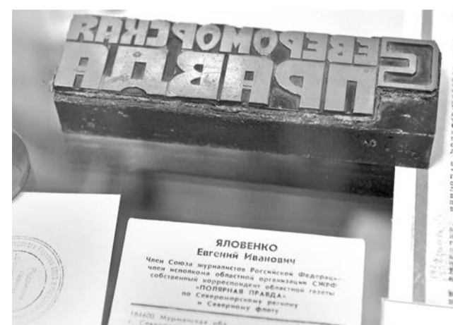
Та самая «шапка» газеты времен «Североморской правды».