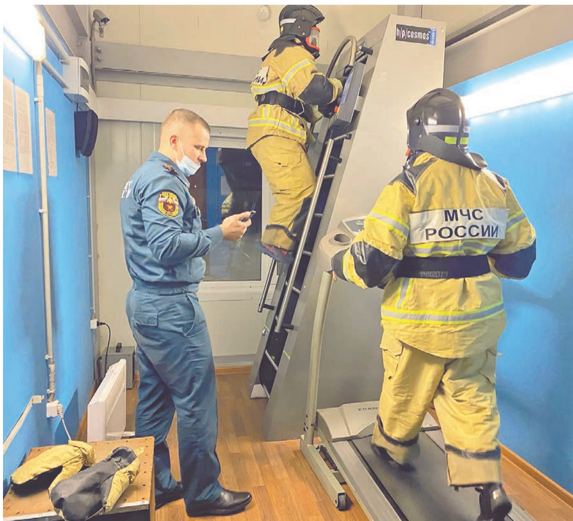
Участники команды «Бешенные лемминги» тренируются в теплокамере.