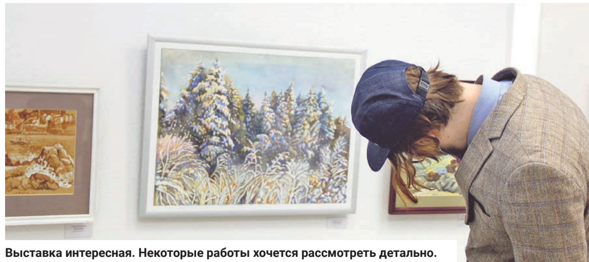
Выставка интересная. Некоторые работы хочется рассмотреть детально.