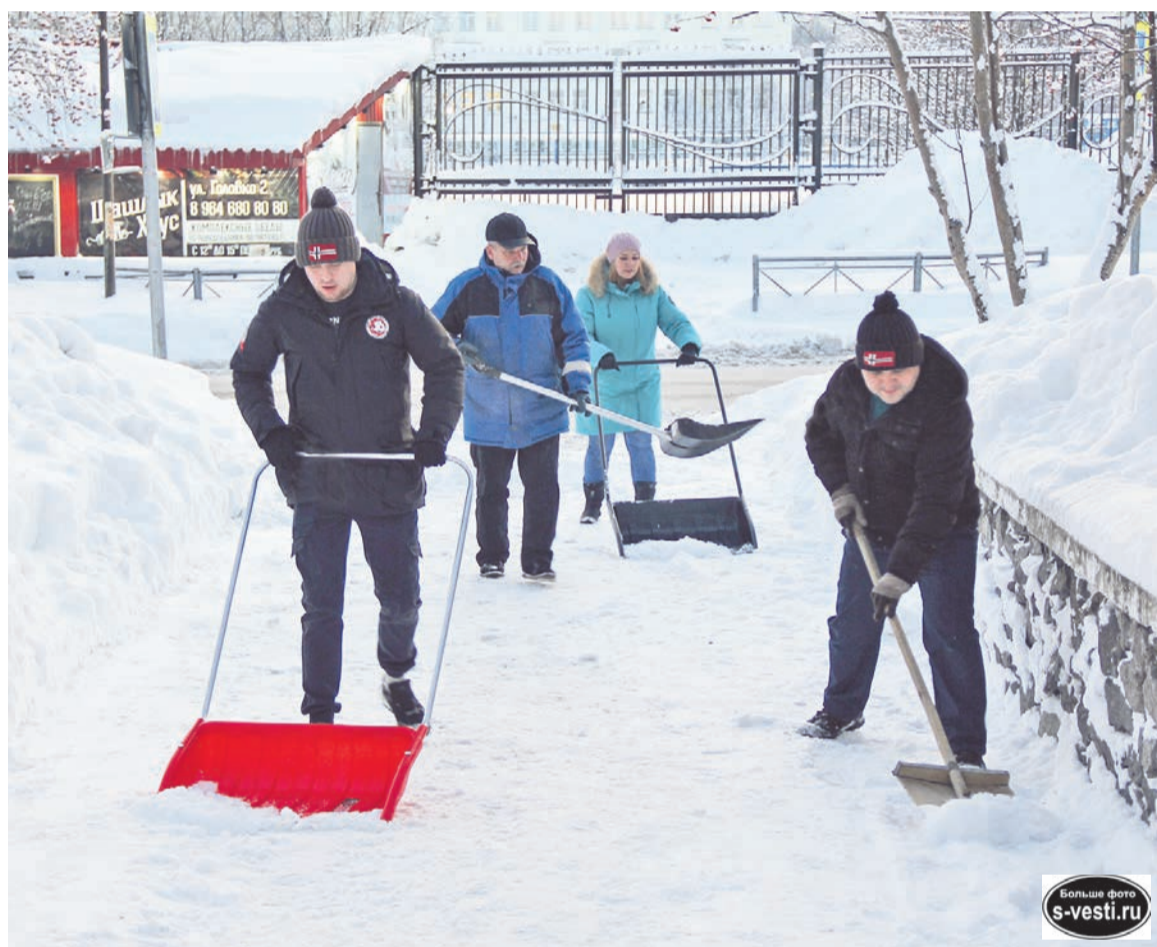
С таким коллективом и инвентарем можно и горы свернуть. Снежные.