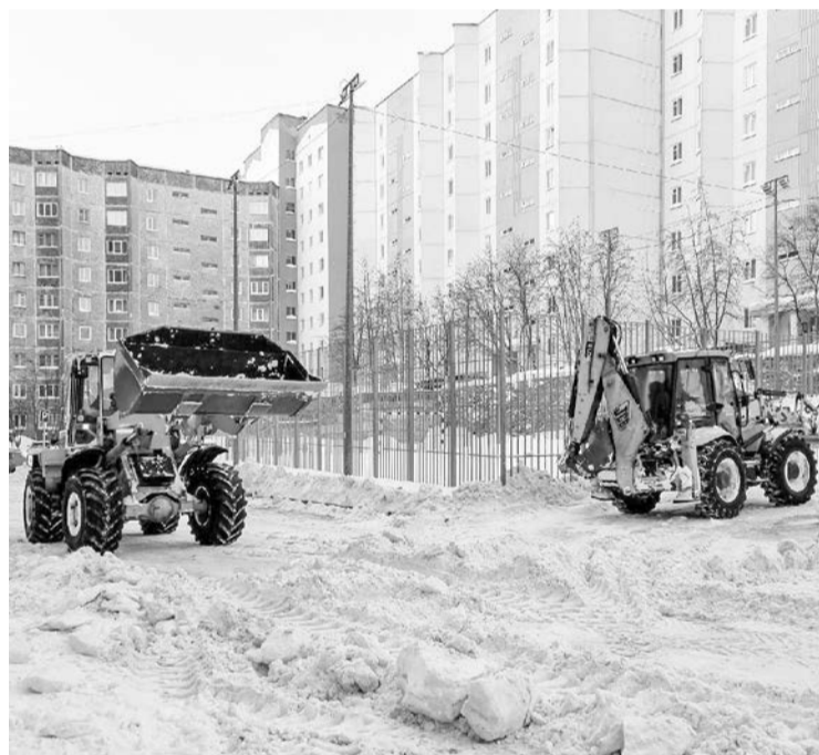
На Северной Заставе снег убрали со второй попытки: в первый раз помешал личный транспорт жильцов. Теперь неплохо бы потрудиться дворникам и очистить тротуары.