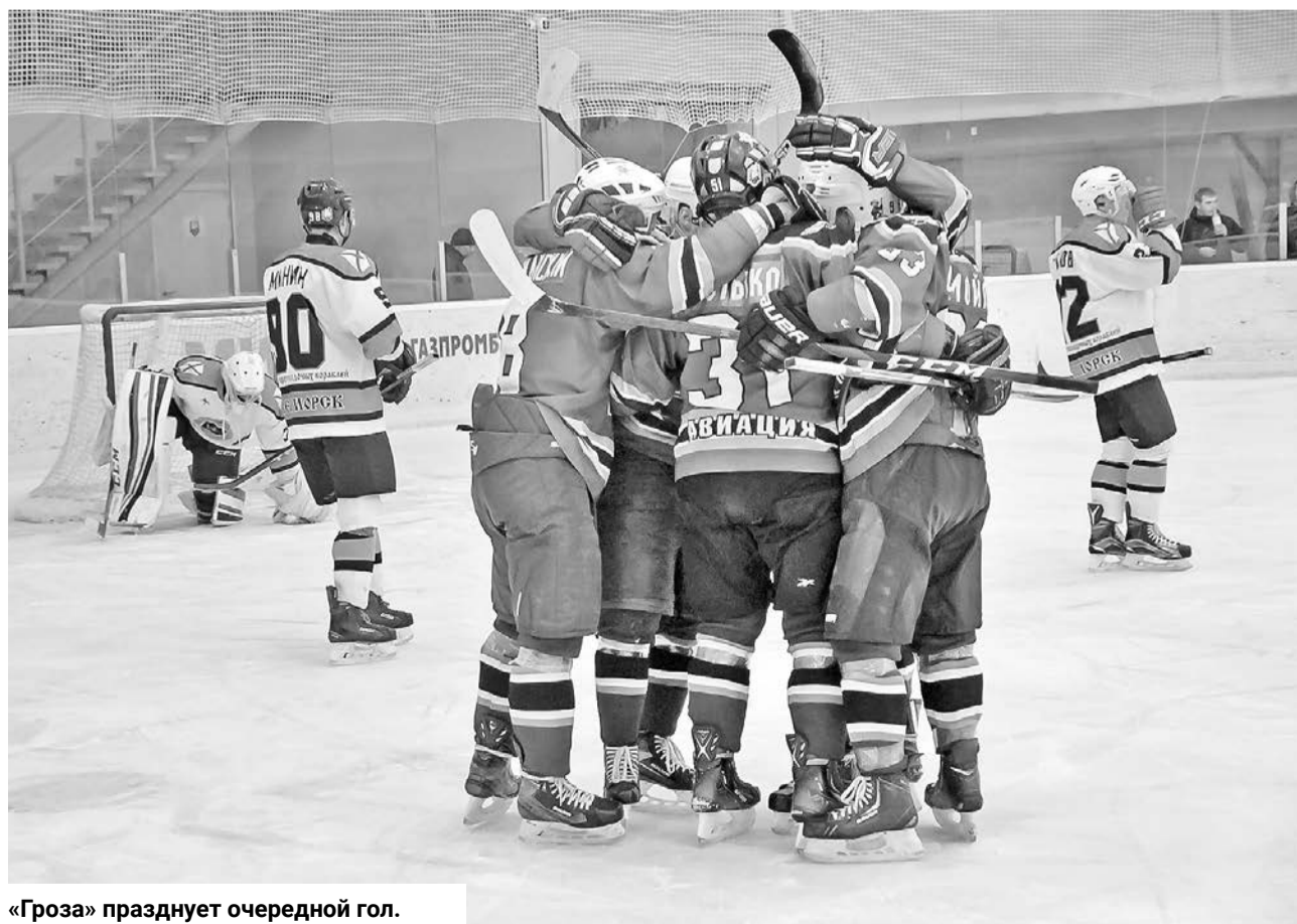
«Гроза» празднует очередной гол.