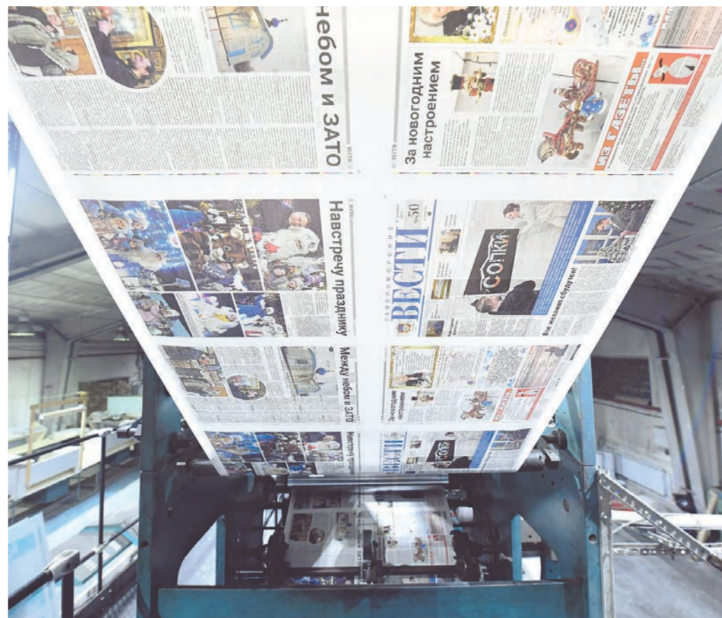
Архивных снимков того, как когда-то печаталась газета у нас не сохранилось, а сегодня это происходит вот так.