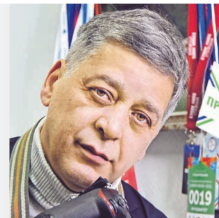
Лев ФЕДОСЕЕВ фотограф.

В дизайне газеты многое изменилось, и в этом есть мой вклад. Идеи по поводу оформления газеты, как и выбор иллюстраций, расположение материалов на полосе, мы обсуждаем с главным редактором. Что-то берется в работу, что-то нет. Бывает, что-то «не приживается» по разным причинам, но для меня важно, что я смогла это осуществить.