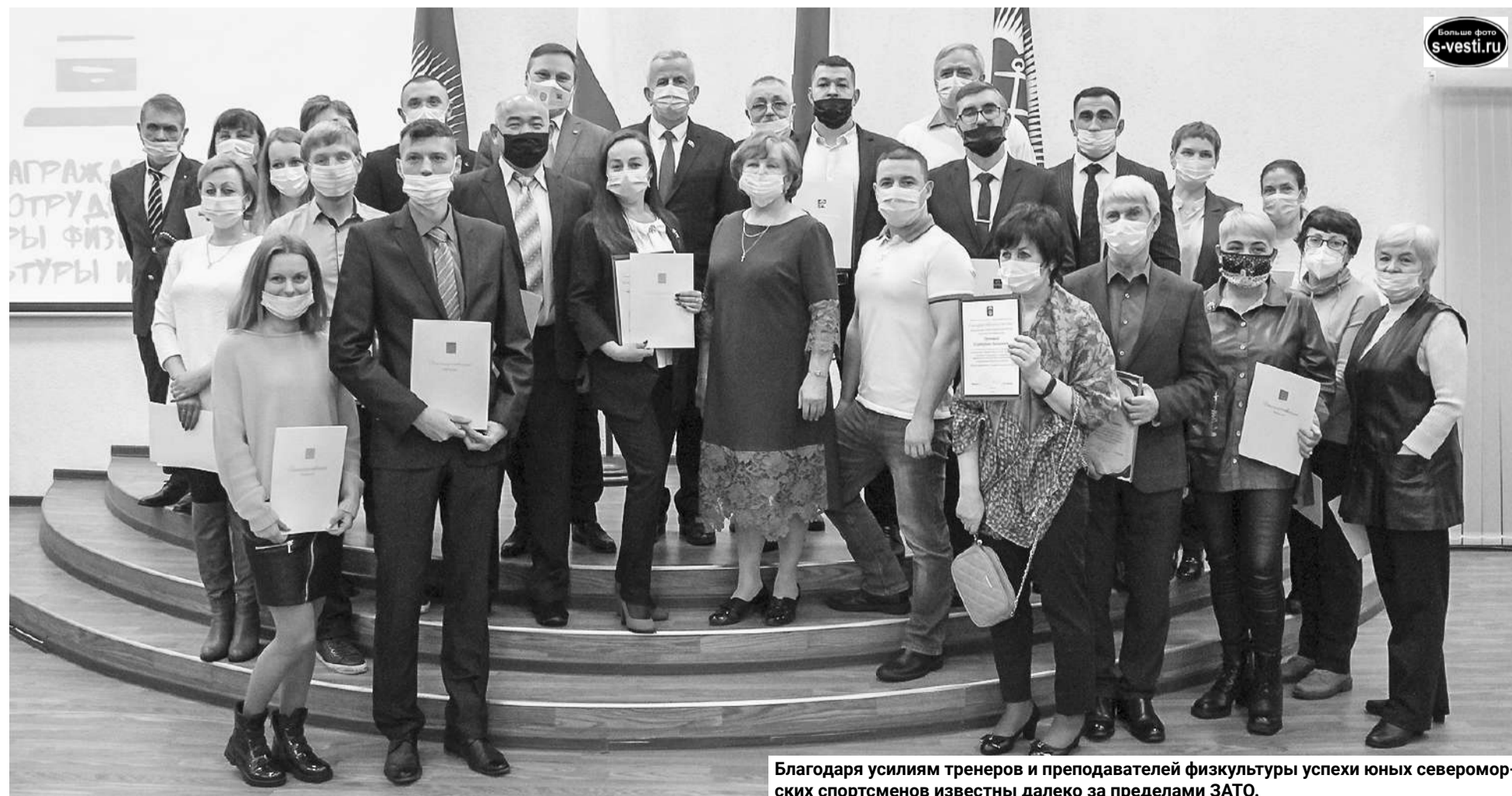
Благодаря усилиям тренеров и преподавателей физкультуры успехи юных североморских спортсменов известны далеко за пределами ЗАТО.