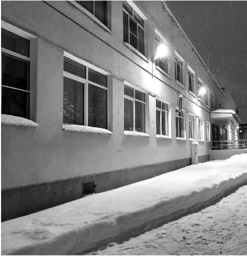
Позитивные перемены оценили и ученики, и педагогический состав лицея №1.