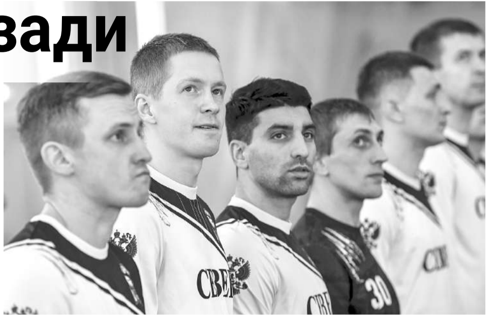
Команда «Север» — один из четырех коллективов, напрямую пробившихся в четвертьфинал.

Таким образом команды, занявшие первые два места в своих группах («Атлант», «Север», а также «Североморец» и «Маяк»), прошли напрямую в четвертьфинал. А вот коллективы, занявшие места с 3-го по 6-е, должны теперь преодолеть дополнительную стадию в виде одной восьмой финала. На этом этапе между собой померятся силами «Петр Великий» — «Универсал», «Профсоюз СФ» — «Адмирал Ушаков», «КЛФ» — «Гроза» и 82 СРЗ — «Фортуна». Квартет победителей сыграет с четверкой лучших коллективов по итогам группо-