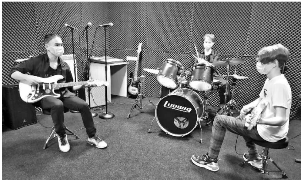
Изиюминка североморских «Сопок» - музыкальная студия.

В субботу, 18 декабря, в Североморске с рабочим визитом побывал глава Мурманской области Андрей Чибис. Первым делом губернатор принял участие в церемонии открытия молодежного пространства «Сопки», расположенного на ул.Морской, 10.