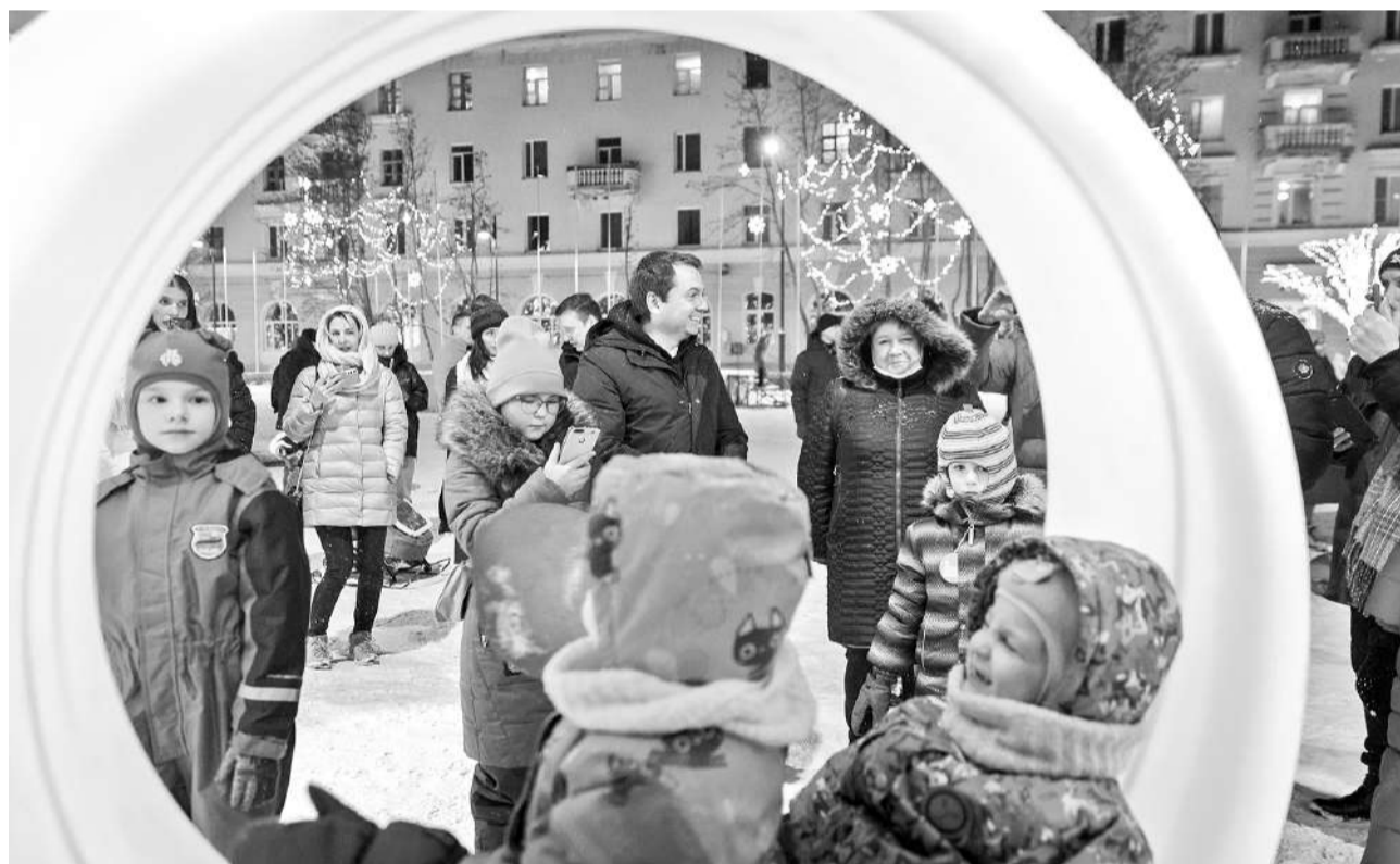
Андрея Чибиса порадовало новогоднее украшение ул.Сафонова и большое число ее посетителей.

ные формы. Замечательная праздничная иллюминация, украшения, много детей гуляет, фотографируется, качается на новых качелях. Видно, что улица Сафонова радует горожан, – поделился впечатлениями Андрей Чибис.