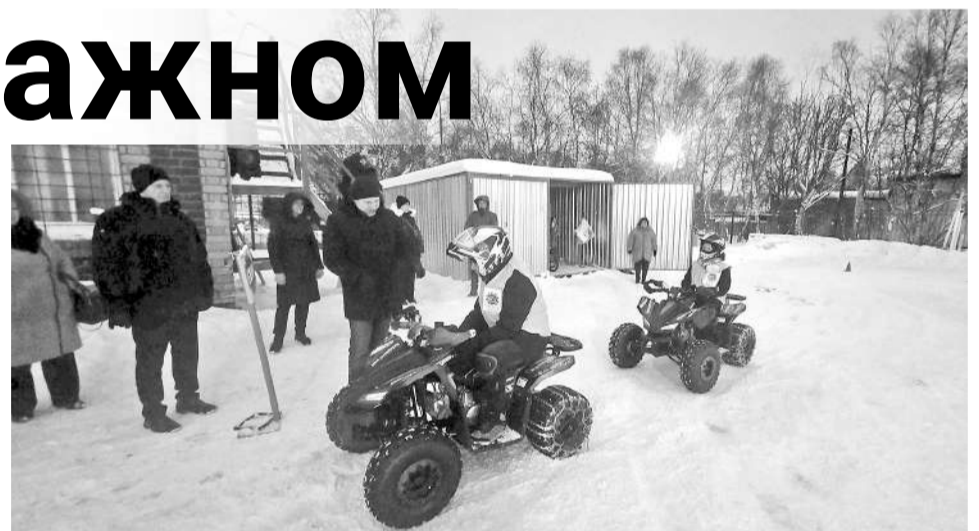
Ребята признаются, что изучать теорию параллельно с практикой намного интересней, и на каждое занятие бегут с удовольствием.