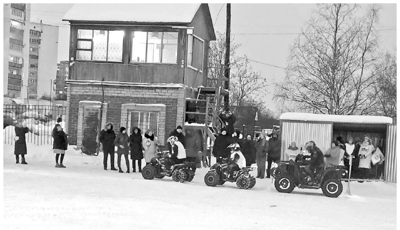
Навыки вождения детьми квадроциклов главу ЗАТО Олега Прасова впечатлили.