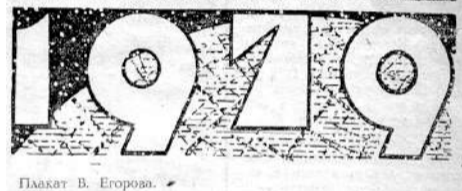
Плакат В. Егорова.