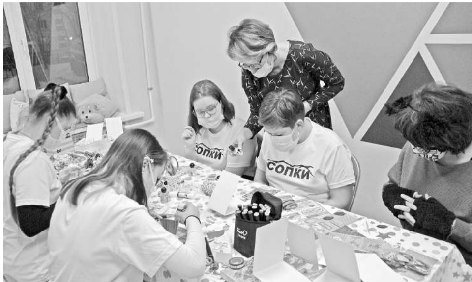
В комнате для рукоделия занимается клуб любителей аниме «Данкетсу».