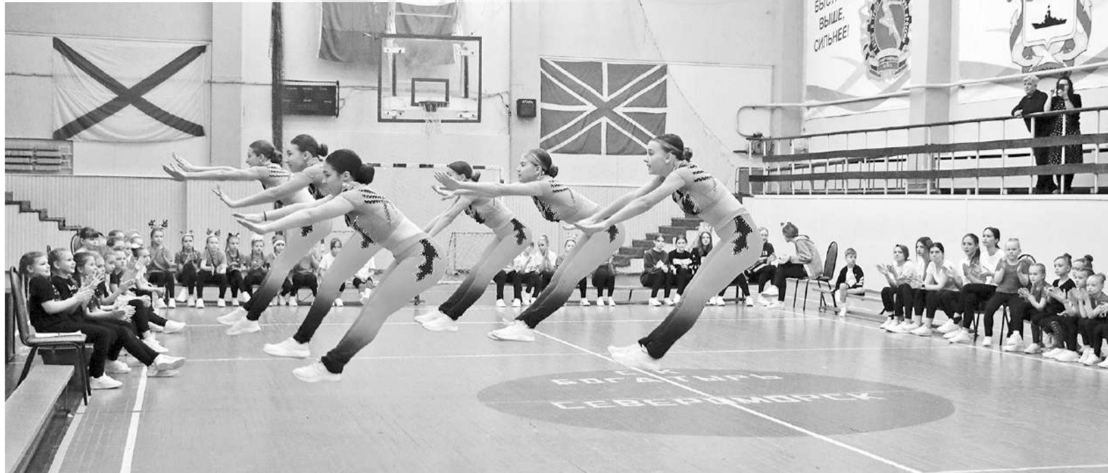
Команда «Акварель» (ДЮСШ №3) – чемпионы Северо-Западного федерального округа по фитнес-аэробике и премианты главы ЗАТО.

Переходя от станции к станции, мальчишки и девочки отжимались, прыгали на скакалке, садились на шпагаты, делали складки из положений стоя, сидя и лежа, показывали программы и набирали баллы. А уже вне состязаний маленькие спортсмены из клуба «Bionica kids», команд «Полет», «Nord West», «Акварель», «Умка» представили показательные выступления, а также участвовали в танцевальном