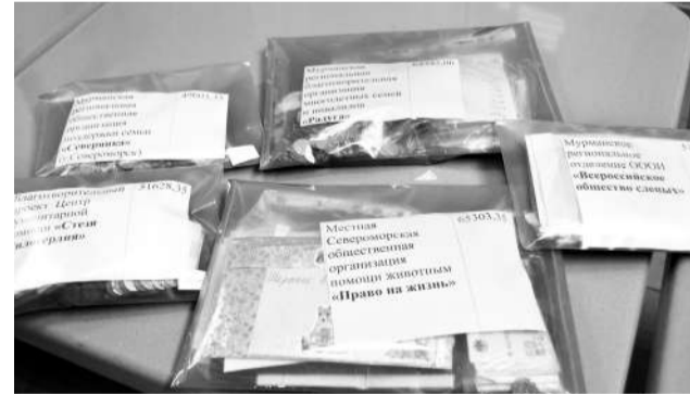
Конверты с деньгами, собранными в ходе марафона, вручены благополучателям.

Как отмечают организаторы марафона – администрация ЗАТО Североморск – среди постоянных щедрых благотворителей «Доброго образования», Управление культуры, спорта, молодежной политики и междуна-