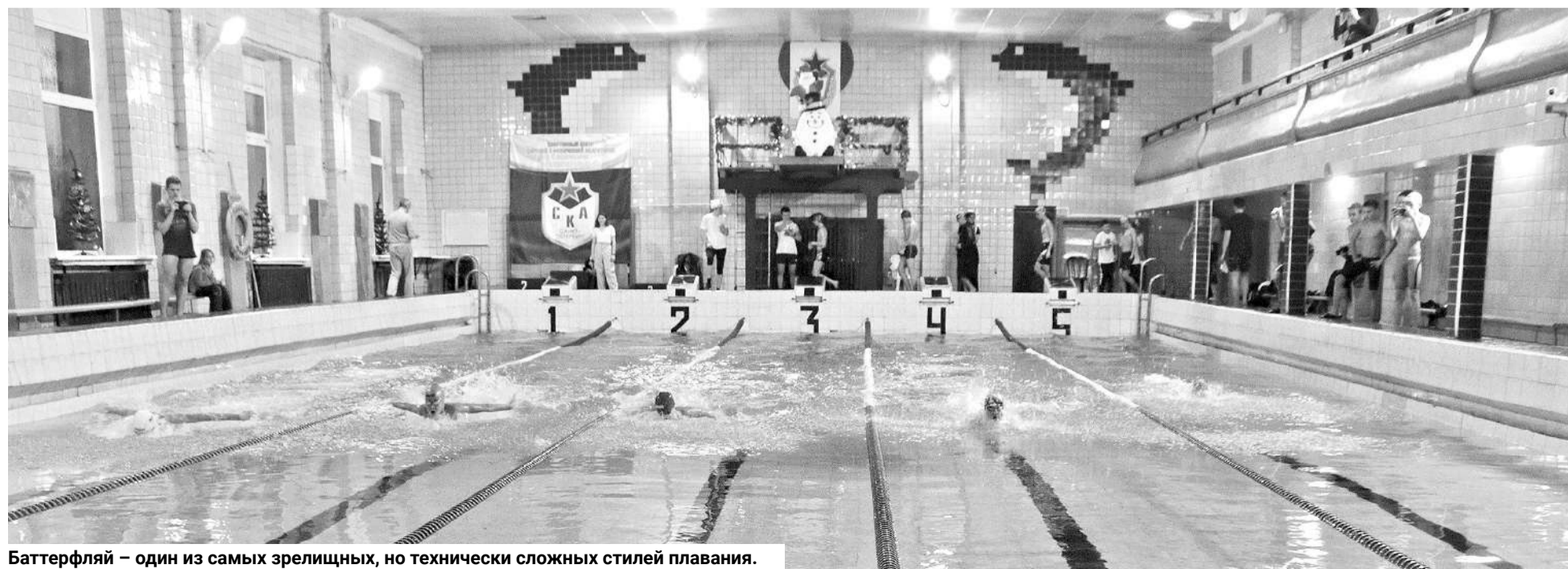
Баттерфляй – один из самых зрелищных, но технически сложных стилей плавания.