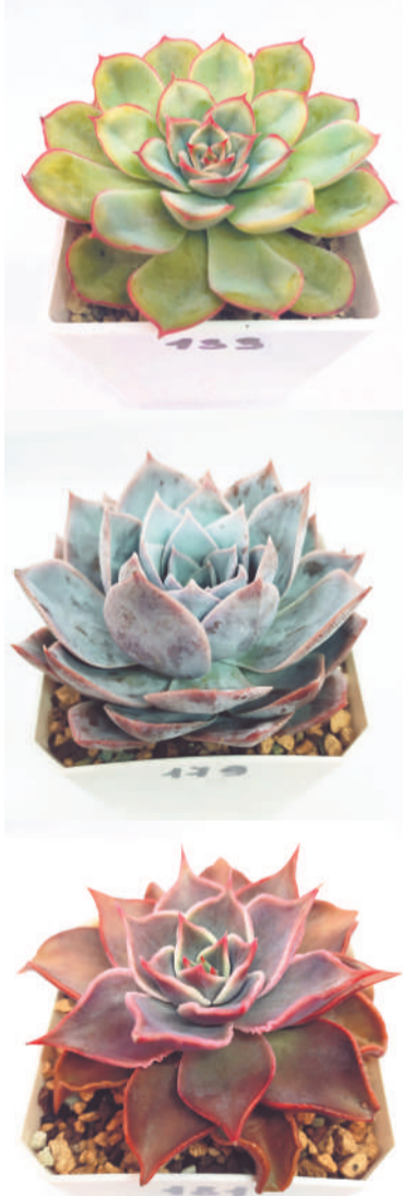
Эхеверия Пулидонис, Седум Суавеоленс, Эхеверия Мадоба. Чем не розы?!

– В Мурманской области, и в Североморске в том числе, много увлеченных разведением кактусов и суккулентов. Было бы здорово ор-