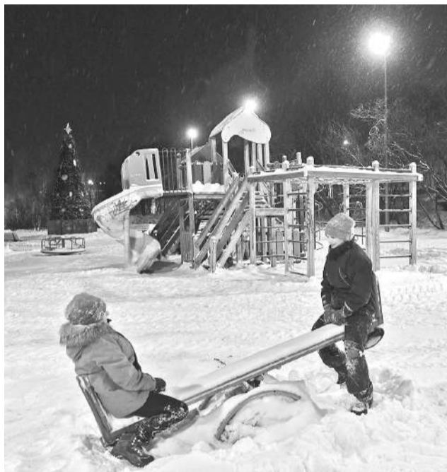
Освещение на детской площадке в п.г.т.Сафоново вдоль ул.Преображенского восстановлено.

Подготовила Наталья СТОЛЯРОВА.