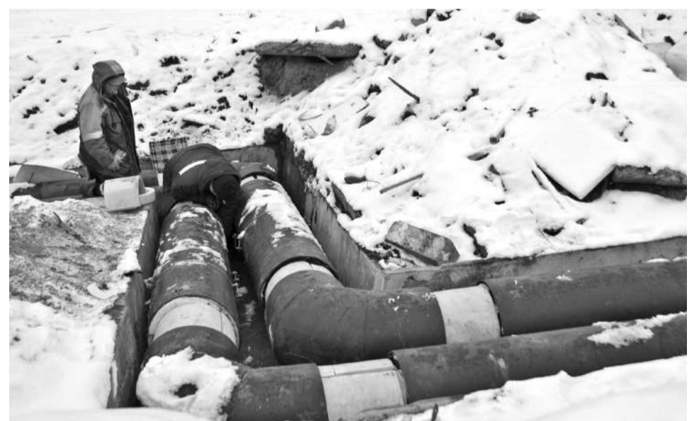
Большая часть обновленной теплотрассы в 2021 году пришлось на ул.Комсомольскую.

Засыпанная снегом лестница на ул.Падорина, 21, становится причиной обращений жителей к главе, в КРГХ, в ГЦ ЖКХ не первый год. Хотя данный объект находится на прилегающей к ТЦ территории и за его содержание отвечают владельцы здания. 9 декабря собственникам здания было направлено требование об очистке трапа в срок до 16 декабря - требование не исполнено. На данный момент собственникам направлено приглашение на составление протокола об административном правонарушении.