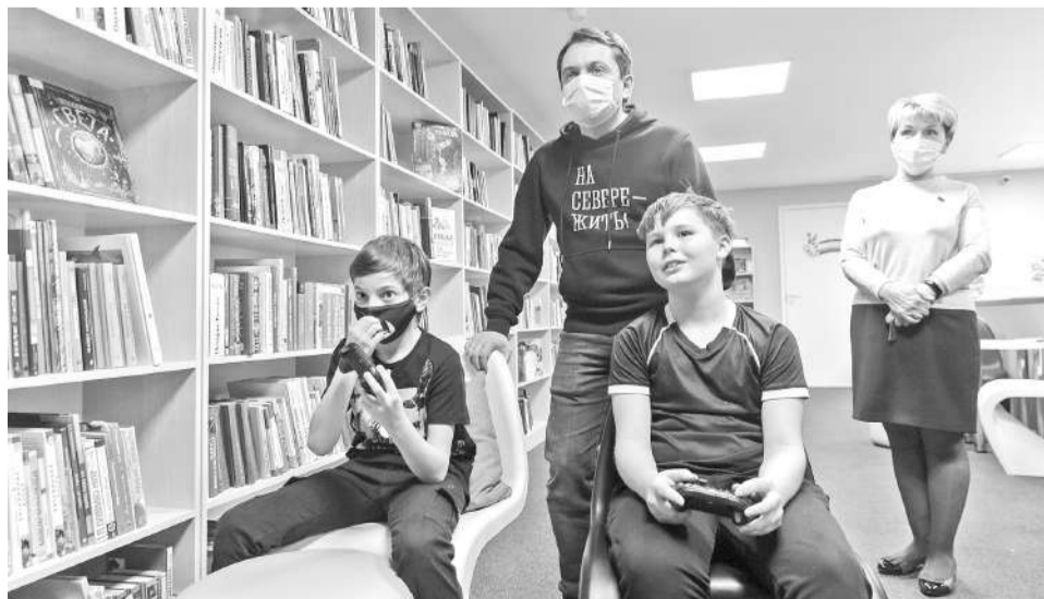
В модельных детских библиотеках сегодня можно не только книги почитать, но и поиграть в компьютерные игры.

Игорь ГЛУЦКИЙ.