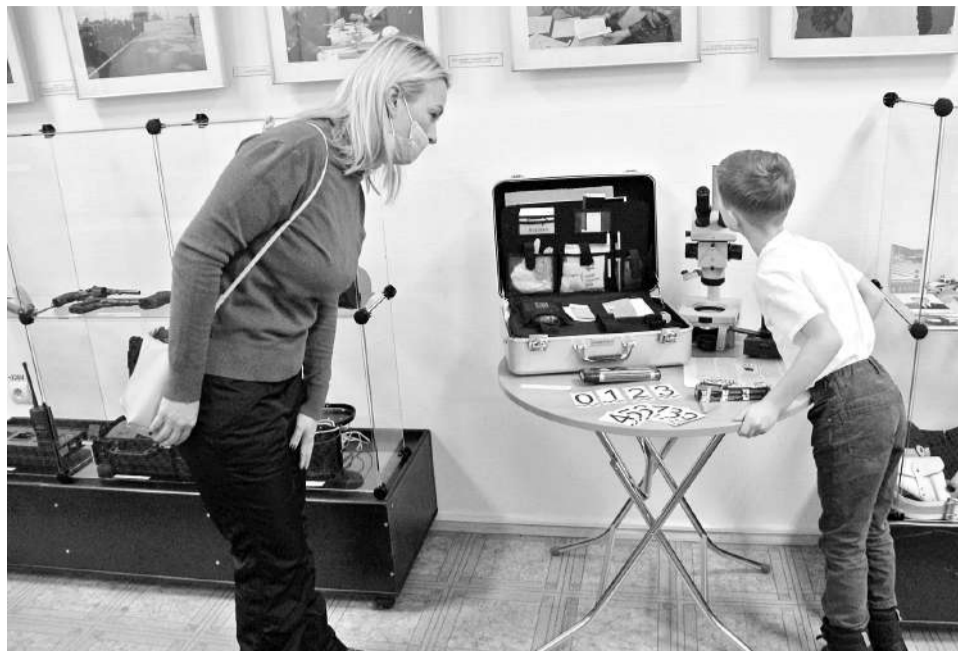
Любопытным мальчишкам на заметку: часть экспонатов выставки находится в открытом доступе и рабочем состоянии.

Помимо этого, можно найти экспонаты несколько иного рода – различные дипломы, награды, погоны, вымпелы, удостоверения. Есть поздравительная грамота, адресованная североморским милиционерам в связи с 80-й