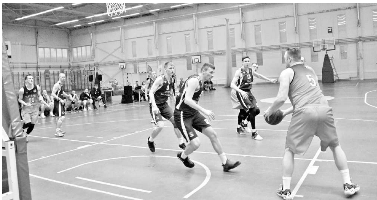
Финальный матч «Мост-сити» – «Северные медведи»: «медведям» в какой-то момент удалось сократить разрыв в счете до 13 очков, но коляне уверенно контролировали ход игры.