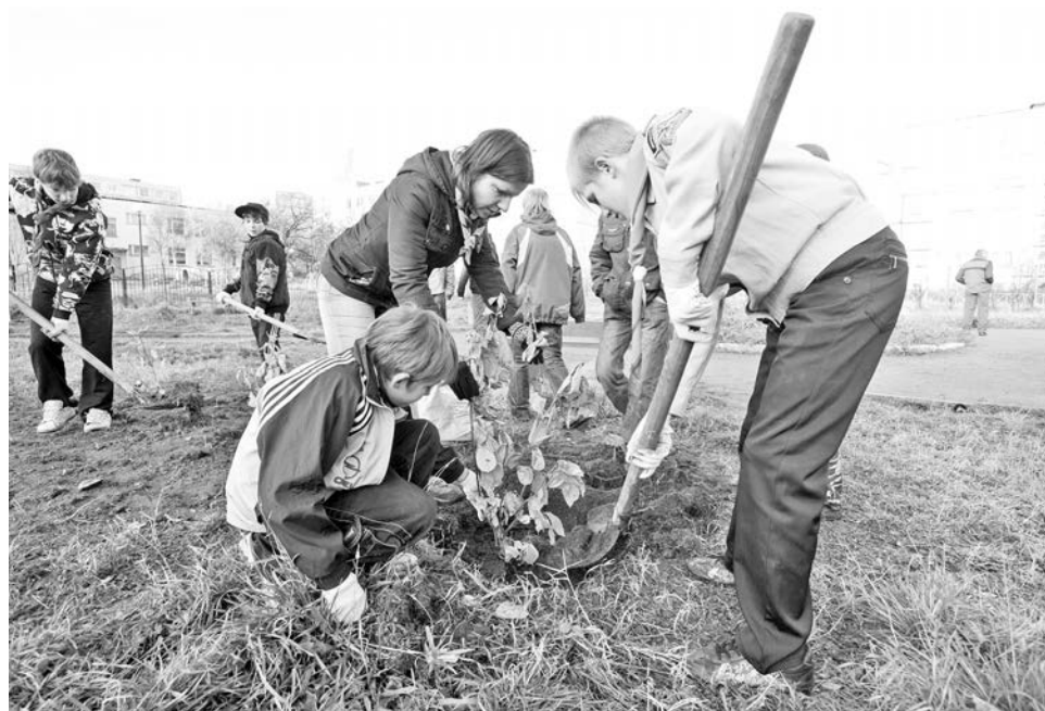
Теперь у каждого росляковского скаута в сквере есть свое дерево.

Ирина ПАЛАМАРЧУК.