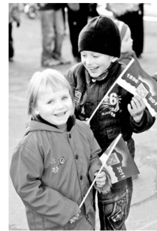
Дети - самые искренние участники праздника.