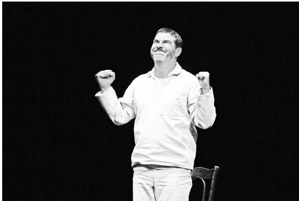
Фото- и видеосъемка спектакля были запрещены, но... зрители не устояли, чтобы не запечатлеть любимого артиста.

Спектакль действительно отличается от книжного варианта и видеoverсии. Многие эпизоды опущены, но от этого действие не менее увлекательно. Гришковец, как всегда, бесподобен в импрови-