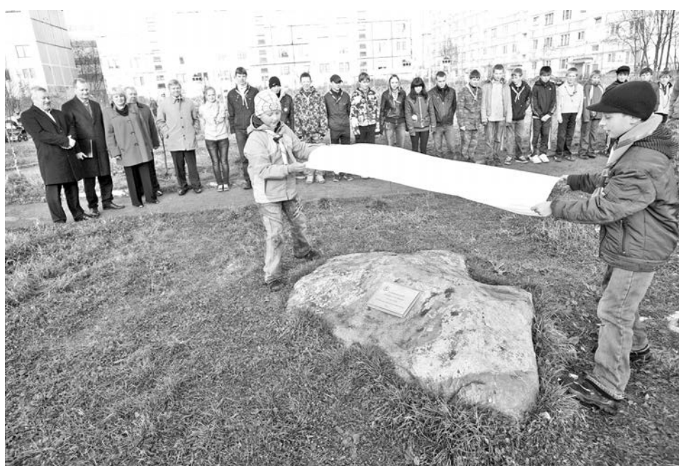
Скаутскую аллею считать открытой!