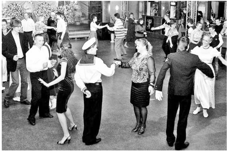
Таким был весенний бал «Мы встретились в Североморске!».