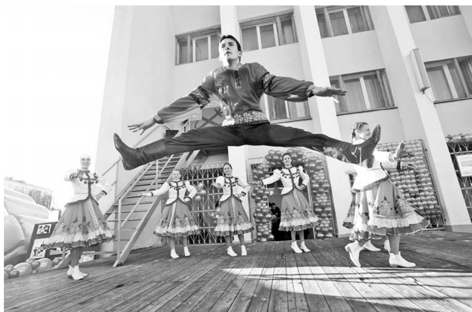
«Ухажер» - танцевальный подарок от ансамбля «Каблук» (ДК «Строитель»).