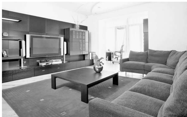
По такой комнате ничто не мешает передвигаться ни вам, ни потокам положительной энергии.

Подготовила Анна ВИХРОВА.