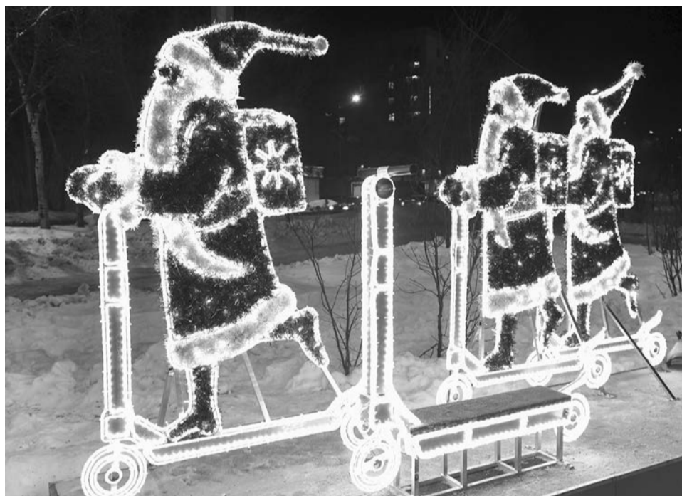
Новогодние фотозоны на ул.Советской.