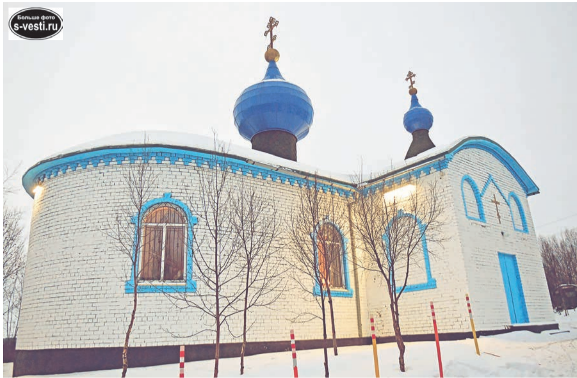
Скоро на росляковском храме воссияют новые кресты, а купола украсят звезды.

Многие удивятся, узнав, что храм во имя Архистратига Михаила в районе росляковского кладбища располагается на территории ЗАТО Североморск. Это следует из Постановления администрации муниципалитета №1202 от 3 декабря 2015 года.