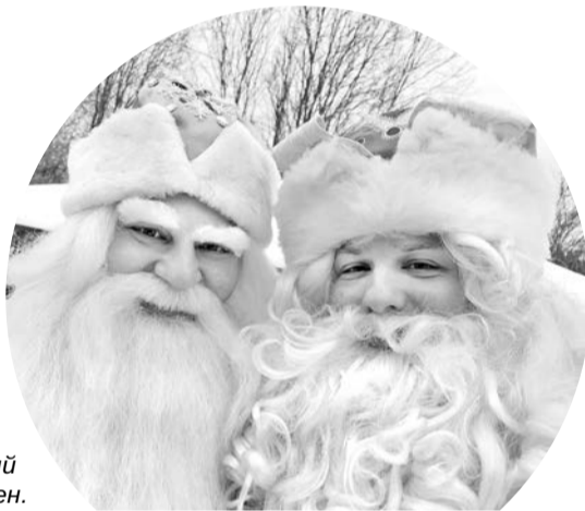
Оленегорский Морозко и североморский Дед Мороз.

Во второй день слета добрые волшебники с помощниками работали на социальных площадках, радуя детвору. Североморцам доверили поздравить с наступающим праздником местных школьников, добившихся успехов в учебе и спор-