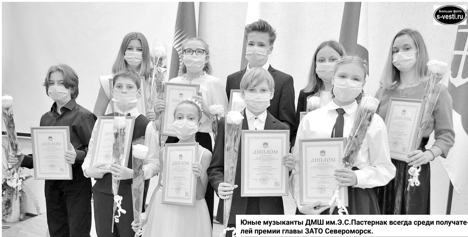
Юные музыканты ДМШ им. Э.С. Пастернак всегда среди получателей премии главы ЗАТО Североморск.