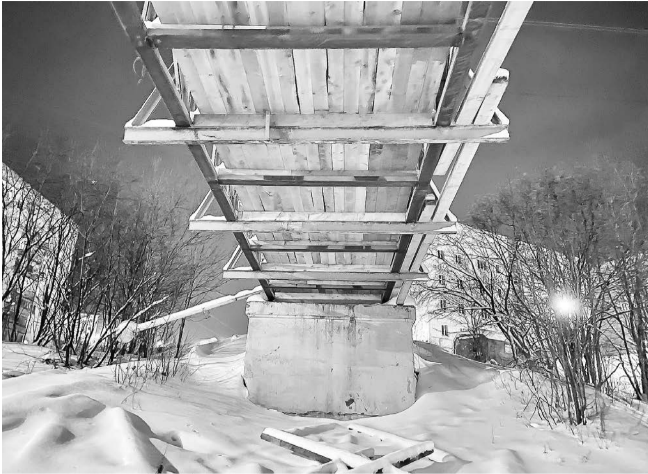
С момента открытия в марте 1959 года мост через ул. Душенова капитально не ремонтировался.