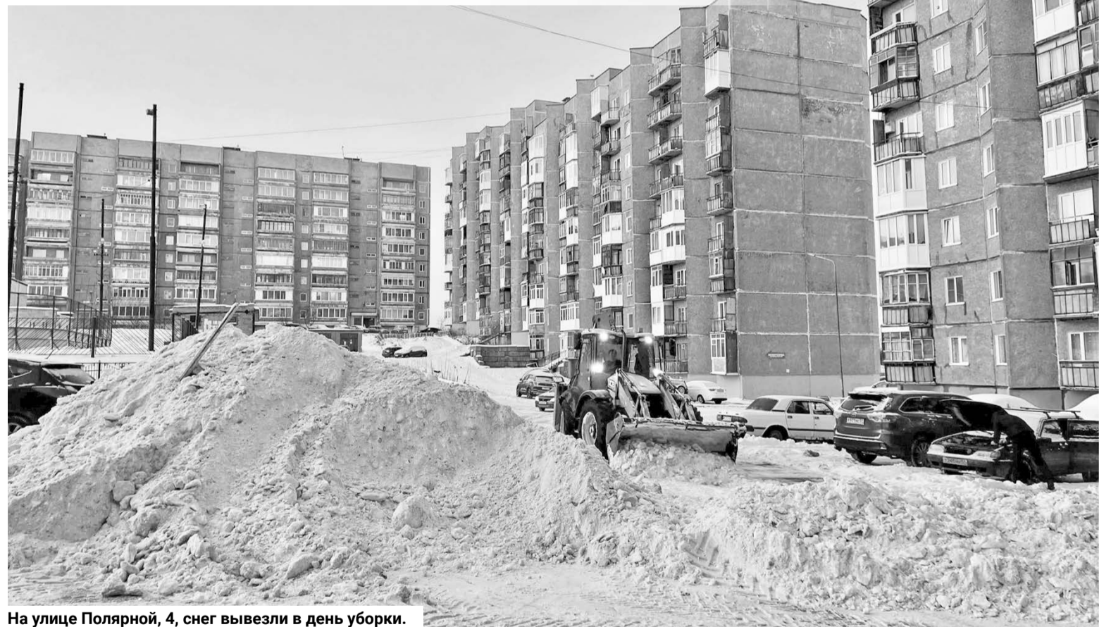
На улице Полярной, 4, снег вывезли в день уборки.