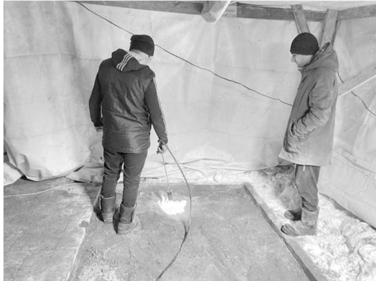
Перед укладкой тротуарной плитки в сквере у музея необходимо растопить снег и повысить температуру воздуха до плюсовых значений.

Сейчас подрядчик приступил к пуско-наладочным работам опор освещения. Для того чтобы отцентровать опоры и сами светильники, проводится санитарная обрезка деревьев. А уже на следующей неделе рабочие приступят к установке обрешетки на бутовой кладке. Изначально в проекте была предусмотрена обшивка только верхней части, однако муниципалитет принял решение