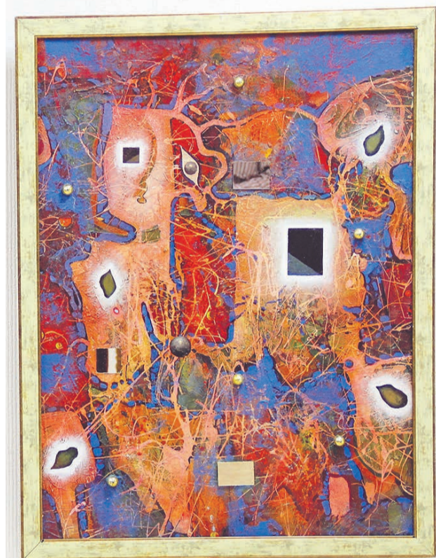
Иван Ворон, «Остановленный процесс разрушения», 1988 г. (холст, масло, коллаж).