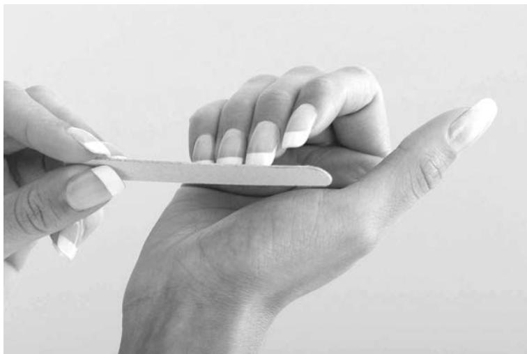
Правильно подобранная пилка – один из секретов здоровых ногтей.

И, в-шестых, одна из причин – низкокачественные лаки и жидкости для их удаления. Ацетон, конечно, с легкостью снимает покрытие, но при этом высушивает поверхность ногтя, уничтожая защитную жировую пленку. Поэтому лучше переключиться на жидкости без ацетона. Лаки же не должны содержать толуол, формальдегид, гекторит, инертный полиэстер и даже натуральный перламутр. Богатый кальцием перламутр может спровоцировать переизбыток этого минерала, что приведет к ломкости, сухости и образованию трещин.