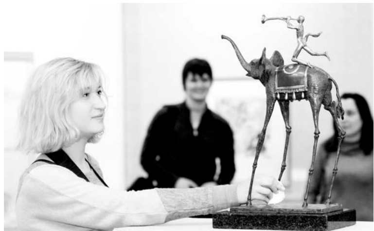
Трогать экспонаты руками строго запрещено, но некоторые зрители не смогли удержаться.