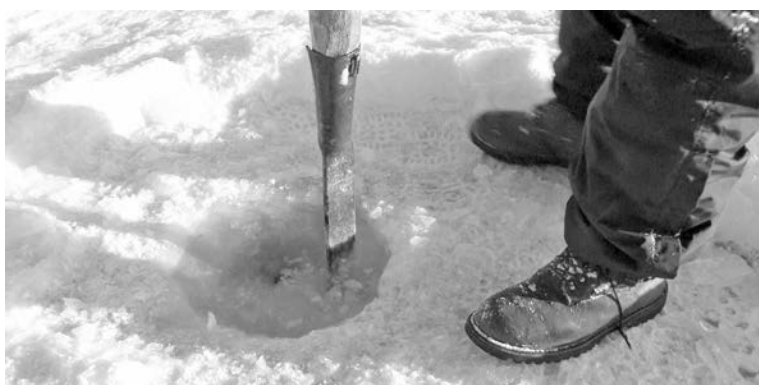
В пылу рыбацкой страсти новички нередко топят пешню, так что держите ее крепче.

предусмотрите так называемую спасалку . Ее можно приобрести в магазине или сделать самостоятельно. Привяжите к концам веревки (можно обычной скакалке) длинные гвозди, шила или стальные штыри с деревянной рукояткой и повесьте на шею, как рукавицы в детстве. Если упали в воду, воткните острия в лед и выбирайтесь, поставив ногу на веревку, как на ступеньку.