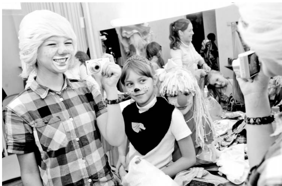
У «серпантинцев» смех и веселье царят не только на сцене, но и в гримерке.

- Сегодня лакированный пол под дерево, зеркала, новое световое и звуковое оборудование помогают сосредоточиться только на творчестве. Репетиции идут