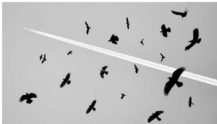
Птицы нередко гибнут в турбинах самолетов и становятся причиной авиационных неполадок.

Честно говоря, тогда я и сам не верил, что пернатые забудут это место. Командир договорился с милицией, чтобы не препятствовала отстрелу птиц в ночное время. Благо, в полярный день ночью светло. Не все охотники поняли важность необычной задачи, но человек десять добровольцев набралось, еще человек пять из соседних коллективов присоединились. Больше половины охотников в лет не попадали и учились этому мастерству у кандидата в мастера спорта по стендовой