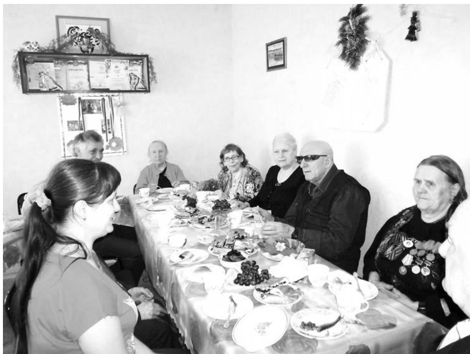
Праздники члены североморского отделения ВОС отмечают в теплом тесном кругу.