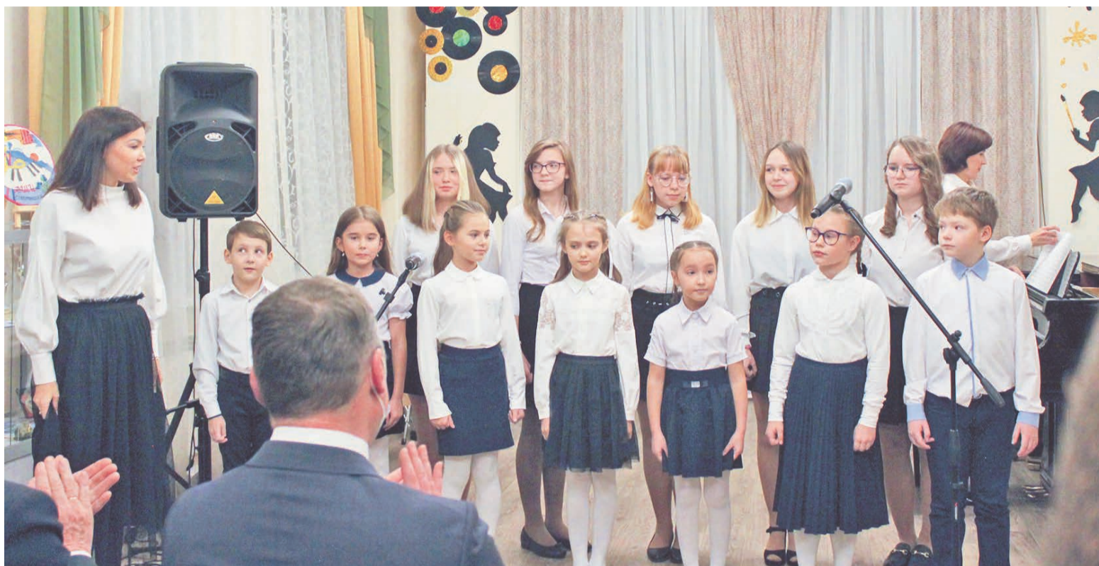
Чем встречают гостей в Детской школе искусств? Конечно, музыкой! Выступает хоровой коллектив «Мечта».