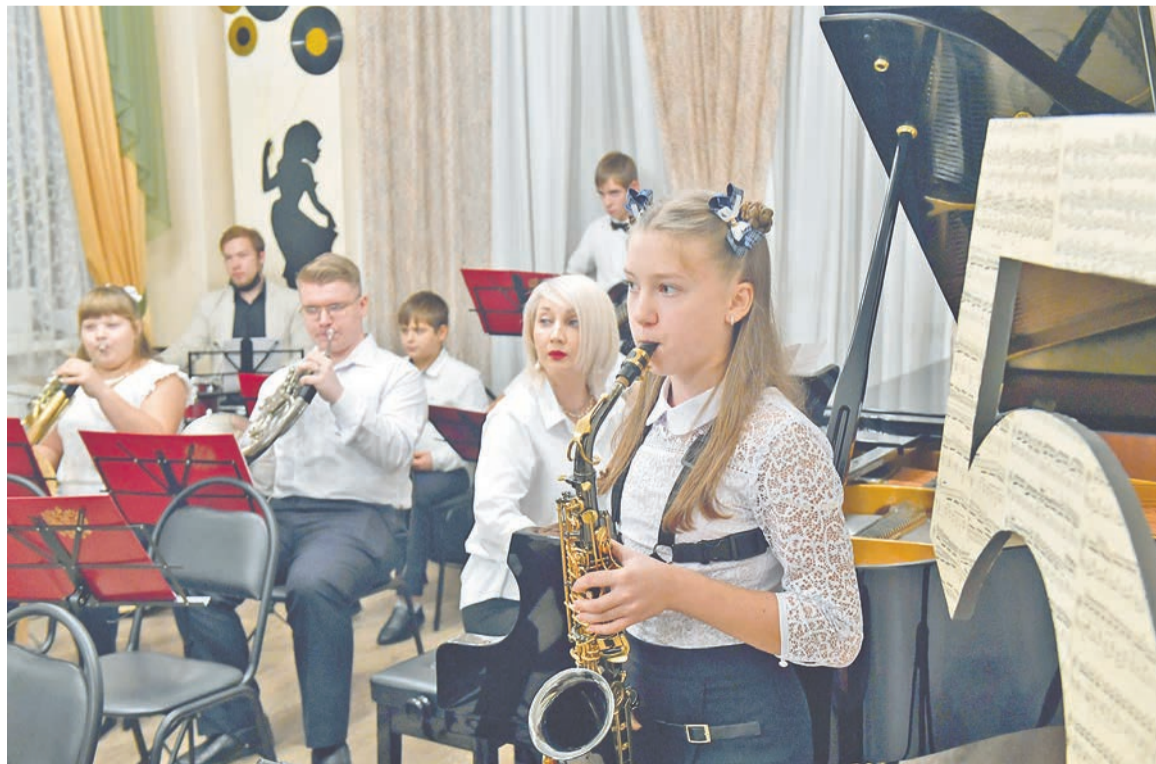
Выступления ансамбля духовых инструментов - одна из визитных карточек ДШИ.