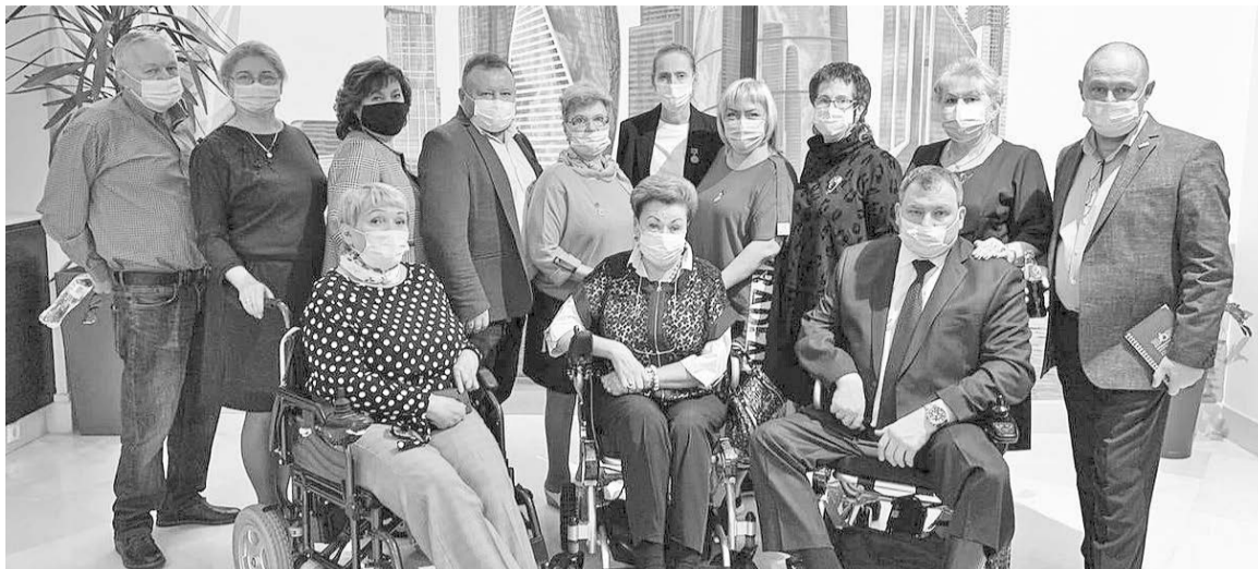
Межрегиональный Совет ВОИ по Северо-Западу.