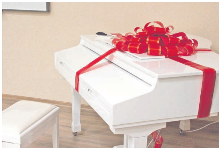
Белоснежный электронный рояль - прекрасный подарок школе от муниципалитета.