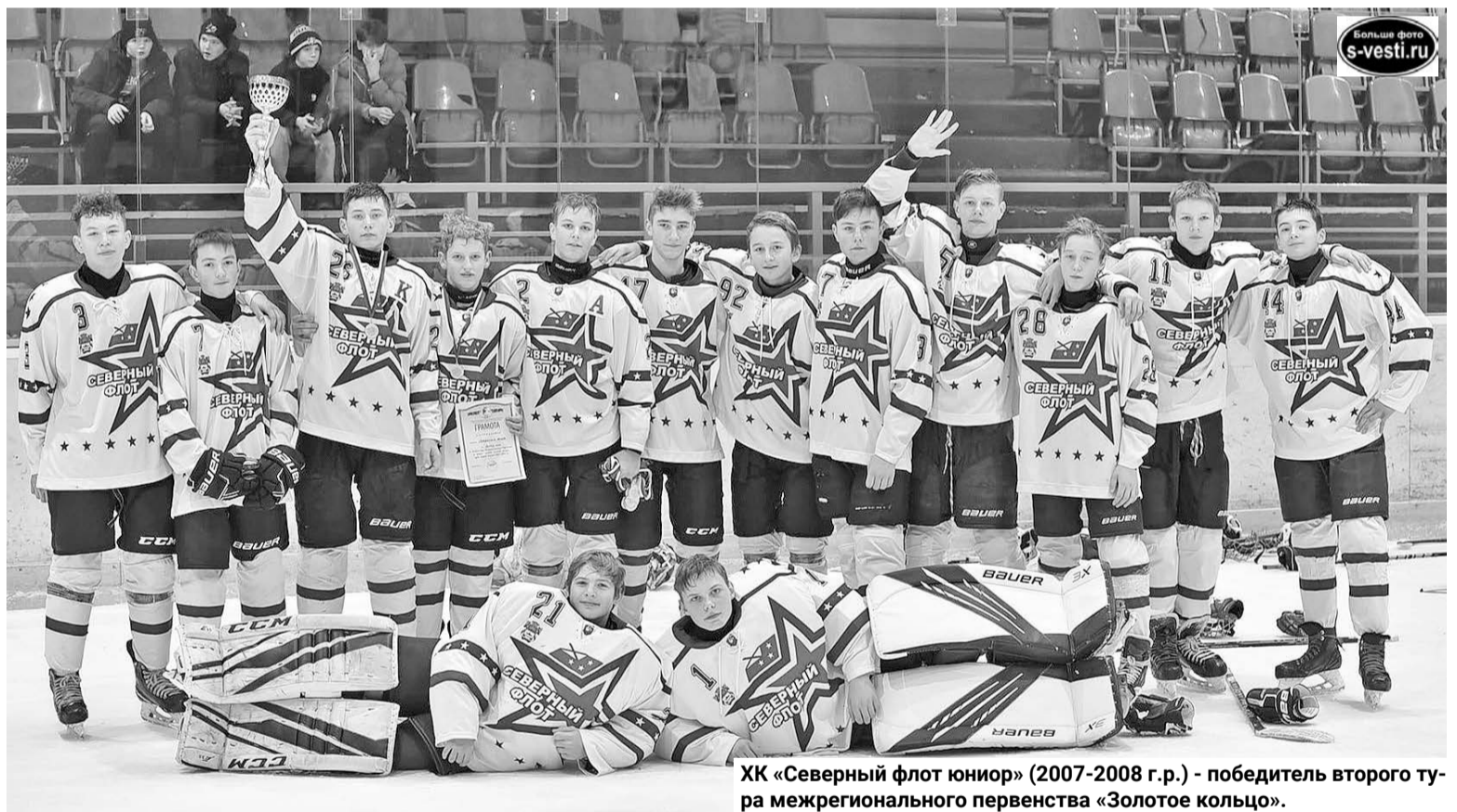
ХК «Северный флот юниор» (2007-2008 г.р.) - победитель второго тура межрегионального первенства «Золотое кольцо».

В расписании третьего игрового дня у команды стояло две встречи. Сначала была битва костромская