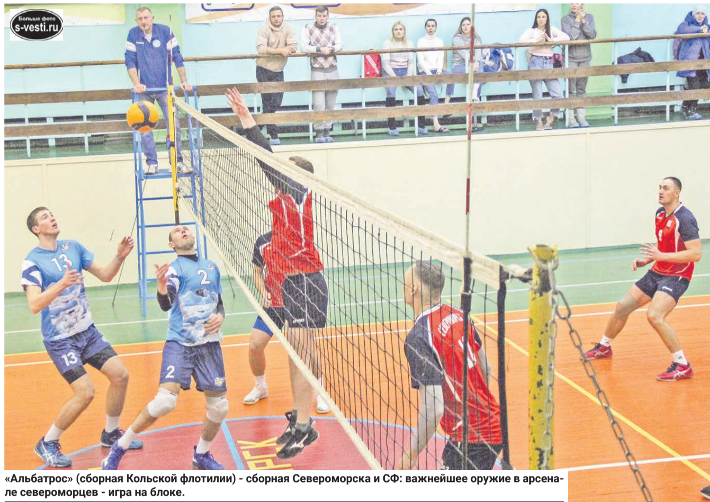
«Альбатрос» (сборная Кольской флотилии) - сборная Североморска и СФ: важнейшее оружие в арсенале североморцев - игра на блоке.

дет 11-12 декабря в Оленегорске в круговом формате.