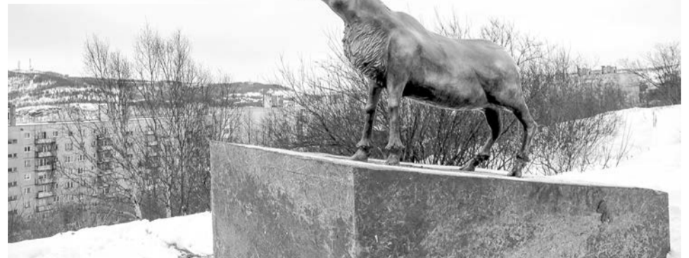
За неполную неделю новый олень облетел соцсети и стал знаменит.

– К сожалению, некоторые воспринимают сквер не как место отдыха, а как место бескультурного времяпре-