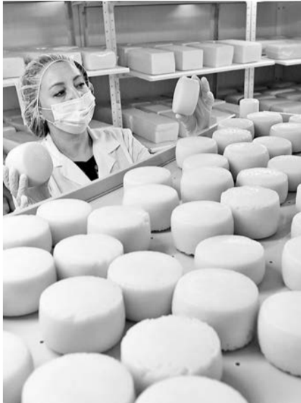
Полутвердый сыр «Качотта» - дипломант федерального этапа «100 лучших товаров России».

На прошлой неделе под девизом «Сделано на Мурмане. Сделано качественно» в областном центре прошла 23-я областная научно-практическая конференция, посвященная Всемирному дню качества.