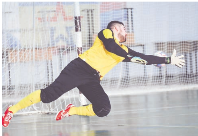
«Север» - «Профсоюз СФ»: голкипер «профсоюзной» команды отражает удар.

В минувшее воскресенье в Северноморском ФСК «Старт» прошло открытие чемпионата воинских частей Северноморского гарнизона СФ и коллективов ЗАТО Североморск по мини-футболу 5X5. (6+)