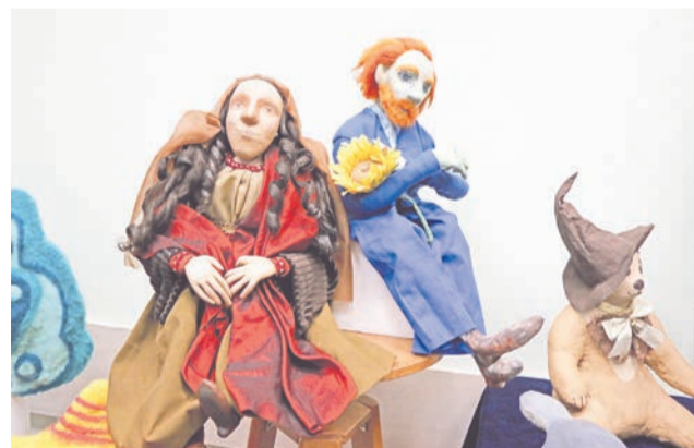
Задумчивая Мона Лиза и печальный Ван Гог.