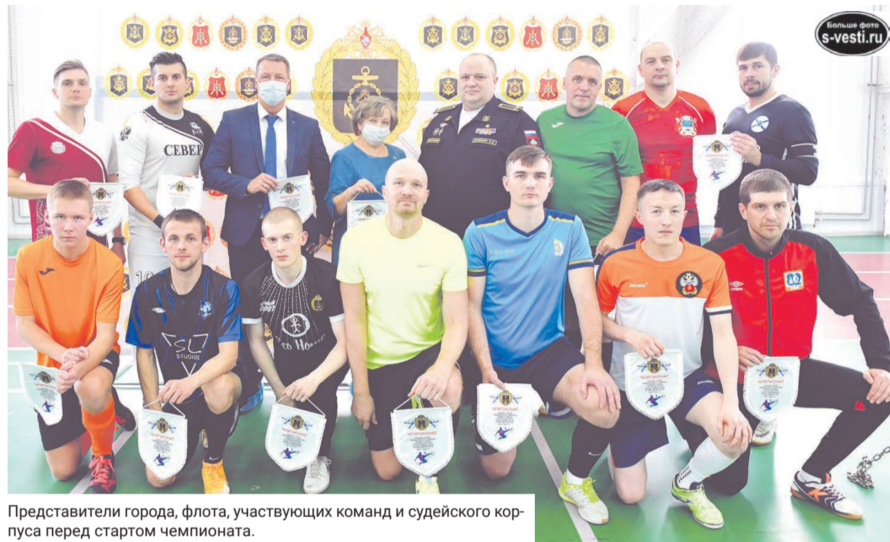
Представители города, флота, участвующих команд и судейского корпуса перед стартом чемпионата.

Регламент следующий. Четырнадцать команд разделены на две группы, по семь в каждой. В группе «А» выступают «Универсал», «Север», «Север Сити», «Атлант», «Гроза», «82 СРЗ» и «Профсоюз СФ». В группе «Б» вошли «Петр Великий», «КЛФ», «Спрут-С», «Адмирал Ушаков», «Фортуна», «Маяк» и «Североморец». Команды