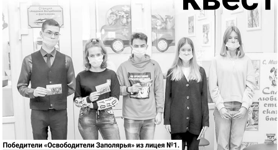
Победители «Освободители Заполярья» из лицея №1.

23 октября в Центральной детской библиотеке им.С.Михалкова прошел городской молодежный историко-краеведческий квест «Подвиг Заполярья», посвященный 77-й годовщине разгрома немецко-фашистских войск в Заполярье.