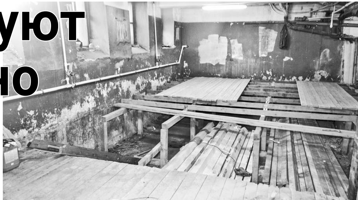
Часть подвала дома №9 по ул.Сафонова планируется оборудовать под кладовые для жильцов.

Кроме того, подвальное помещение дома было в аварийном состоянии. Подрядчики демонтировали аварийный теплообменник, завезли грунт, утрамбовали его, произвели армирование и заливку новых бетонных полов там, где они совсем провалились, в других местах укрепили бетонную стяжку. Аналогичные работы были выполнены во