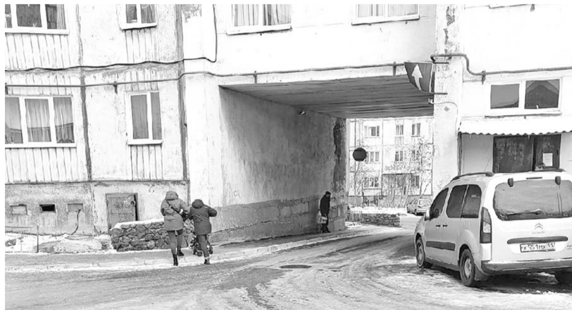
В арке на ул.Северная Застава не хватает ограждения, отделяющего тротуар от дороги, а на подходе к ней пешеходам с колясками и пожилым мешает высокий бордюр.