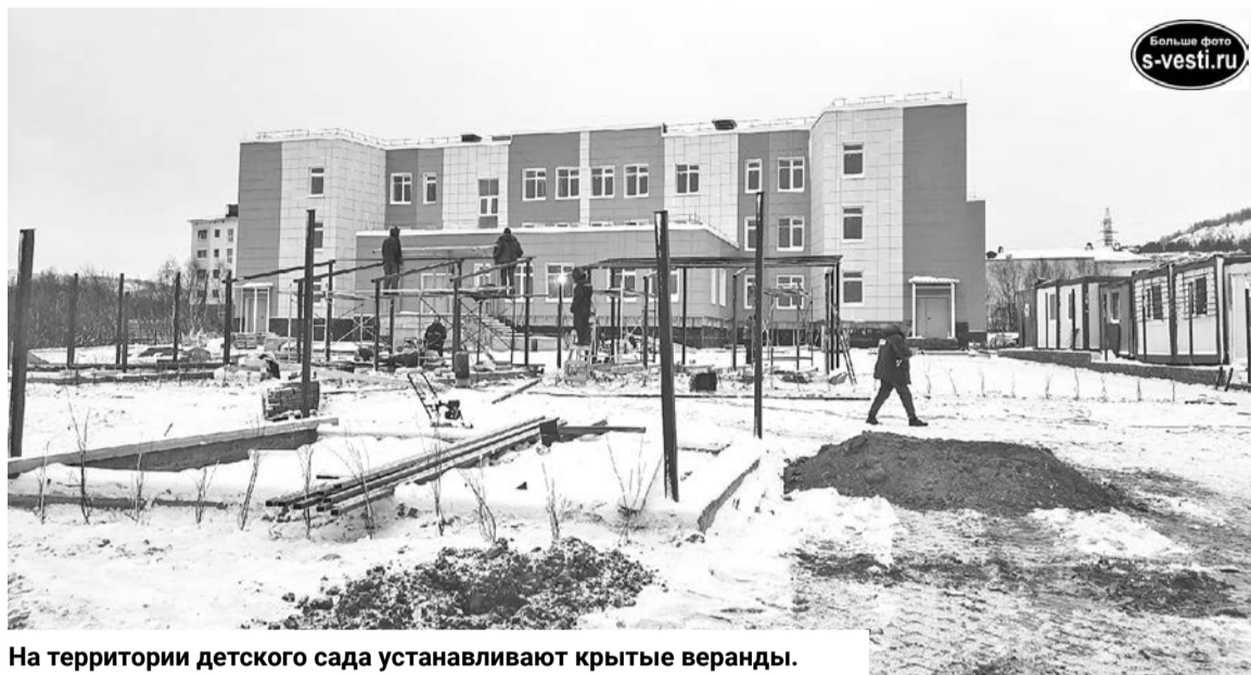
На территории детского сада устанавливают крытые веранды.

- В рамках инспекционной проверки установлена достаточно высокая степень готовности объекта. По основным видам монтажно-строительных работ процент готовности составляет от 75 до 100. Сегодня обратили внимание подрядчика на необходимость