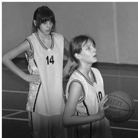
Дыхание в норму - и штрафной в корзине!

Рождественский турнир по баскетболу среди школьников 1994-1995 г.р., проходивший в СК «Богатырь» на этой неделе, выдался интересным, ведь вместе с юношами за медали