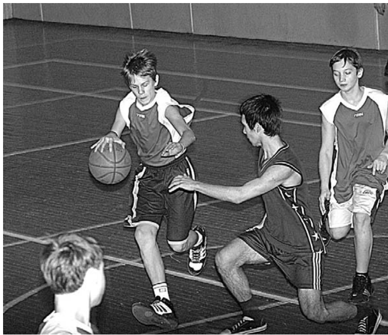
Лучше вовремя передать мяч, чем потерять в нападении.