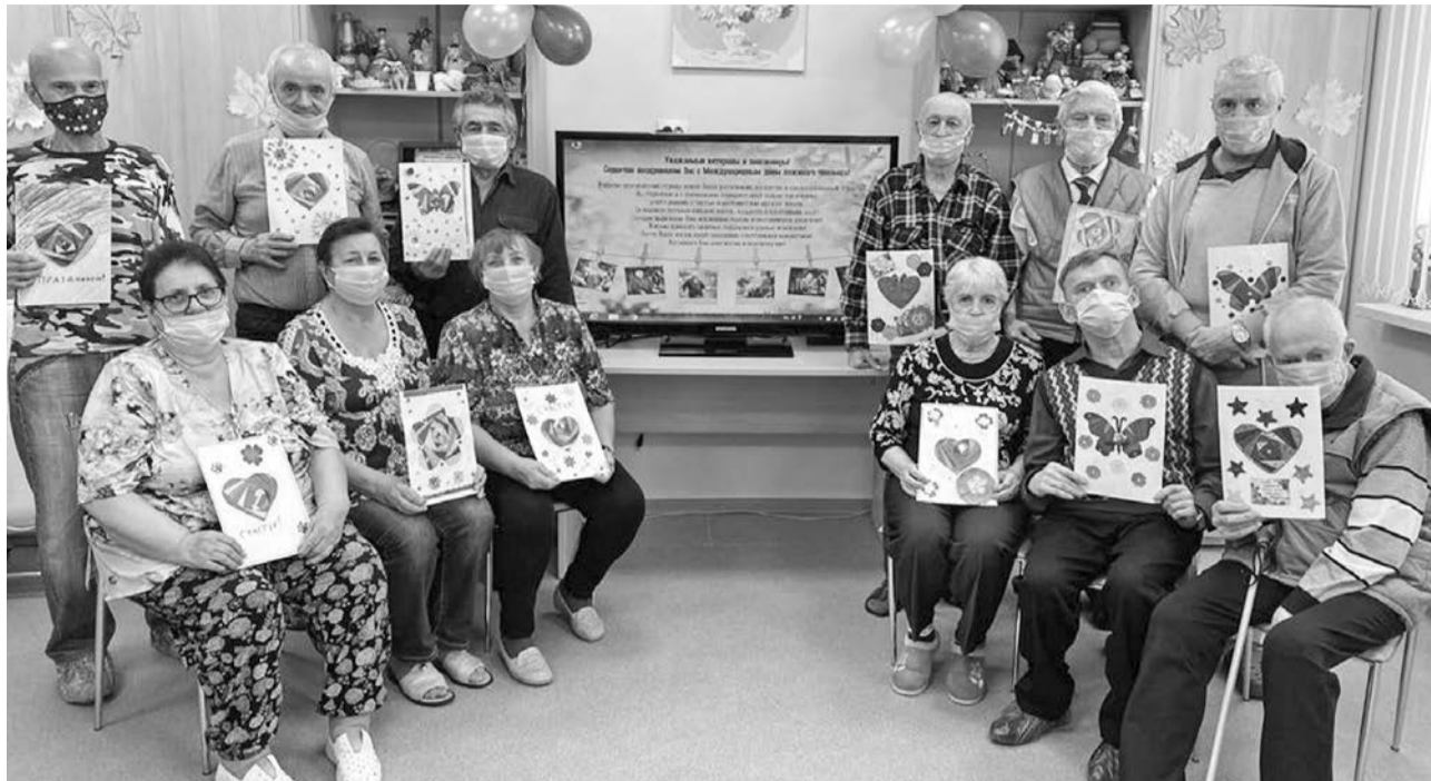
Открытки от «Стези милосердия», сделанные своими руками, - приятный знак внимания для пожилых людей.

Подготовила Наталья СТОЛЯРОВА.