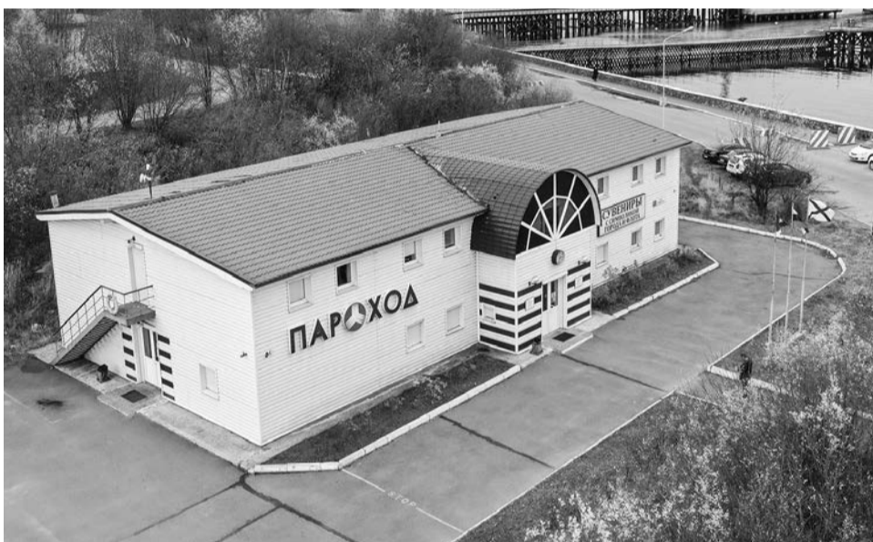
Компания «Пароход» – неоднократный победитель и лауреат конкурсов «Предприниматель года Мурманской области», «Лучшие товары и услуги Мурманской области» и Программы «100 лучших товаров России».