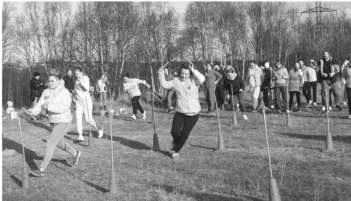
Во время эстафеты «Слалом» участники огибали стойки, имитировавшие ёлочки.