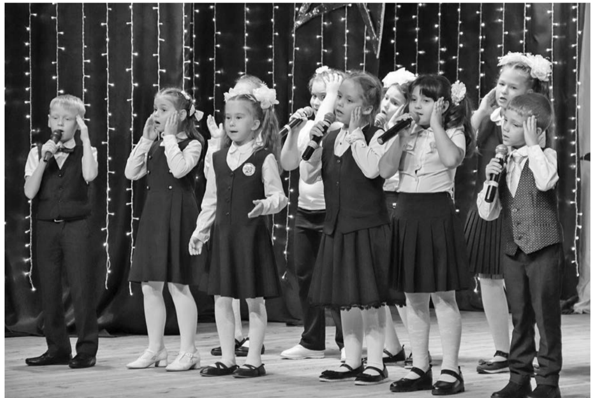
Песней «Первоклашки» североморских педагогов поздравила эстрадная студия «Мечта».