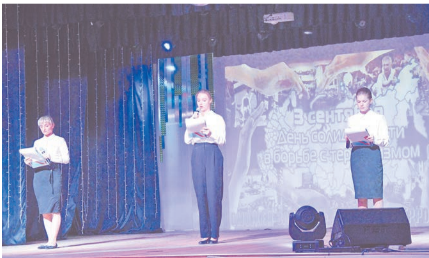
Когда о терактах рассказывают дети, невозможно оставаться безучастным.