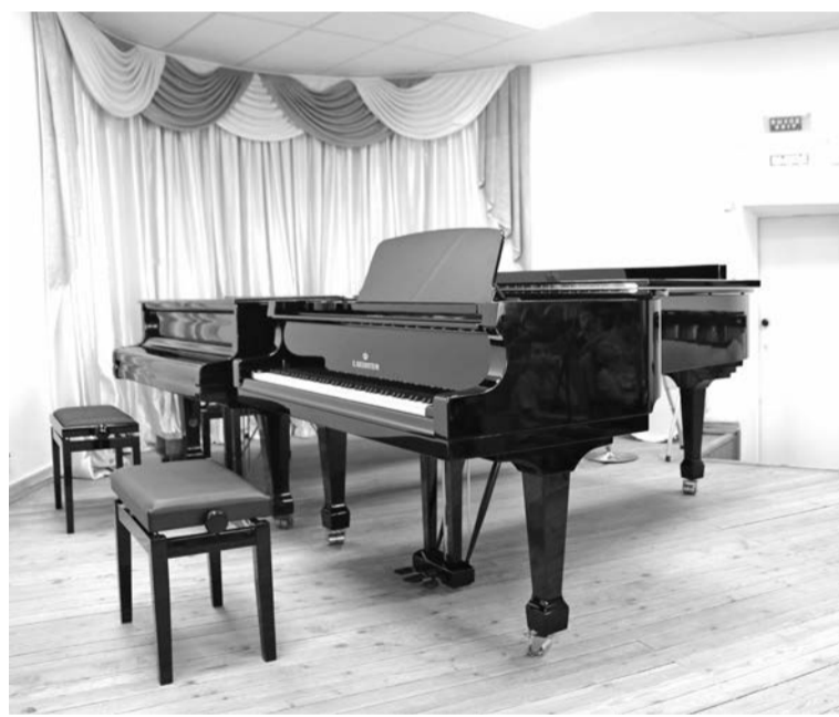
Новый концертный рояль фирмы «С. Bechstein».

На концерте для гостей праздника с новыми инструментами выступили ученики и преподаватели Детской музыкальной школы: стипендиат