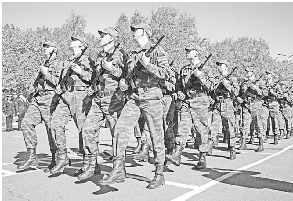
В завершение праздника по плацу торжественным маршем прошли все военнослужащие части.