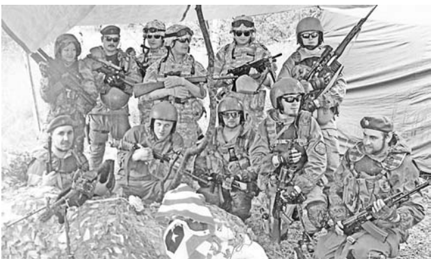
В Североморске к местным стрейкболистам присоединились мурманские.