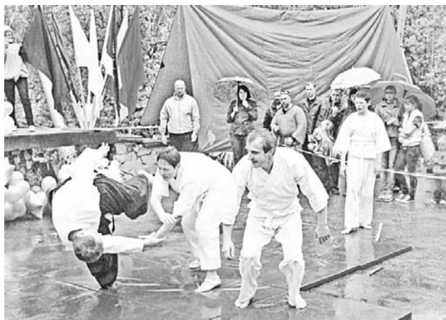
Североморский клуб айкидо демонстрировал приемы самообороны.