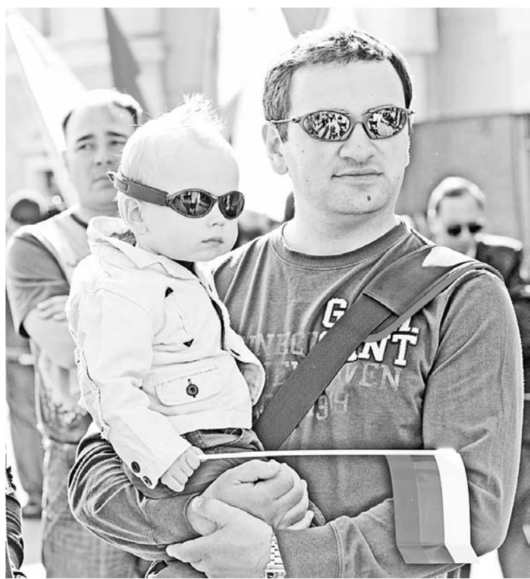
Летом в защите нуждаются глазки и самых маленьких.