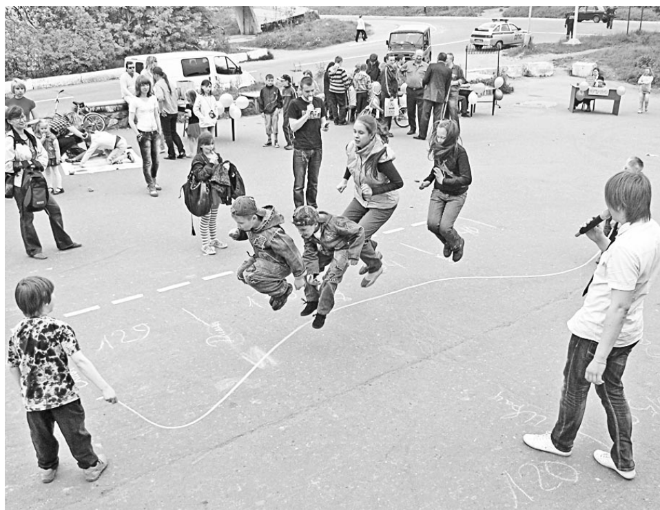
Детвора на празднике в п.Росляково увлеклась эстафетой.