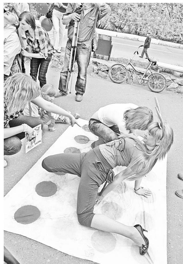
Игра «Камасутра» - сплетенье рук, сплетенье ног...