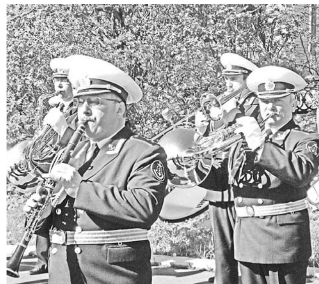
Какой же праздник без оркестра?! 8-й флотский экипаж может похвастаться своими музыкантами.