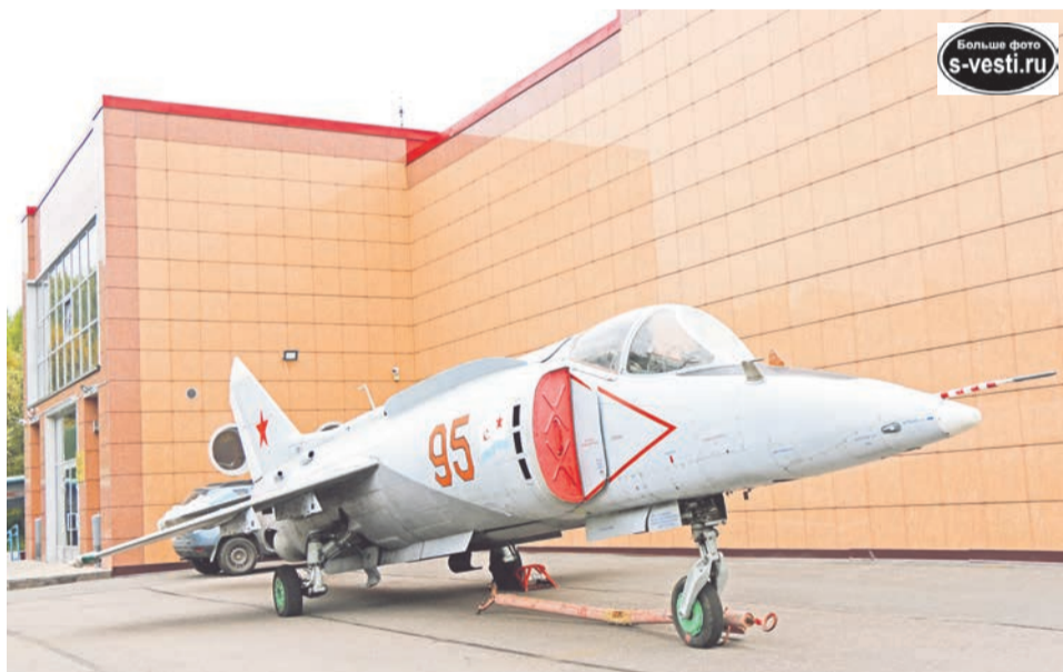
Штурмовик Як-38 у здания Музея ВВС СФ в п.Сафоново.

Анна ВИННИЦКАЯ, Анна ЛИПИНА, Илья ВЛАДИМИРСКИЙ. Фото авторов публикации.