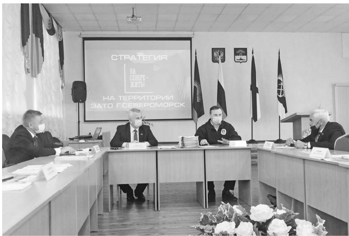
Инициативная группа проработала предложения, поступившие от североморцев, чтобы передать их правительству региона.

- Как и любые строения, детские сады и школы тоже со временем требуют ремонта. Мы строим много нового. Два детских сада, школа, но нужно уделить время капитальному ремонту уже существующего. В следующем году в федеральную программу капитального ремонта войдут школы №12 и №2. Кроме этого, важно понимать, что нам необходимо не только привести в порядок здания, но и создать в учреждениях новые пространства, внедрить новое технологичное оборудование, закупить новую мебель, чтобы дети могли учиться в самых лучших, самых комфортных условиях, и в этом направлении тоже нуж-