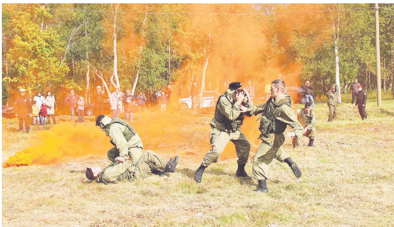
Одними из наиболее ярких динамических показов в парке «Патриот» СФ стали показательные выступления морпехов.