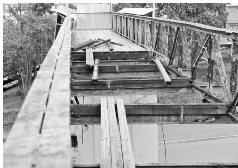
Коррозия металла выявилась при вскрытии настила. Теперь требуется частичная замена несущих конструкций.