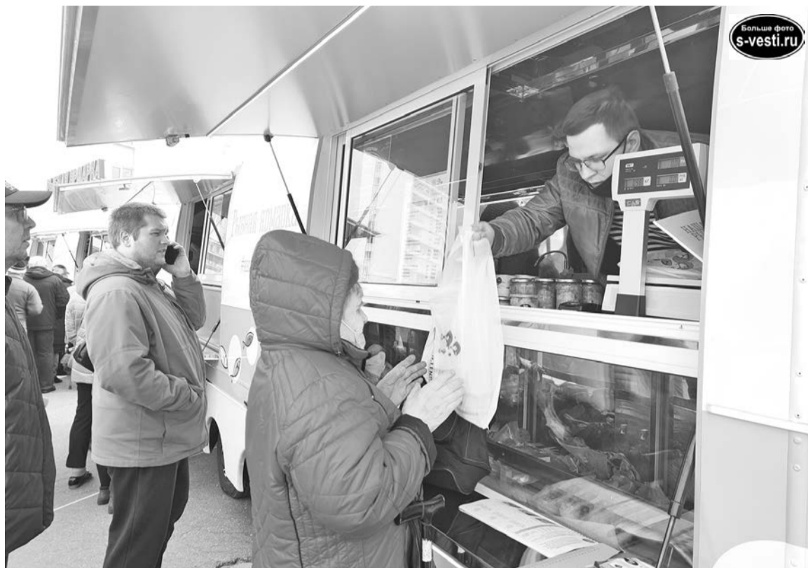
Отдельно стоит отметить работу продавцов, отпускавших товар быстро и с неизменной вежливостью.

- Обычно ездим за рыбой по субботам в Мурманск, но если она сама сюда приехала, почему бы не прийти, тем более, цены ниже средних. Взяли печень трески и