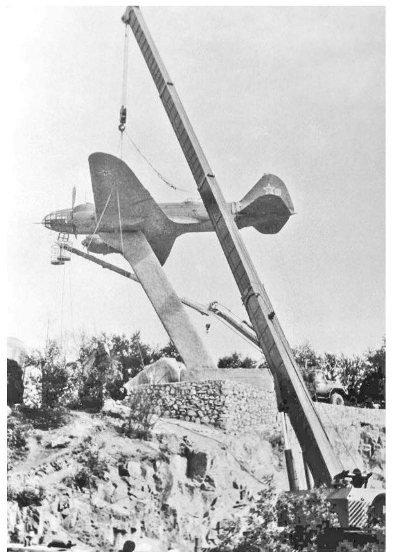
На пьедестал Ил-4 был поднят в 1981 году.

Подготовила Ирина КУЗЬМИНА.