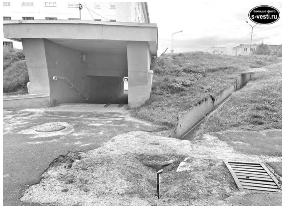
Ремонт подземного перехода на ул.Душенова выполнен некачественно: прошло всего три месяца, а краска уже облупилась и исчез асфальт рядом с ливневкой.

– Зайдем на этот участок и первым делом займемся ливневой канализацией.