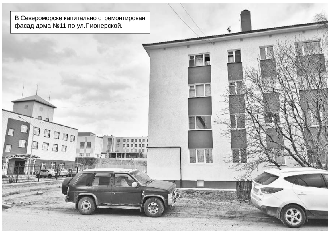
В Североморске капитально отремонтирован фасад дома №11 по ул.Пионерской.

В муниципалитетах Мурманской области продолжается реализация краткосрочного плана региональной программы капитального ремонта многоквартирных домов.