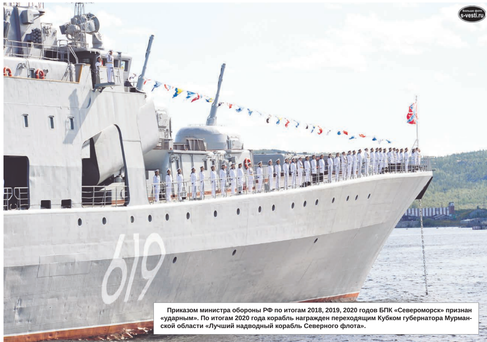
Приказом министра обороны РФ по итогам 2018, 2019, 2020 годов БПК «Североморск» признан «ударным». По итогам 2020 года корабль награжден переходящим Кубком губернатора Мурманской области «Лучший надводный корабль Северного флота».

В 2018 году вновь смена курса – корабль выполнял задачи боевой службы в Средиземном море и Индийском океане. Совершил визиты в порты государств Алжира, Кипра, Сейшельских островов, Мозамбика, Мадагаскара, Джибути, Пакистана, Сири, а также принял участие в межфлотском учении «Океанский щит – 2018». В январе 2019 года – межпоходный ремонт и отдых в Севастополе. И вновь боевая служба в Средиземном море, а после – участие в межфлотском учении «Океанский щит – 2019».