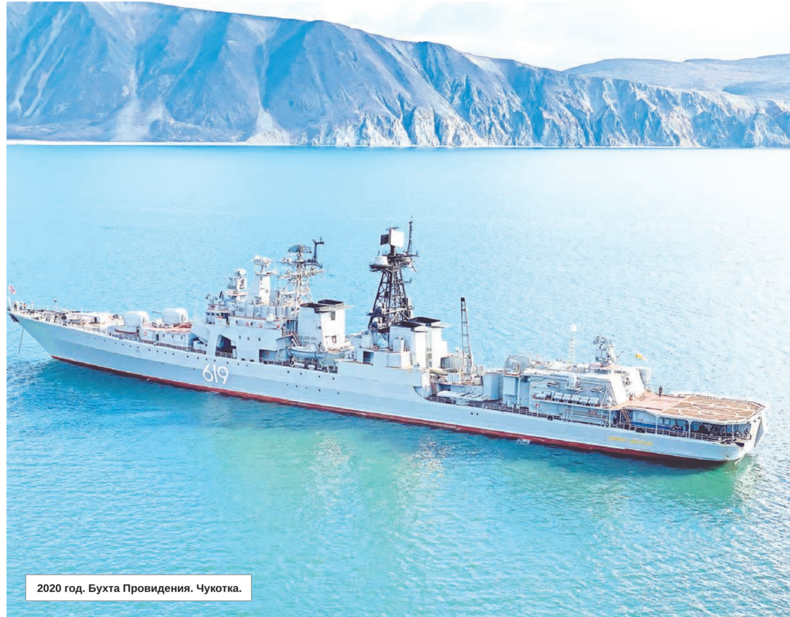
2020 год. Бухта Провидения. Чукотка.

2017 год для БПК «Североморск» охарактеризовался резкой сменой курса: Средиземноморье сменилось арктическими морями. 10 августа 2017 года корабль вышел из Североморска в составе отряда кораблей и судов обеспечения СФ и взял курс на восточные районы Арктики. 15 августа прибыл в самый северный порт континентальной части России – Диксон. В дальнейшем БПК «Североморск» впервые в истории флота поднялся вверх по течению великой сибирской реки Енисей и зашел в Таймырский порт Дудинка. За время стоянки в порту на его борту были организованы выставки современного вооружения и обмундирования в рамках военно-технического форума «Армия-2017», а также приняты в юнармейцы 120 школьников Таймыра. В сентябре БПК вышел из Енисейского залива в Карское море и, подойдя к Новосибирским островам, занял места якорных стоянок в заливе Стахановцев Арктики. Здесь БПК «Североморск» и БДК «Кондопога» обеспечили высадку морского десанта на необорудованное побережье острова Котельного. 4 октября 2017 года после успешного выполнения задач похода по морям Северного Ледовитого океана отряд кораблей во главе с БПК «Североморск» прибыл в порт приписки.