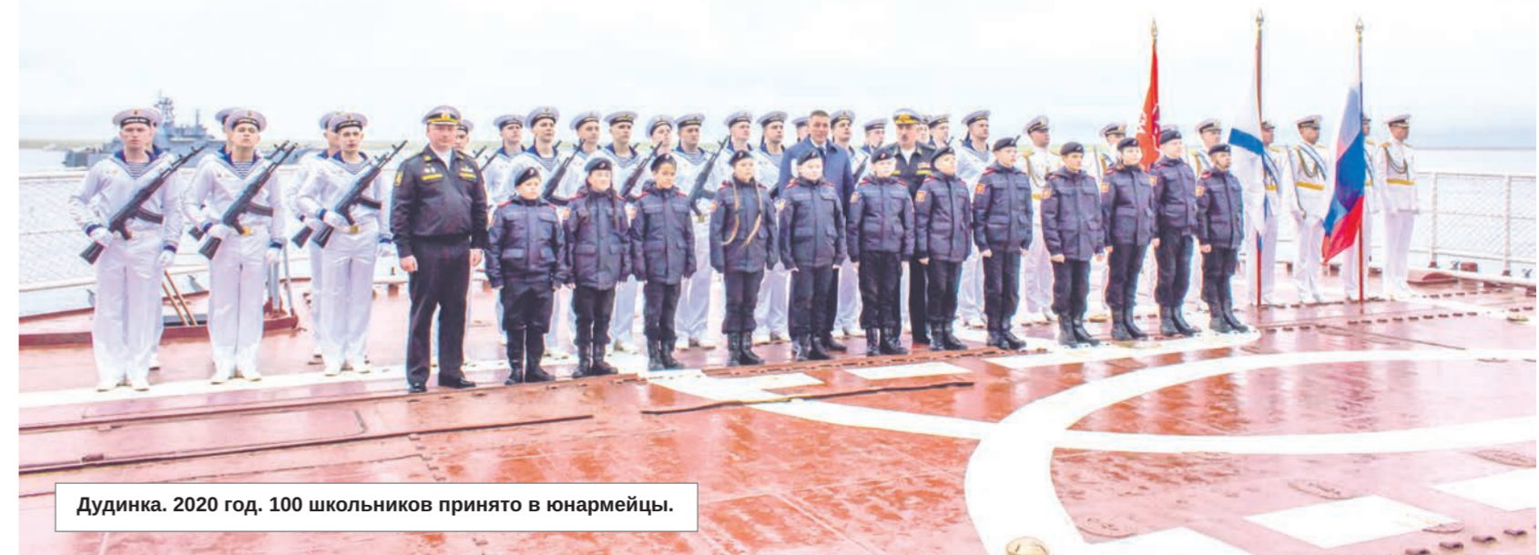
Дудинка. 2020 год. 100 школьников приняты в юнармейцы.

Наталья СТОЛЯРОВА.