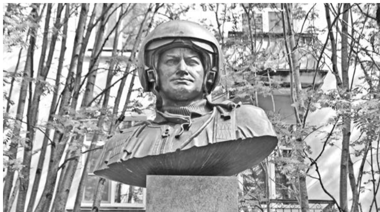
Бюст Тимура Апакидзе был открыт 27 июля 2003 года.

17 июля в России отмечается День авиации Военно-морского флота. Праздник был учрежден в соответствии с Приказом главнокомандующего ВМФ РФ №253 от 15 июля 1996 года «О введении годовых праздников и профессиональных дней по специальности», а дата выбрана в память о первой победе русских морских летчиков в воздушном бою над Балтийским морем, произошедшей 17 июля (4 июля по старому стилю) 1916 года.