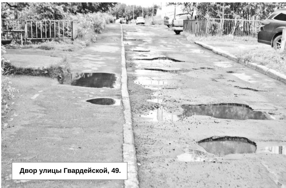
Двор улицы Гвардейской, 49.