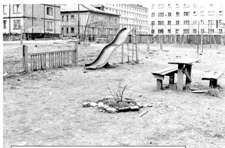
Во дворе на ул. Пионерской, 28, в 90-е годы... и сейчас.