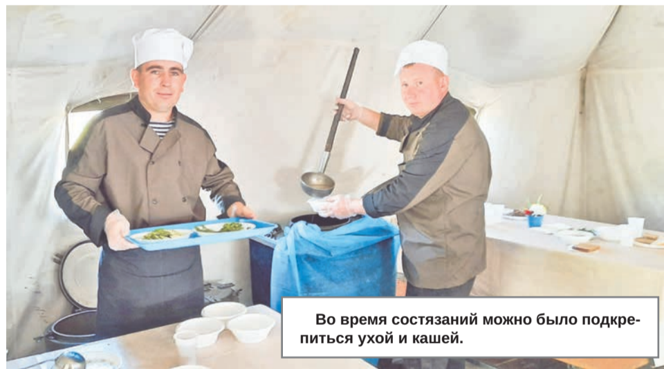
Во время состязаний можно было подкрепиться ухой и кашей.