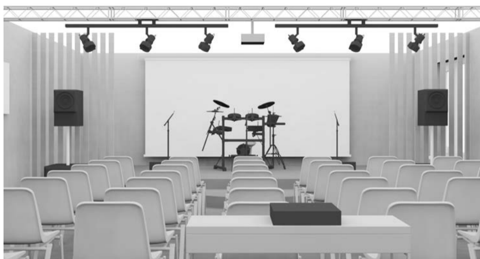
Вот так должны выглядеть помещения молодежного пространства на ул. Морской, 10, по задумке сектора молодежи.

на репетиции и семинары. И все это на 159 м 2 .