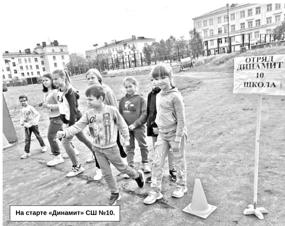
На старте «Динамит» СШ №10.