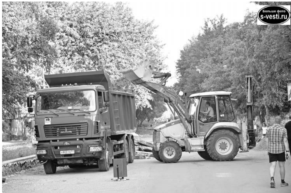
На ул.Сафонова шумно - работает техника. Эти неудобства можно потерпеть ради преобразования центральной улицы города.

Параллельно идет обновление старой бутовой кладки, поверх которой установят деревянный настил. Также рабочие