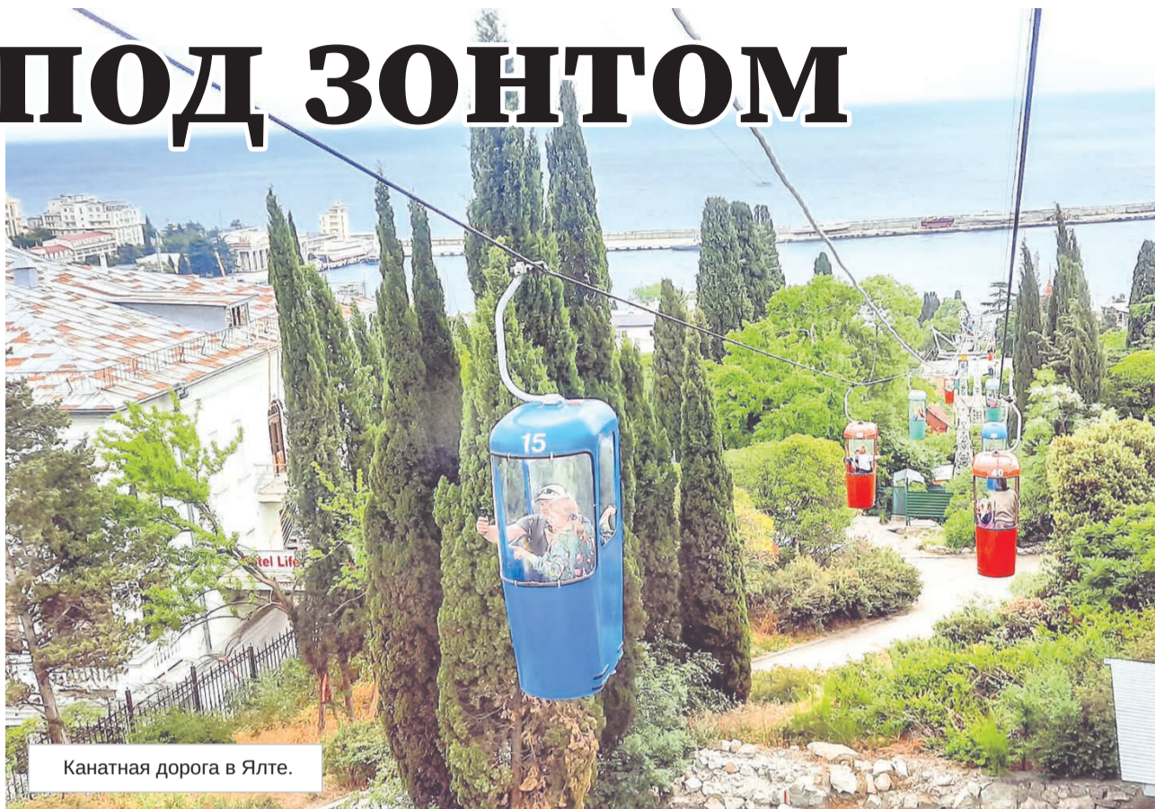
Канатная дорога в Ялте.

Когда 18 июня прошел нашествивший на всю страну ливень, город погрузился в хаос: встал транспорт, начались перебои с водой, вырубалось электричество, «умер» телевизор, Wi-Fi и до этого на лад дышал. Синоптики зая-