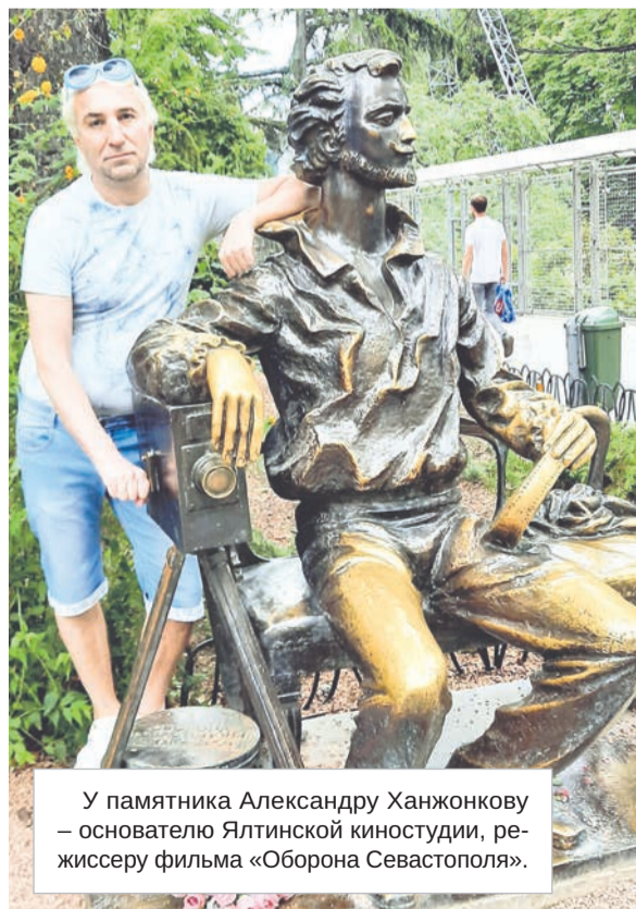
У памятника Александру Ханжонкову - основателю Ялтинской киностудии, режиссеру фильма «Оборона Севастополя».