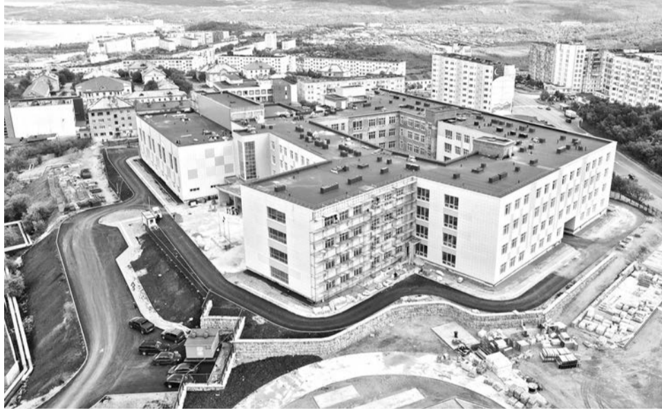
С высоты птичьего полета масштабы новой школы особенно впечатляют.

Эпидемиологическая обстановка в регионе остается напряженной. В одном только ЗАТО Североморск число заболевших COVID-19 увеличивается на 20 и более человек в сутки.