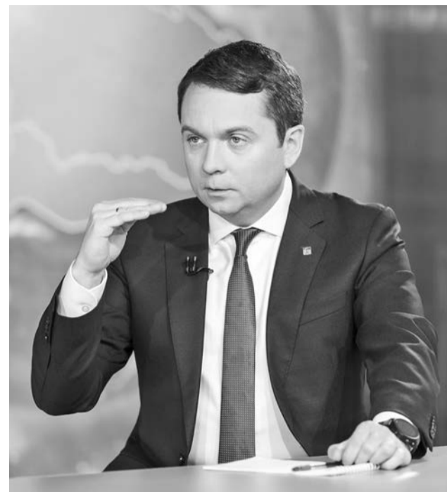
Глава региона Андрей Чибис.