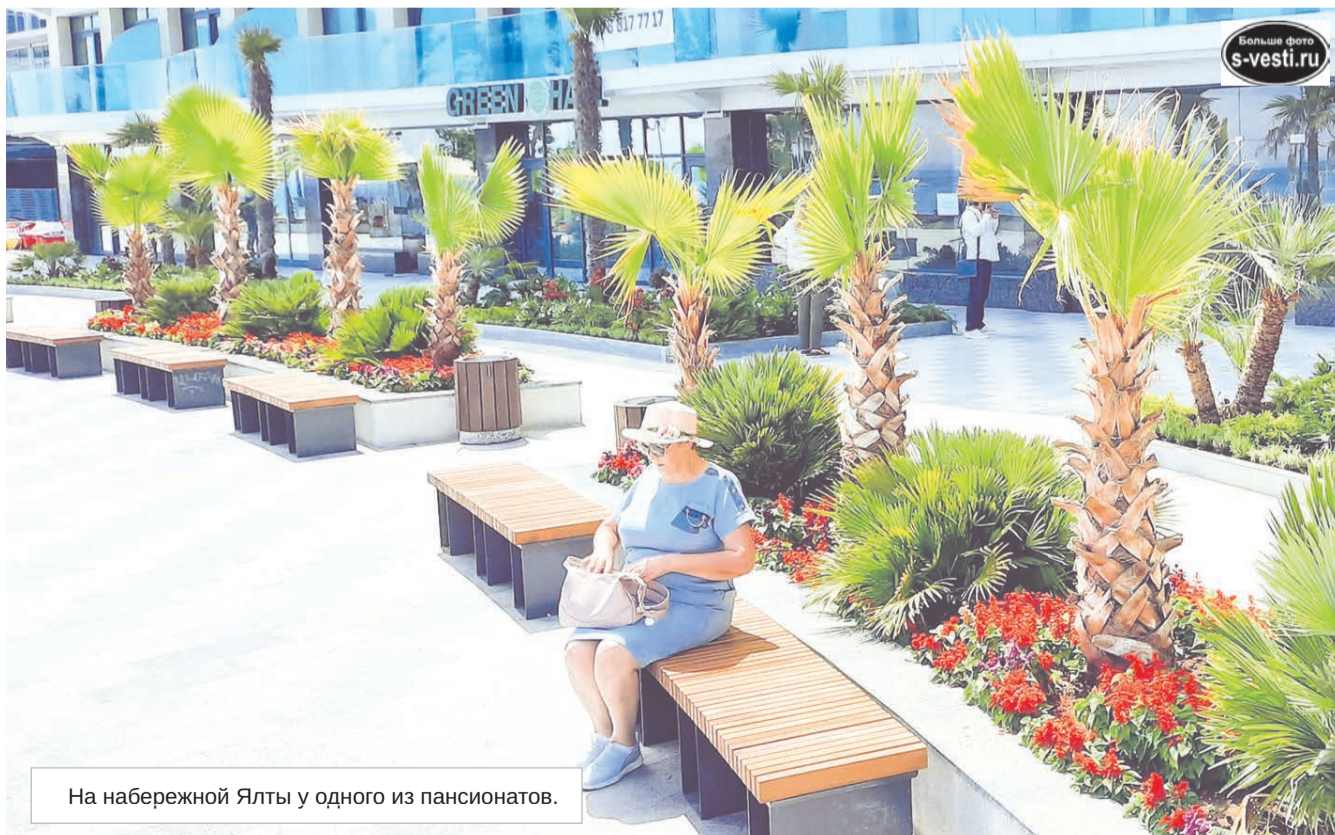
На набережной Ялты у одного из пансионатов.