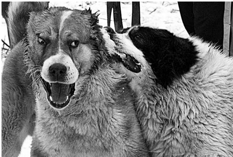
Хозяева доверяют собакам, забывая, что они - хищники.