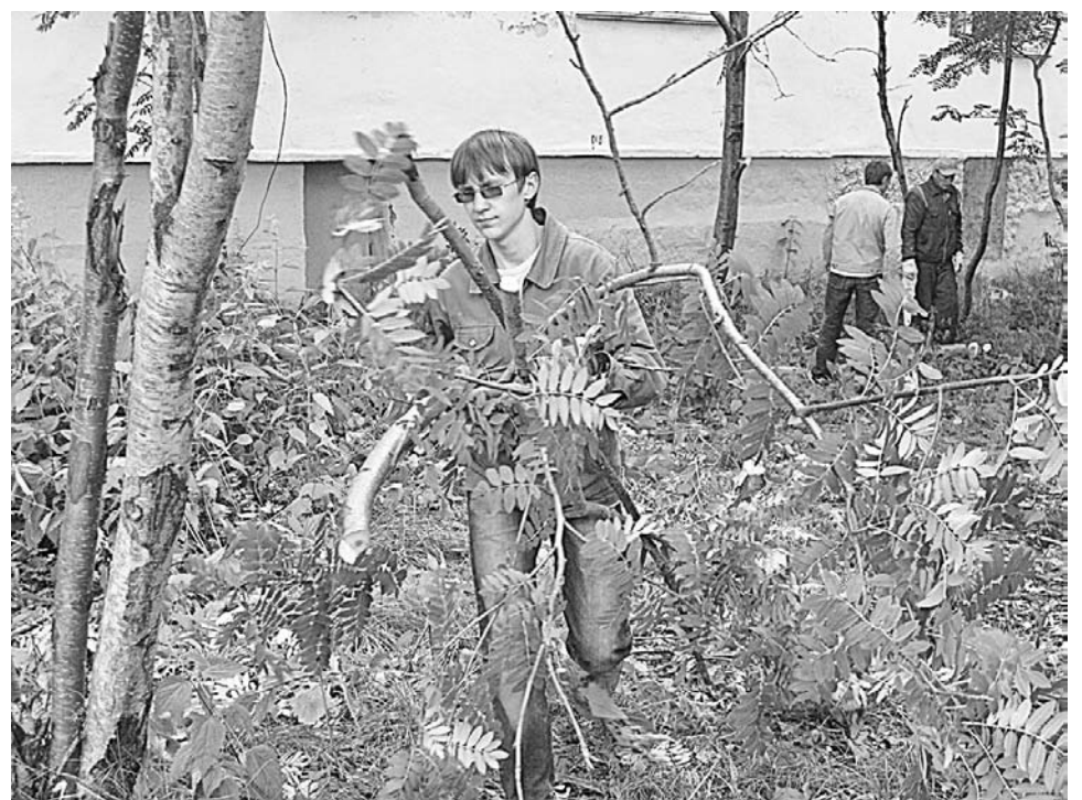
Лес рубят - щепки учтены.