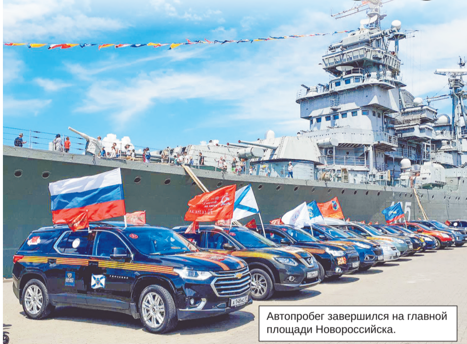
Автопробег завершился на главной площади Новороссийска.

В День России в Новороссийске финишировал автопробег «Никто не забыт, ничто не забыто», организованный Профсоюзом гражданского персонала Вооруженных сил России.