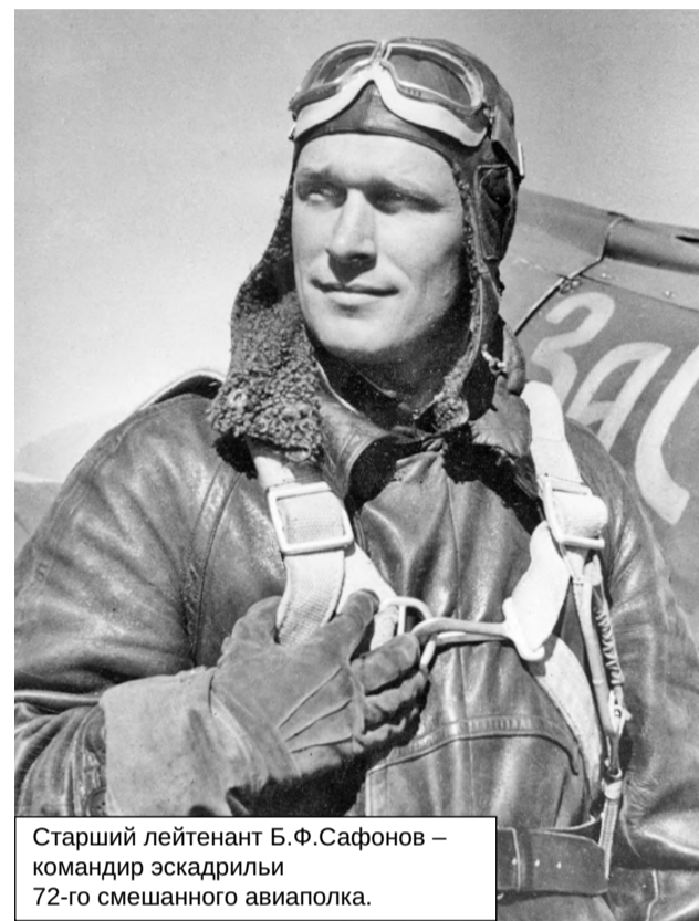
Старший лейтенант Б.Ф.Сафонов – командир эскадрильи 72-го смешанного авиаполка.

В первые дни войны подводники СФ действовали очень осторожно и недостаточно умело. Иногда подводные лодки, находясь на боевой позиции в море, не соблюдали режима использования перископов, что приводило к позднему об-