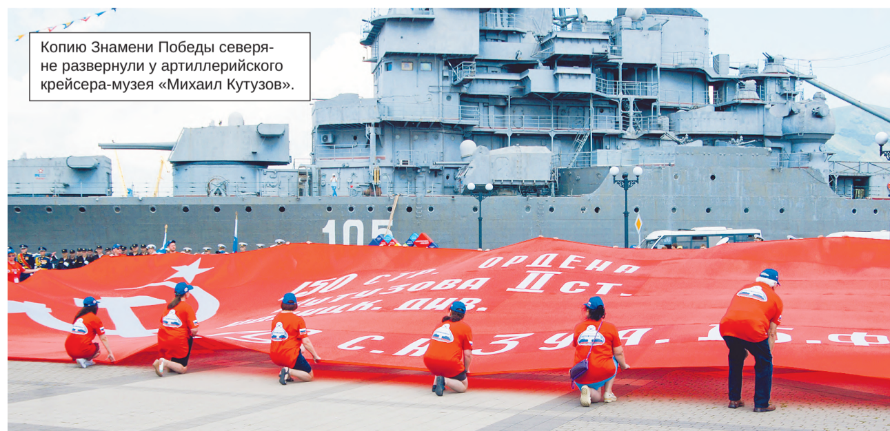
Копию Знамени Победы северяне развернули у артиллерийского крейсера-музея «Михаил Кутузов».