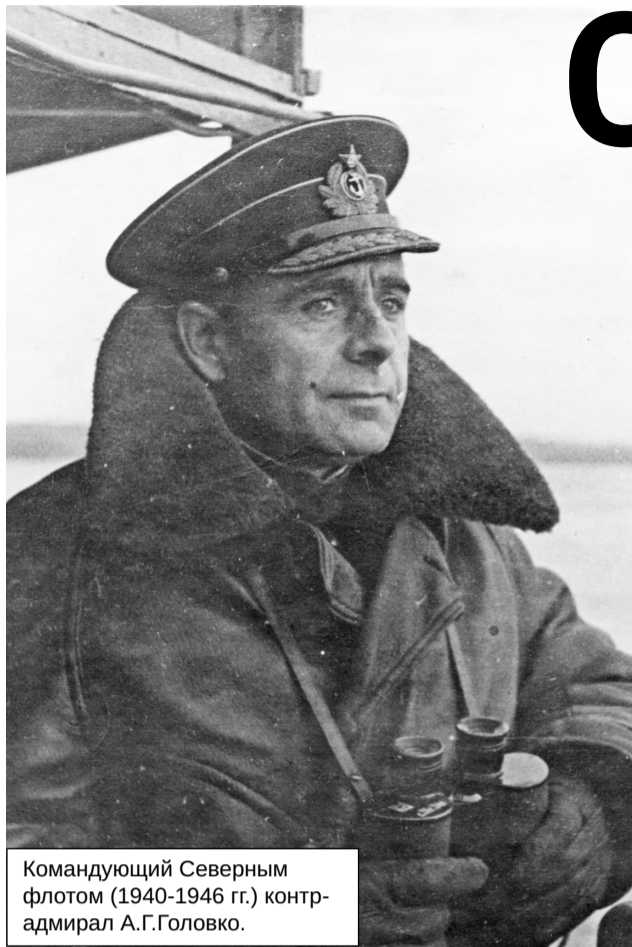
Командующий Северным флотом (1940-1946 гг.) контр-адмирал А.Г.Головко.

Напряженность возле границ СССР к июню 1941 года достигла своего максимума, точечные разведывательные, провокационные полеты над нашей территорией переросли ранним утром 22 июня в открытые военные действия.