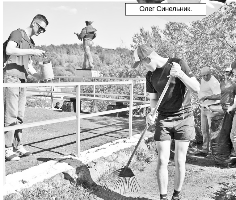
Военнослужащие убрали территорию вокруг «Пушки Космачева» и обновили покрытие ограждения и парапета.