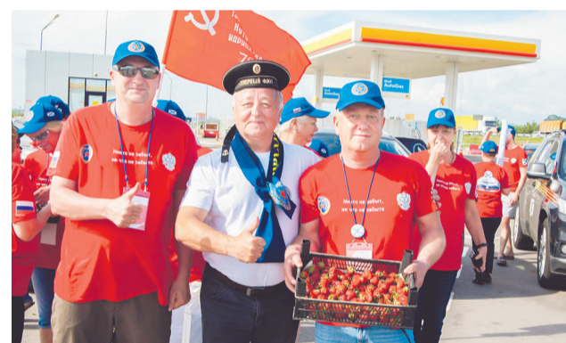
На подъезде к Ростову-на-Дону состоялась встреча с руководством Профсоюза ВС России Южного военного округа.