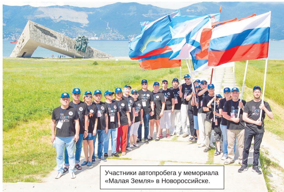
Участники автопробега у мемориала «Малая Земля» в Новороссийске.