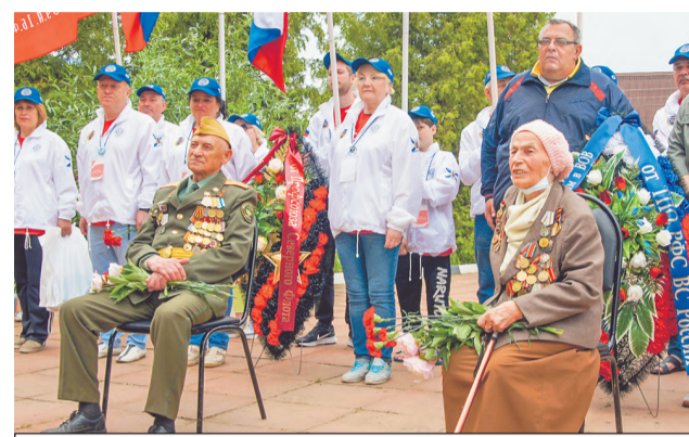
Под Подольском участники пробега встретились с ветеранами.

Ирина КУЗЬМИНА.