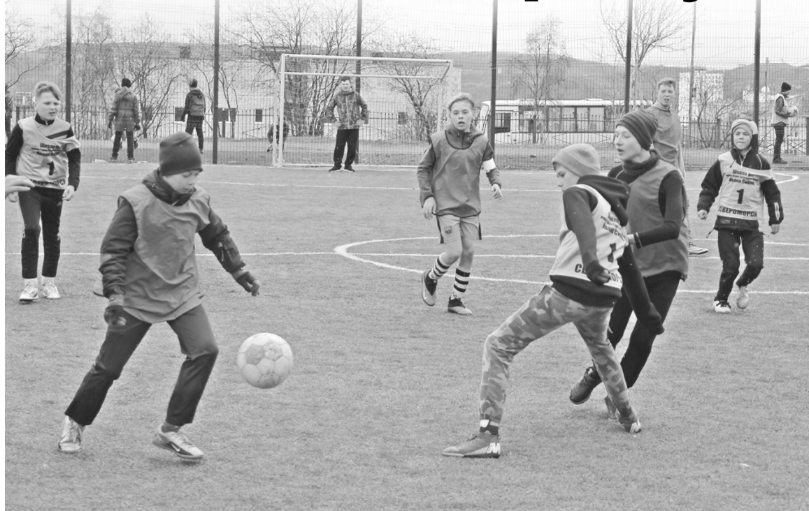
Во время турнира шел небольшой снег. Но кого это может напугать?!