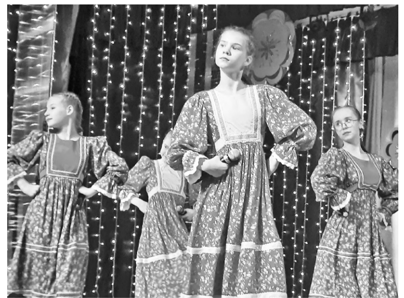
1 июня в Доме детского творчества прошла театрализованная игровая программа для ребят, посещающих пришкольные лагеря.

– Все смены детьми уже укомплектованы. Однако есть вакантные места для сопровождающих с 24 июня по 14 июля и с 16 июля по 4 августа. Им оплачивается дорога туда и обратно, а также услуги по сопровождению детей в размере 930 рублей в сутки. Обязательное требование – наличие дипло-