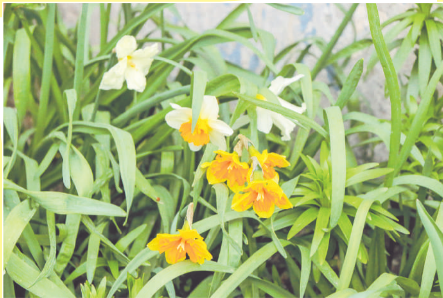
Фото Ирины КУЗЬМИНОЙ и Елены ЗАХАРОВОЙ. Больше фото на s-vesti.ru .

Что делать, если весна не торопится радовать цветущей зеленью? Можно жаловаться на капризы погоды, а можно организовать собственную весну в отдельном дворе, как это сделали, например, жители ул. Сафонова, 2, и ул. Адм. Сизова, 6-8. Здесь уже вовсю цветут крокусы, тюльпаны, нарциссы, маргаритки. Позже распустятся петунии, лилии, бархатцы, анютины глазки. И множество других цветов, названия которых знают лишь истинные цветоводы.