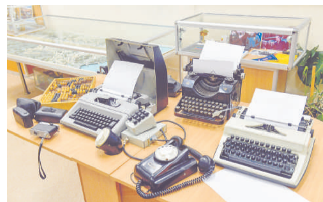
Печатные машинки были не менее популярны, чем дисковые телефоны.

– Это нормальная практика, давать вторую жизнь тому, что идет на выброс. Многие художники только этим и занимаются. У меня есть целая выставка работ, сделанных с применением гляцевых журналов. Главное, понять принцип создания коллажа: не фигуры вырезать, а