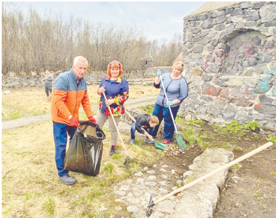
Депутатский корпус воспользовался погожим днем и навел порядок в каменном городке в минувшую среду.

21 мая в 16.00 в ЗАТО Североморск пройдет субботник.