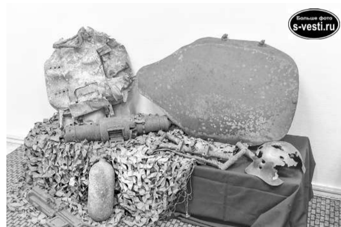
Эдуард Миронов провел экскурсию, во время которой рассказал о каждом экспонате.