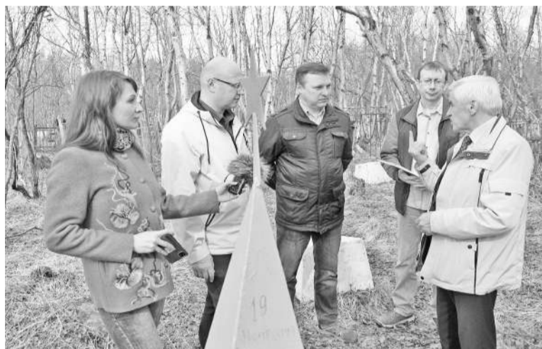
Участники рейда обсудили возможность нанесения на надгробия QR-кодов, благодаря которым можно будет узнать полную информацию о летчиках.

Кроме того, поисковики и волонтеры своими силами обещают благоустроить старый погост.