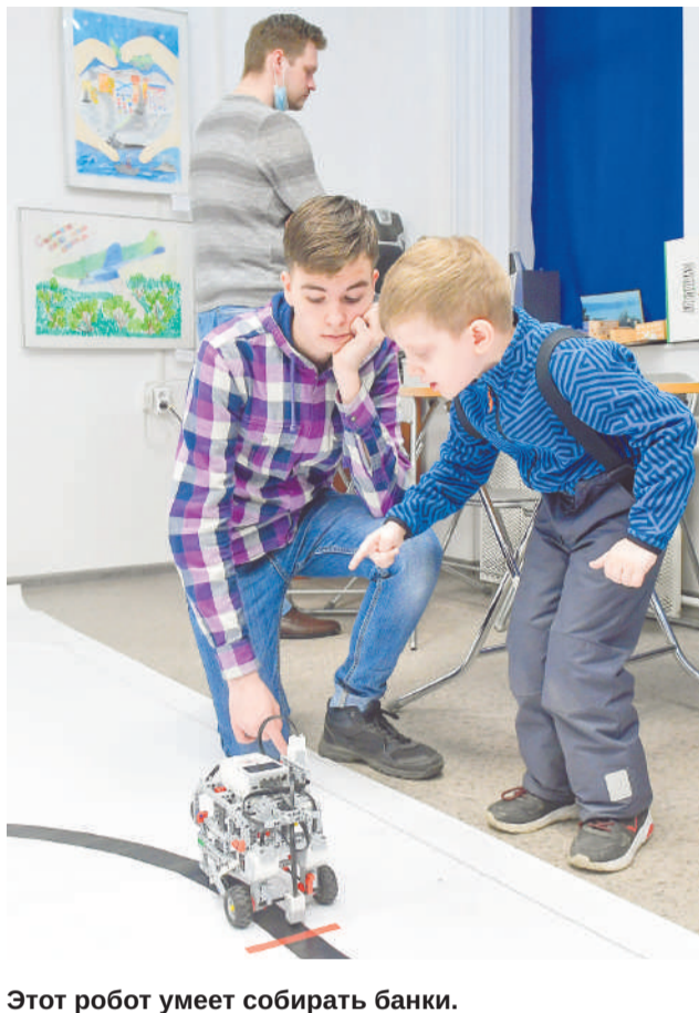
Этот робот умеет собирать банки.

А вы когда-нибудь проводили ночь в музее? Или хотя бы вечер? Если нет, то вам просто необходимо было прийти в прошлую субботу в «Музейно-выставочный комплекс». Уверяем, там было что посмотреть и в чем поучаствовать.