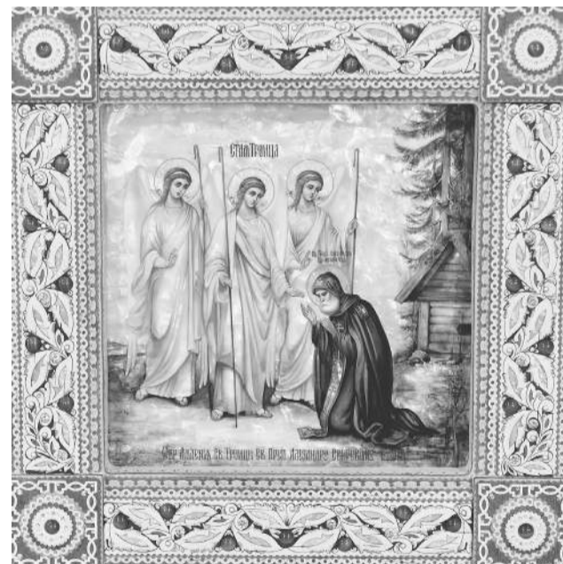
Образ явления Святой Троицы преподобному Александру Свирскому.