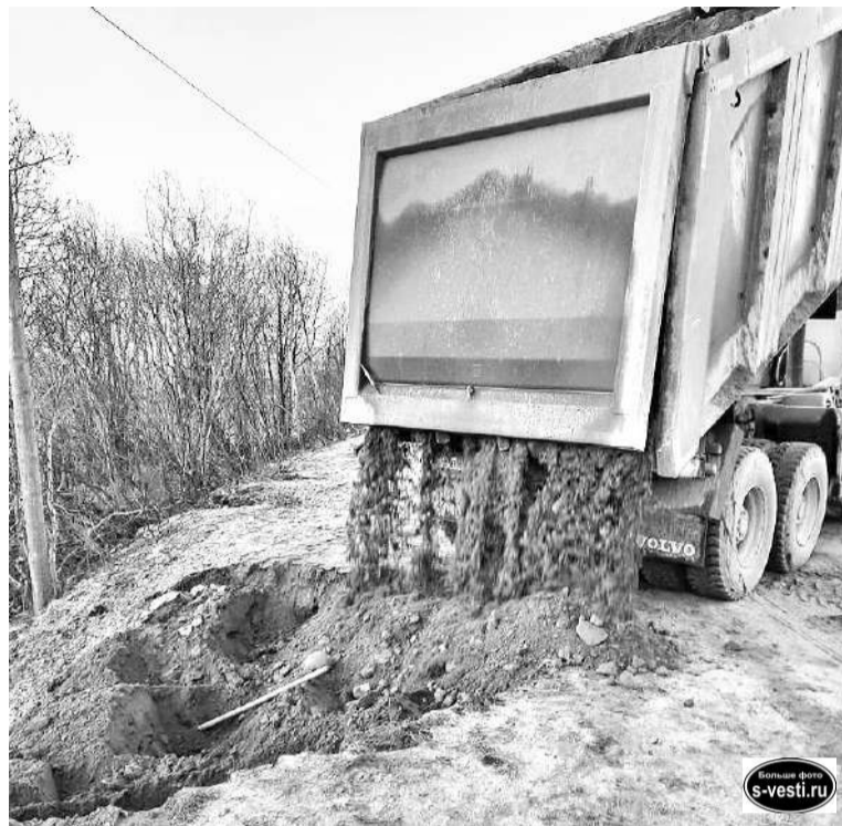
Благодаря оперативной работе ООО «СеверАвто» удалось избежать перекрытия дороги на Северноморск-3.

Чтобы привести квартиры в хорошее состояние, требовалось вложить большие средства, которые удалось изыскать благодаря программе реновации ЗАТО. Подрядчик, а это новая для города организация, все сделал вовремя, прислушиваясь к рекомендациям заказчика. Кстати, на втором