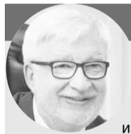
Виктор САЙГИН, депутат Мурманской областной Думы:

Различные виды выплат получают почти 65 тысяч заполярных семей. В 2021 году на эти цели в областном бюджете предусмотрено свыше 6,5 млрд рублей.