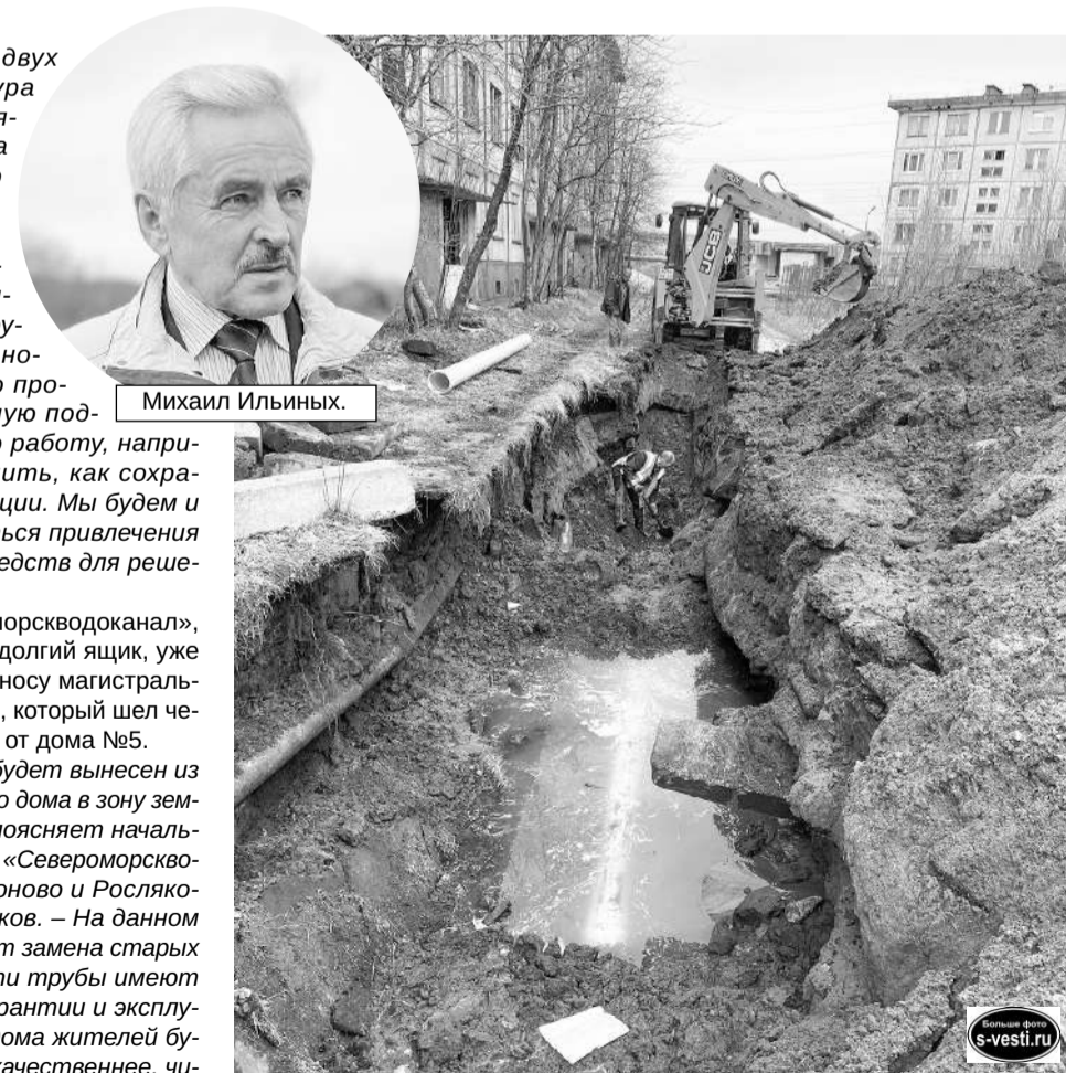
МУП «Североморскводоканал» работает с опережением: дома еще стоят, а сети к их сносу уже готовы».