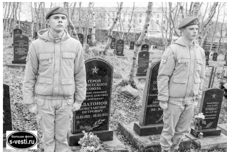
Вахта у могилы Героя Советского Союза Константина Платонова.