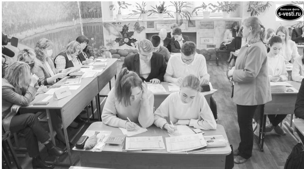
Обучающая игра «Домовой» вызвала неподдельный интерес не только у школьников, но и у членов жюри: и те, и другие усердно решали задания.

– Мы живем в новом времени. Школьники, к примеру, должны понимать, как можно управлять своей квартирой, домом. Как депутат знаю, что 85% обращений граждан