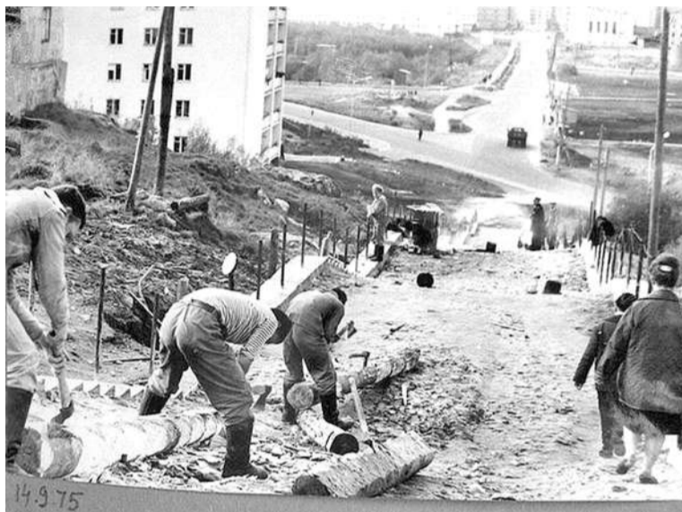
На более пологий склон между ул. Корабельной и Сивко в 1975 году был уложен трап на бетонном фундаменте.