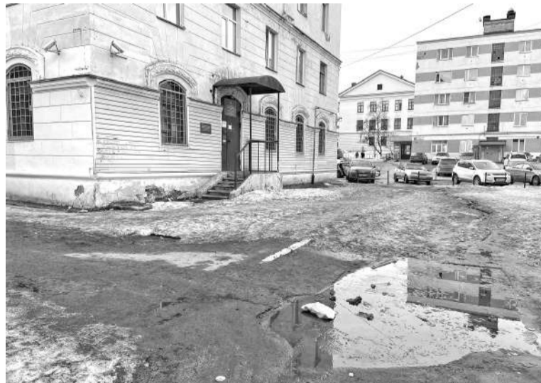
Яма на ул.Сафонова немолода. После проведенных земляных работ асфальтовое покрытие здесь так и не восстановили.

– Был во время недавнего рейда в Сафоново. Стало стыдно от увиденного: все в мусоре. Такое отношение к обслуживаемой территории недопустимо! – взывал к коммунальщикам глава. – Рассмотрите вариант переноса контейнерной площадки ближе к домам, чтобы жители не выбрасывали отходы по пути, обратите внимание на строительный мусор – он не должен валяться, выясните его владельцев, принимайте меры административного воздействия, пока мы не принесли их в отношении вас. И не жди-