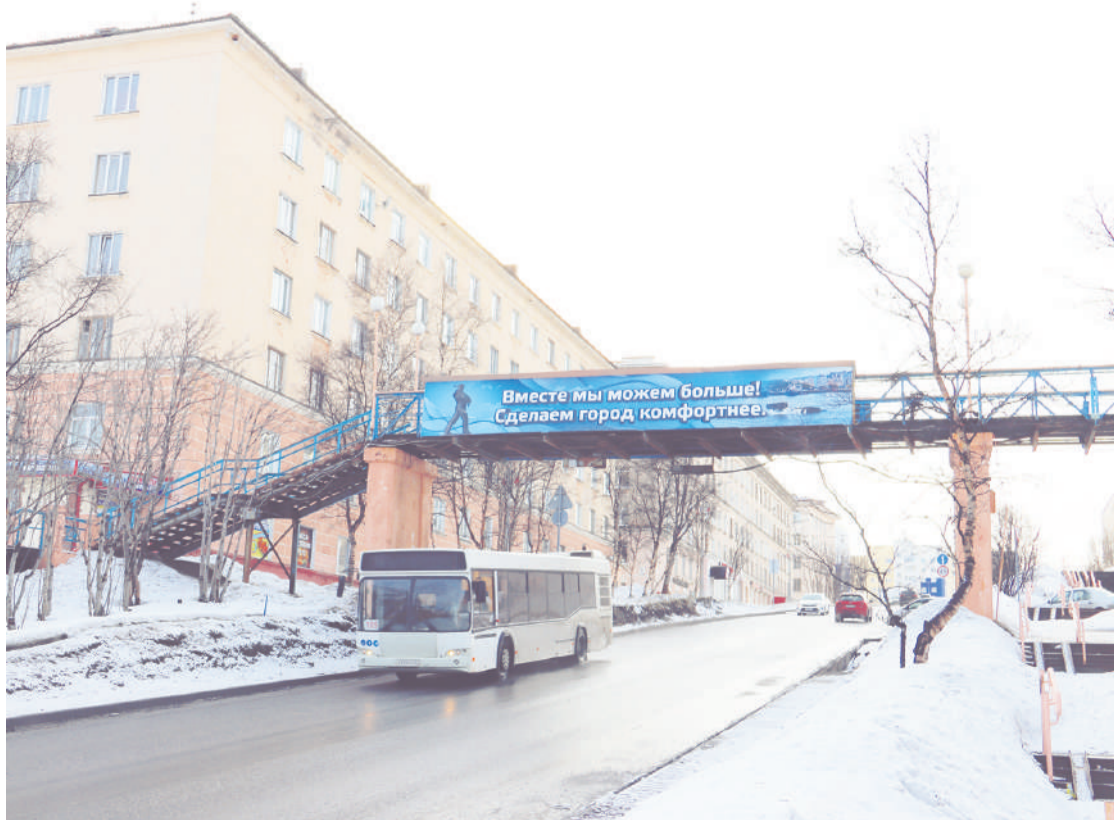
Оригинал снимка, на основе которого была создана фотогадка.

Следующую загадку ищите на нашем сайте s-vesti.ru в альбоме «Городские фотогадки – 3» в разделе «Конкурсы» в следующий понедельник, 5 апреля. Ответы принимаются в комментариях под фотографиями. Победит и получит приз тот, кто первым даст полный и точный ответ.