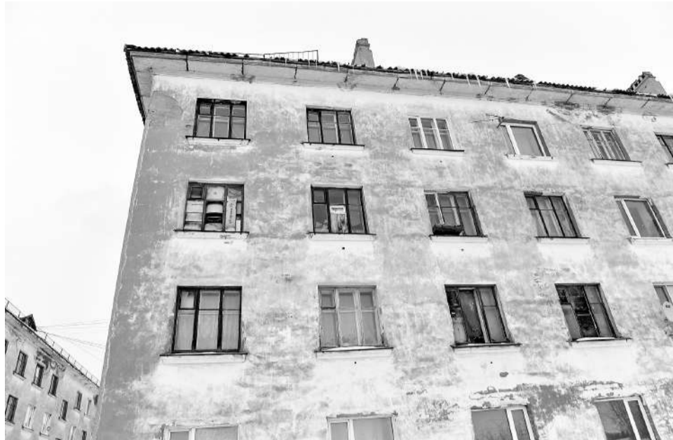
Если квартира пустует, возможно, она в очереди на ремонт или еще не попала в муниципальную собственность.

– В случае, если жилое помещение не сдано нанимателем в установленном порядке по акту приема-передачи наймодателю, данный наниматель несет обязанность по содержанию жилого помещения и оплате коммунальных платежей до его сдачи наймодателю по акту приема-передачи или признания судом утраты права пользования жилым помещением, – напоминают в Ко-