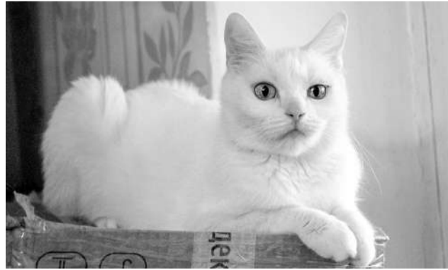
Лилак – одна из подопечных организации – ищет дом.

Не теряют любители кошек и надежду на то, что рано