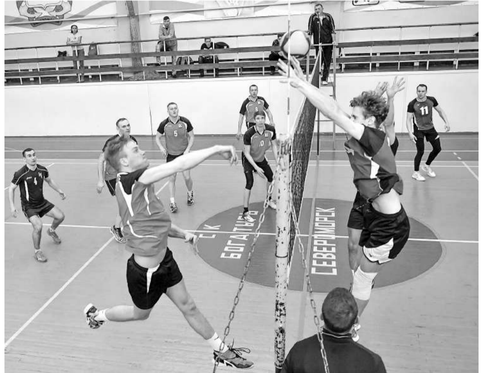
Сборная Североморска и Северного флота – МГАТП (Мурманск). Североморцы прошивают блок соперника.

В последний день нас ожидали два наиболее сильных соперника: мурманская МГАТП (команда автотранспортного предприятия) и «Альбатрос»