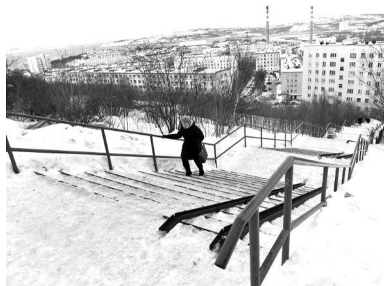
Резкий перепад высот от ул. Полярной к Душенова 30 лет назад соединили с помощью конструкции на трубах.