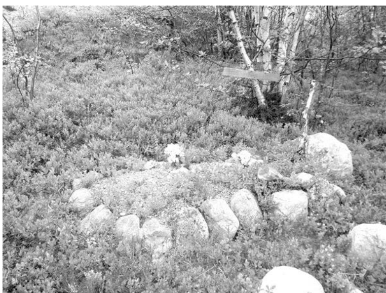
Недалеко от оз.Домашнего свое последнее пристанище обрела некая Лона, как следует из надписи на доске, прибитой к дереву возле могилы.

– При всей моей любви к животным считаю, что очеловечивать их нельзя! – возражает