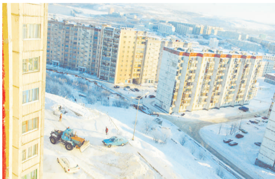
Оригинал снимка, на основе которого была создана фотогадка.

Следующую загадку ищите на нашем сайте s-vesti.ru в альбоме «Городские фотогадки - 3» в разделе «Конкурсы» в следующий понедельник, 5 апреля. Ответы принимаются в комментариях под фотографиями. Победит и получит приз тот, кто первым даст полный и точный ответ.