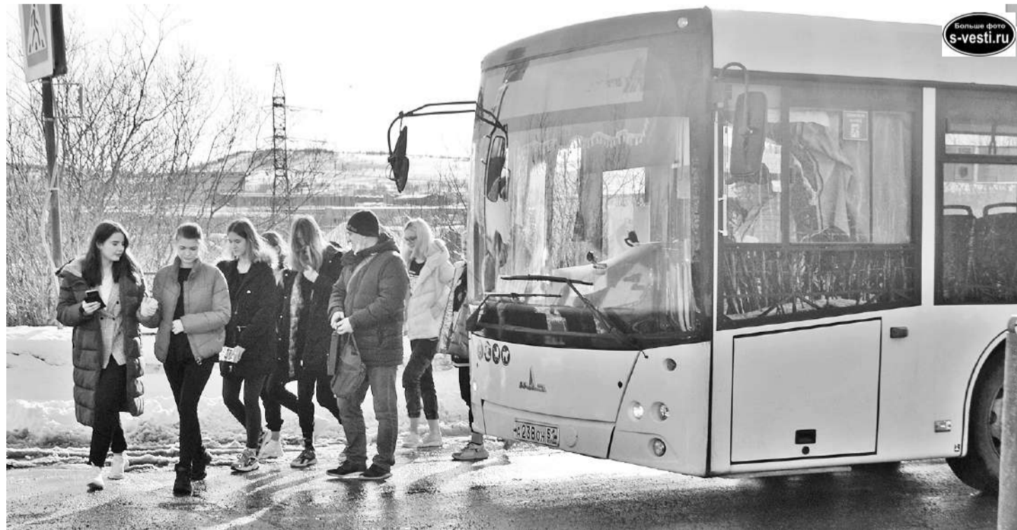
Роль населения, подлежащего эвакуации, исполнили старшеклассники. Никакой паники - все по инструкции.