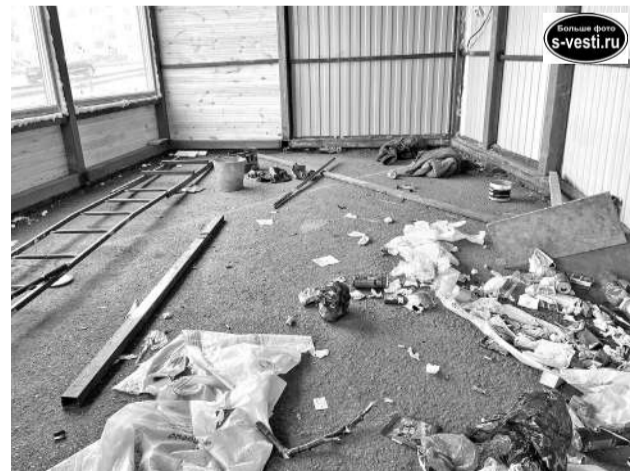
Сложно представить, что здесь будут торговать чем-то прекрасным.

Через две недели Североморск отметит 70-летний юбилей. И лучшим подарком от нас всех может быть только чистота улиц. И совсем не обязательно ждать городских субботников! К слову, первый Всероссийский субботник намечен на 24 апреля. И пройдет он во всех муниципальных образованиях, участвующих в рейтинговом голосовании. Напомним, в рамках проекта «Формирование комфортной городской