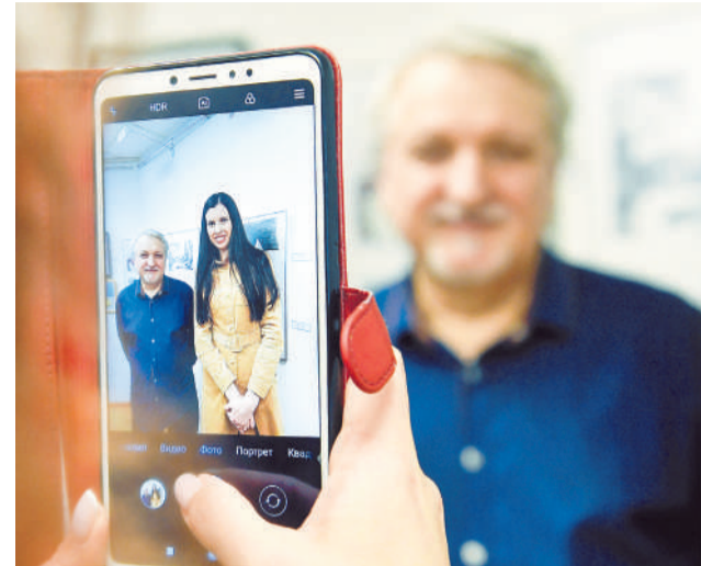
Фото на память с наставником – обязательный пункт вернисажа.

Однако начинающие художники получили и беспристрастную оценку своего творчества от гостя выставки Анатолия Сергиенко. Он от мечал и недочеты, давая полезные советы участникам. Согласитесь, получить профессиональный совет от заслуженного художника России – дорогого стоит.