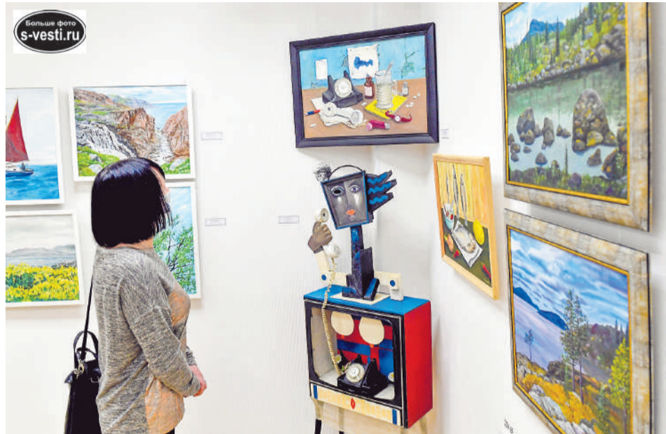
Выставку работ учениц Ивана Ворона можно посмотреть до 15 апреля.

Именно так между собой называют творческие курсы Ивана Ворона – известного североморского художника. В воскресенье, 28 марта, в Выставочном зале на Сафонова, 22, открылась выставка работ его учениц.