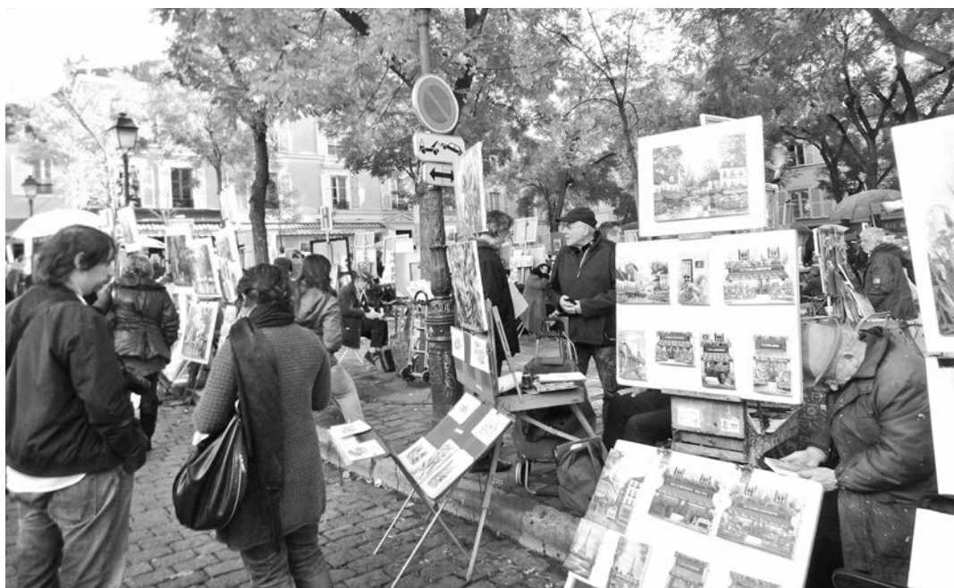
Излюбленные места уличных художников — площадь Тертр на Монмартре и возле Центра Помпиду.