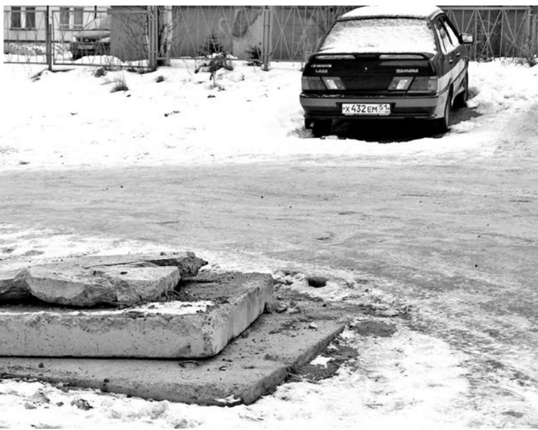
В условиях полярной ночи такие «сюрпризы» на дороге могут дорого обойтись автовладельцам.