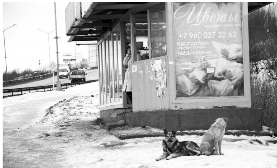
Нахождение бродячих собак в общественном месте вызывает опасение.

14 ноября около полудня от укуса бродячей собаки в Североморске пострадал еще один ребенок — животное набросилось на первоклассницу, возвращавшуюся из школы, во дворе дома №9 на ул.Сафонова. Укус пришелся на ягодицу. Девочка обслужена в ЦРБ. От четырех клыков остались гематомы, один — повредил кожный покров. Ребенку прописана вакцинация против бешенства.