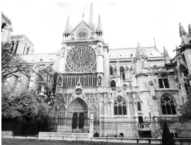
Собор Парижской Богоматери, воспетый Виктором Гюго.

— Первое, на что обращаешь внимание в Париже, — развитость туристической инфраструктуры. В этом городе созданы максимально комфортные условия для отдыха иностранцев. Совсем не обязательно ехать сюда по путевке. Даже не зная ни английского, ни французского языков, вы не почувствуете никаких неудобств. Всегда можно взять напрокат велосипед, парковки которых, как и карты, и указатели, размещены по всему городу — так что уже через 2-3 дня вы без труда начнете ориентироваться. В каждом музее можно приобрести электронный путеводитель, который на родном вам языке ознакомит с экспозицией. Та же система и в двухъярусных экскурсионных автобусах. Знаменитые двухэтажки на колесах — не просто средство передвижения со смотровыми площадками, а мобильные гиды. Подсоединив выданные при входе наушники и выбрав знакомый язык, вы узнаете историю окрестностей. Если вам захотелось подольше остановиться в каком-то месте, погулять и пофотографировать, смело выходите из автобуса. Купленный за 30 евро билет дает право перемещаться на автобусах одного цвета (желтый, зеленый и красный) ходят по разным маршрутам в течение всего дня. Мож-