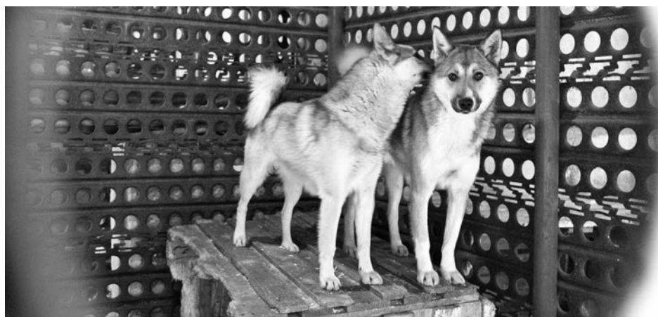
В Центре временного содержания животных собаки живут в просторных клетках.

на основе золетила — анестезиологического препарата, — поясняет ветеринарный специалист Анастасия. — Он расслабляет мускулатуру и угнетает подкорковые области мозга, не сказываясь при этом на дыхательной и сердечно-сосудистой системах. Спустя несколько минут после инъекции животное засыпает на 30-40 минут.