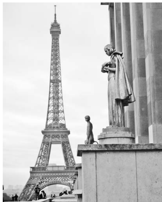
Эйфелеву башню видно из любой точки.

Записала Ирина ПАЛАМАРЧУК.