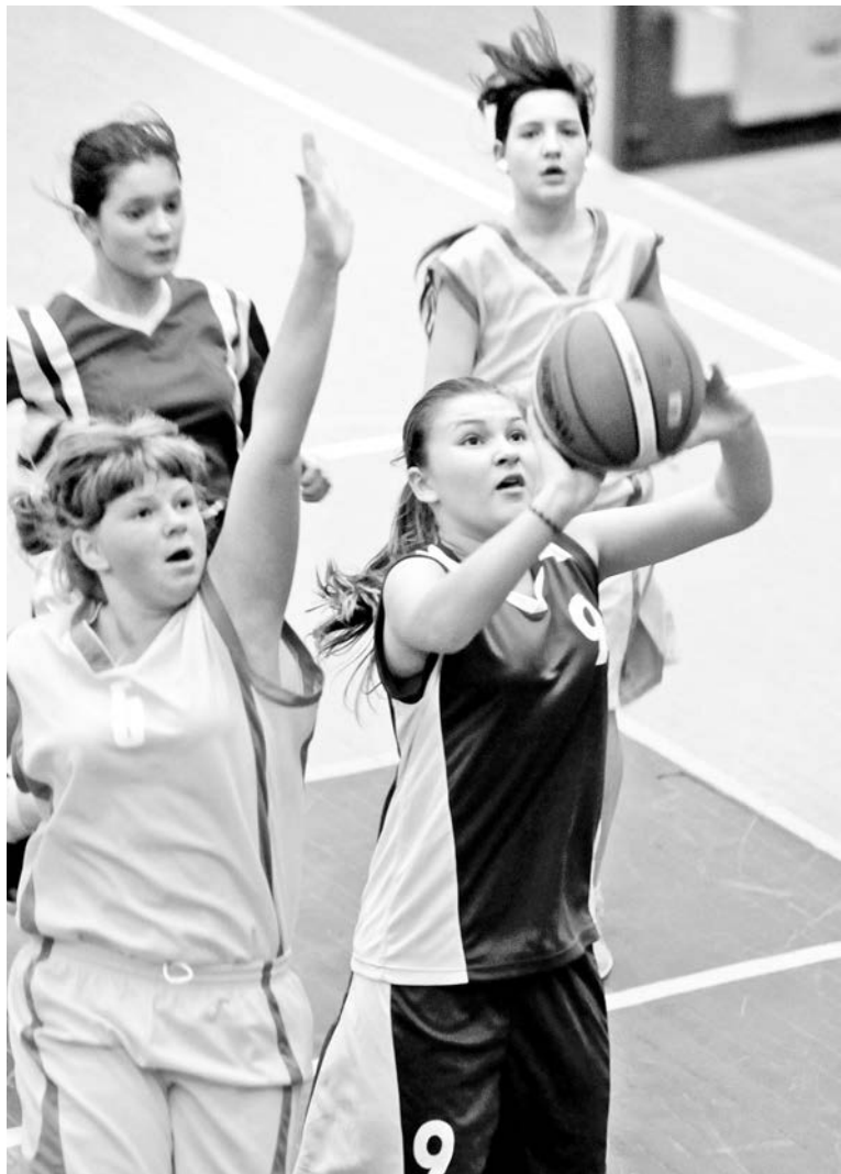
Команде девочек показать результативную игру в этот раз не удалось.

11 ноября североморские любители баскетбола могли обвести в календаре красным. Очередной тур чемпионата и первенства области, проходивший в СК «Богатырь», превратился в целый день баскетбола.