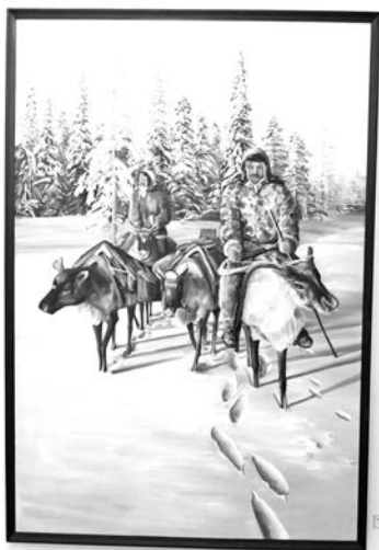
«Зимний переход на оленях».

9 ноября в Городском выставочном зале состоялось ее торжественное открытие. Не каждому пришедшему было известно, что такое Грумант и почему автор готов посвящать ему оды. Но пребывание в легком неведении ока-