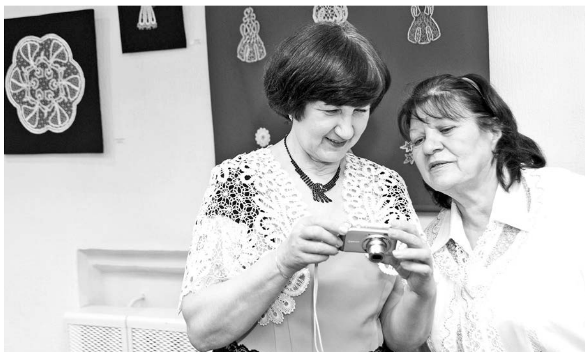
Мастерицы радовались своим достижениям и делали памятные фото.

Гостей на входе встречали женщины в красивых пелеринах, накидках, воротниках, жилетках и