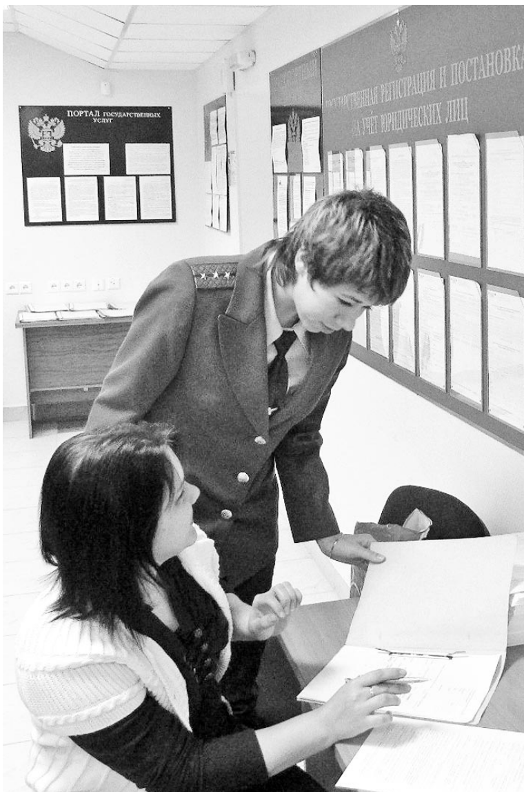
Работники налоговой службы всегда готовы помочь налогоплательщикам преодолеть сложности в оформлении документов.

21 ноября - День работника налоговых органов РФ