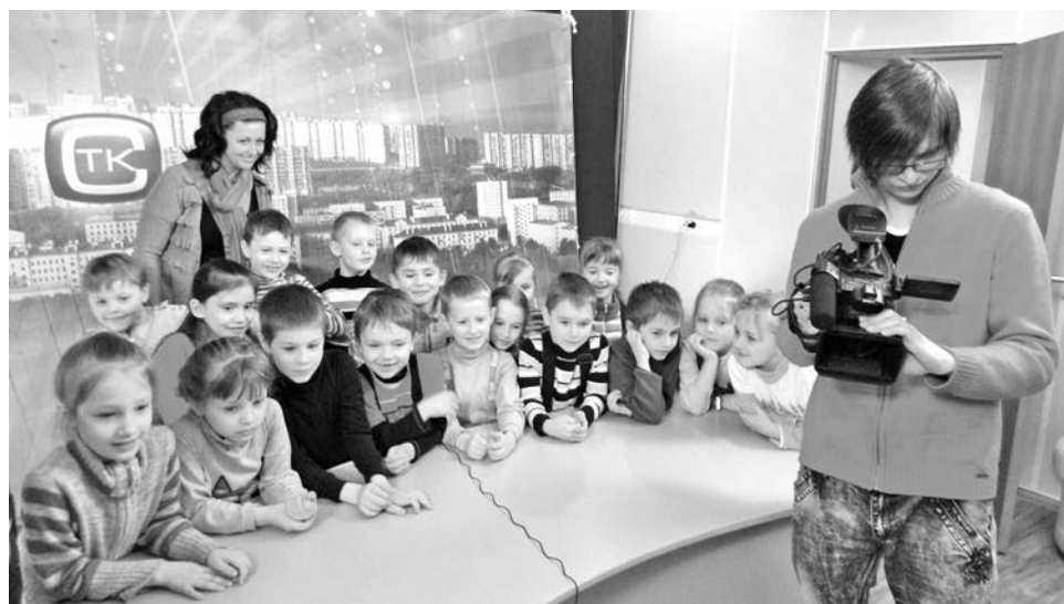
Студия открыта для всего нового и с радостью принимает гостей. В этот раз ими стали ребята из детского сада.