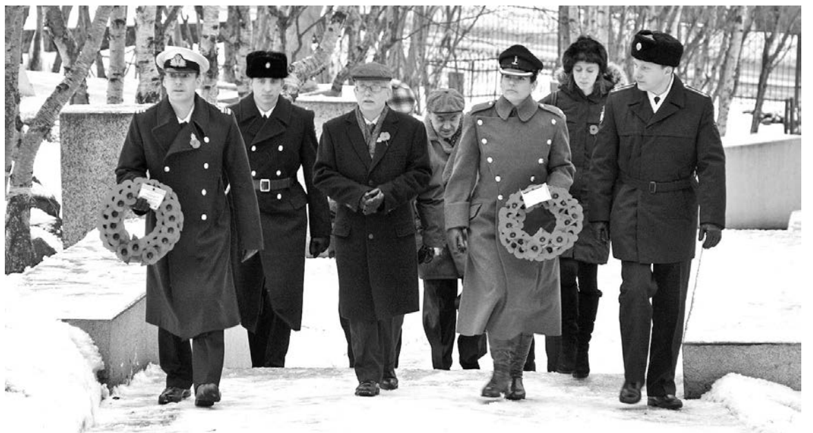
Британская делегация посещает североморское военное кладбище, чтобы почтить память захороненных здесь соотечественников, каждый год.