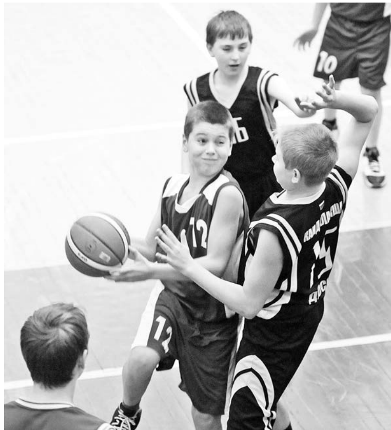
В начале игры ребята и не предполагали, что выигрывают с таким разгромным счетом.

Но долго переживать по поводу этого поражения не получилось. Следом на площадку вышли мальчики 2000-2001 г.р. Неделю назад на выезде они одержали убедительную победу над соперниками из Мурманска со счетом 42:18, теперь решили показать все, на что способны,