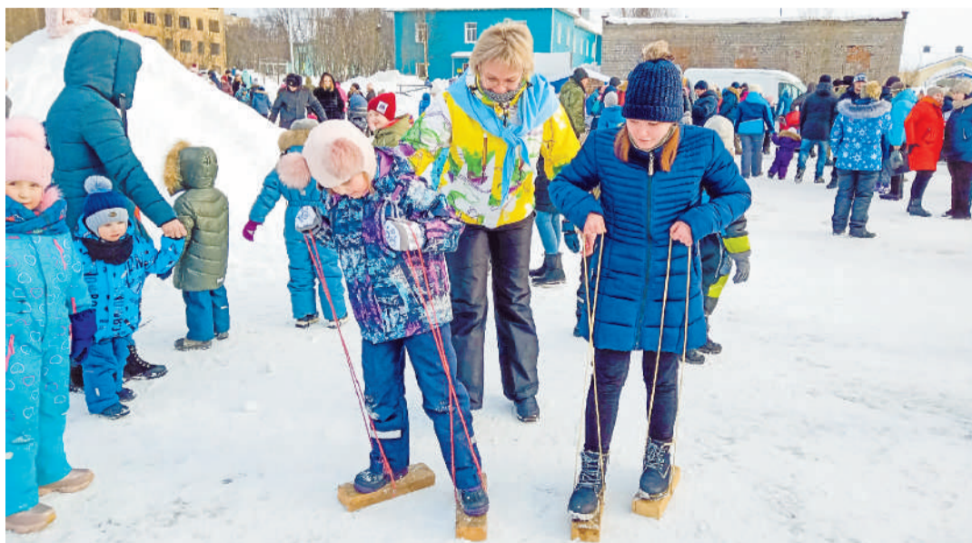
В п.г.т.Сафоново зрители не только концерт посмотрели, но и по-масленичному позабавились: веселые конкурсы подготовил коллектив ДК семейного досуга.