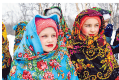
В концерте принял участие ансамбль «Все звезды» ДК «Строитель».

Широкой Масленице – шумные проводы! В этом году попрощаться с Обьедахой-Блиноедкой в Сафоново и Североморске пришло, кажется, рекордное количество человек.