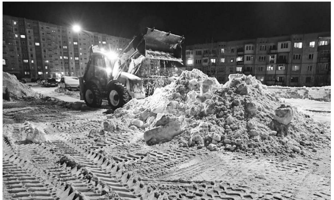
Если в позднее время под окнами тархтит трактор, потерпите - он спасает ваш двор.

когда жильцы, зная об уборке заранее, перепарковывают свои автомобили, а посетители расположенных в окрестностях учреждений оставляют свои машины – они-то о запланированных работах не знают.