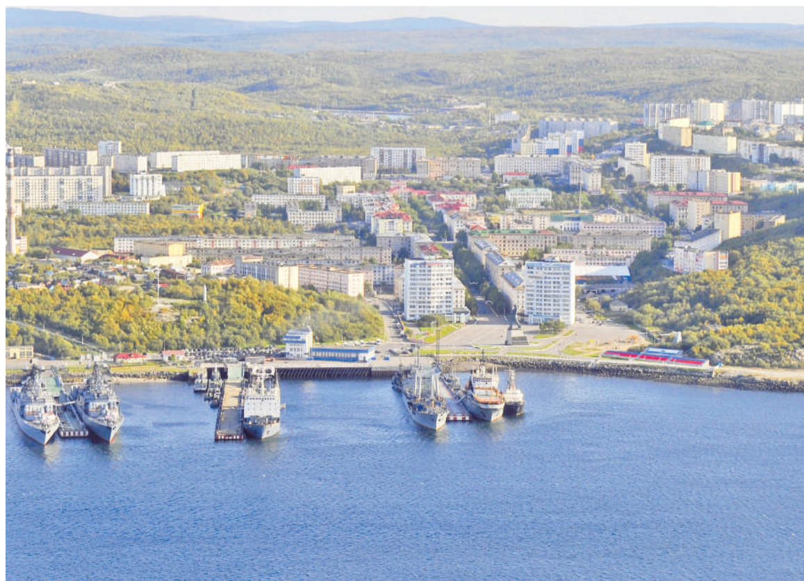
Оригинал снимка, на основе которого была создана фотогадка.