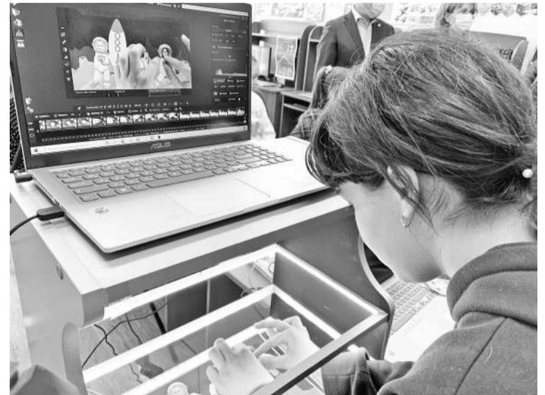
Дом детского творчества приглашает ребят, желающих научиться делать мультфильмы.