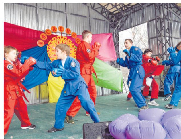
С показательными боями выступили спортсмены СКБЕ «Медведь».