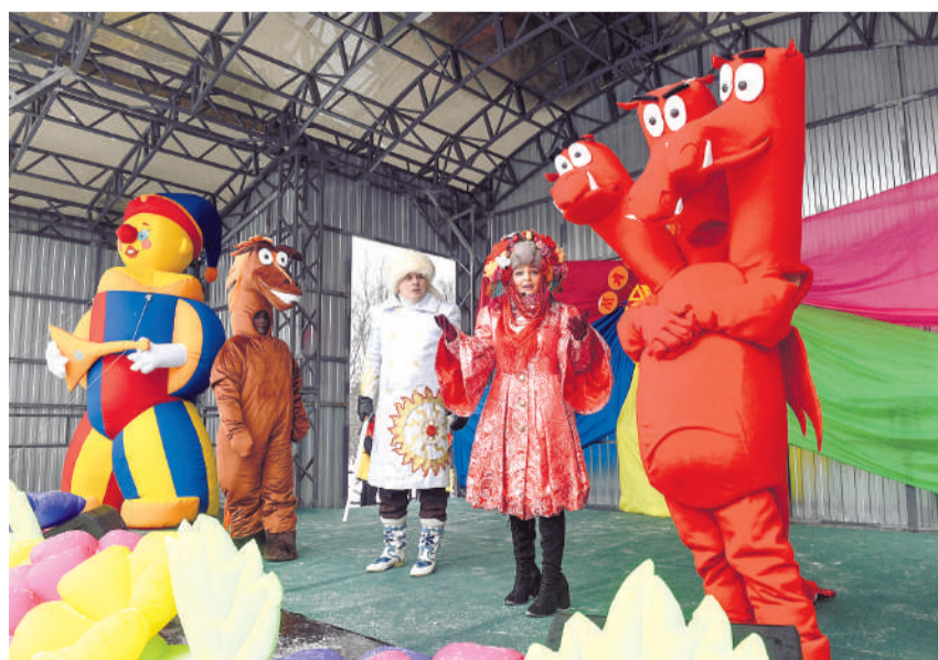
Артисты Центра досуга молодежи разыграли на сцене настоящую сказку, в которой добро, конечно, победило.