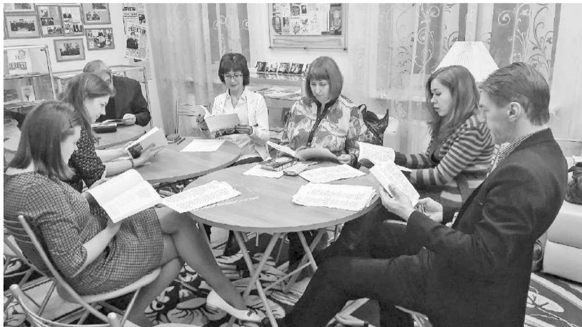
Та самая «Зеленая гостиная», рабочий момент.