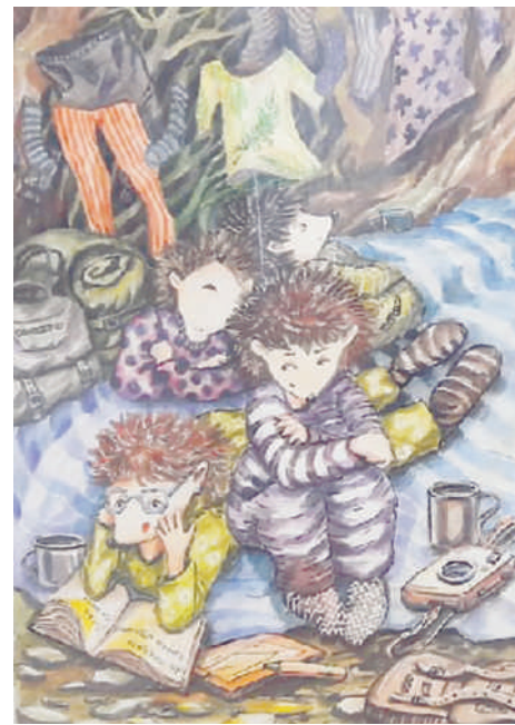
О.Короленко, «На привале» (акварель).

Учредитель: МБУ «Североморский информационно-аналитический центр». Главный редактор: Е.О. Захарова Адрес редакции (издателя): 184600, г.Североморск, ул.Сафонова, 6. Тел.: 4-74-50 (главный редактор), 5-04-01 (корреспонденты),