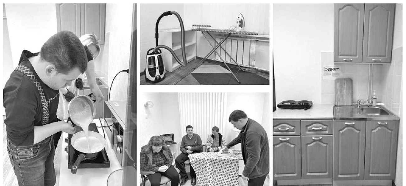
Регулярные занятия в тренировочной квартире помогут ребятам с ОВЗ в будущем создать свой домашний очаг, научиться готовить, стать гостеприимными хозяевами.