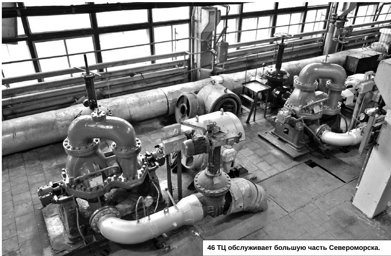
46 ТЦ обслуживает большую часть Североморска.

Прохождение отопительного сезона – ежегодный экзамен для Мурманской области, муниципалитетов и предприятий теплоэнергетического комплекса, от его успешности зависит здоровье и настроение северян, оценка федеральным центром работы местной власти и финансовая поддержка отрасли на перспективу.