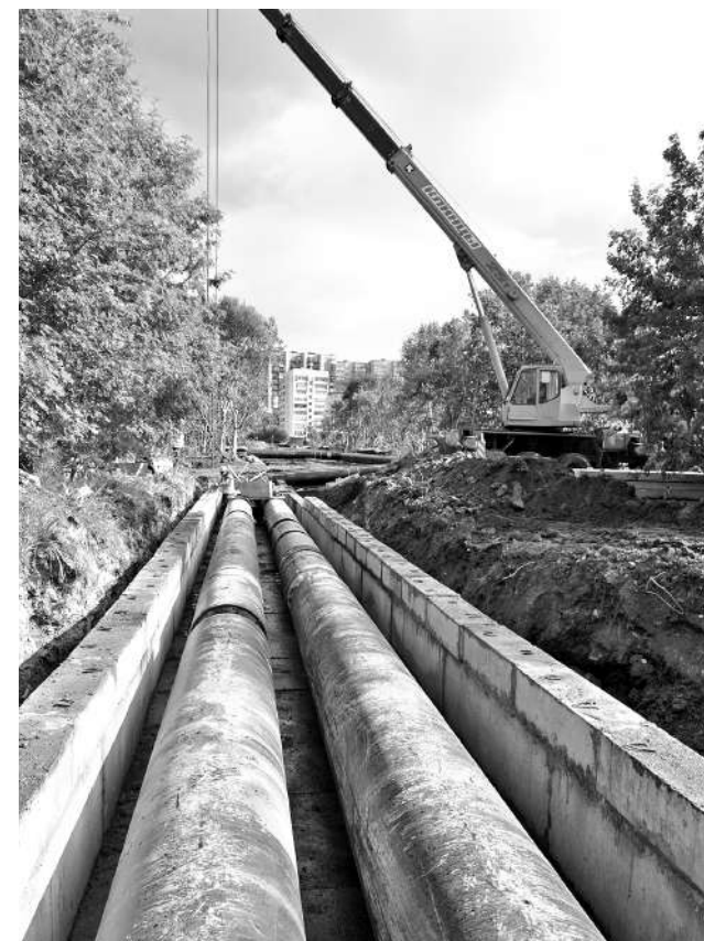
Самые современные трубы системы теплоснабжения города проложены от 46 ТЦ по ул.Сгибнева.