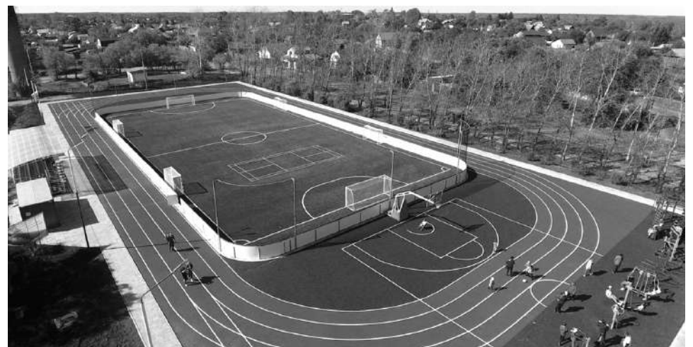
ФОКОТ в Малом Сафоново будет построен по типовому проекту (как на фото).

Анастасия МЕЛЬНИКОВА.