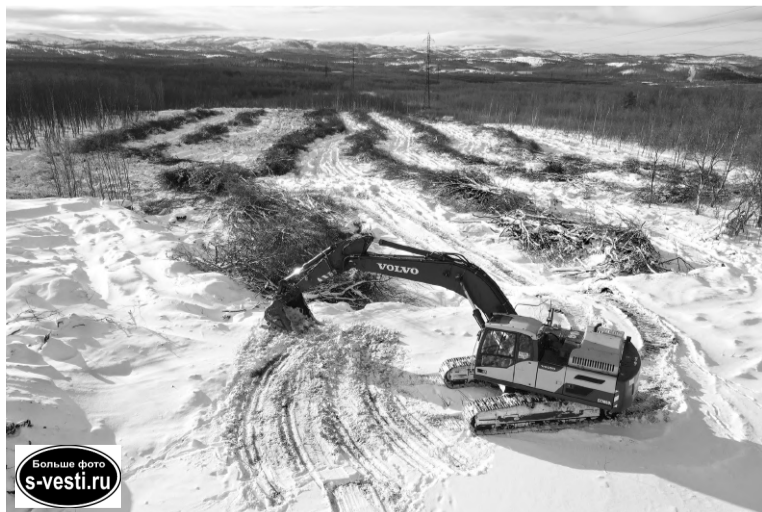
Объект для городского бюджета неподъемный. Только на первый этап строительства область выделила порядка 100 млн. рублей.

Место под него было определено более пяти лет назад – подъезд к п. Сафоново-1. За это время прошла длительная по срокам процедура передачи земельного участка от Мино-