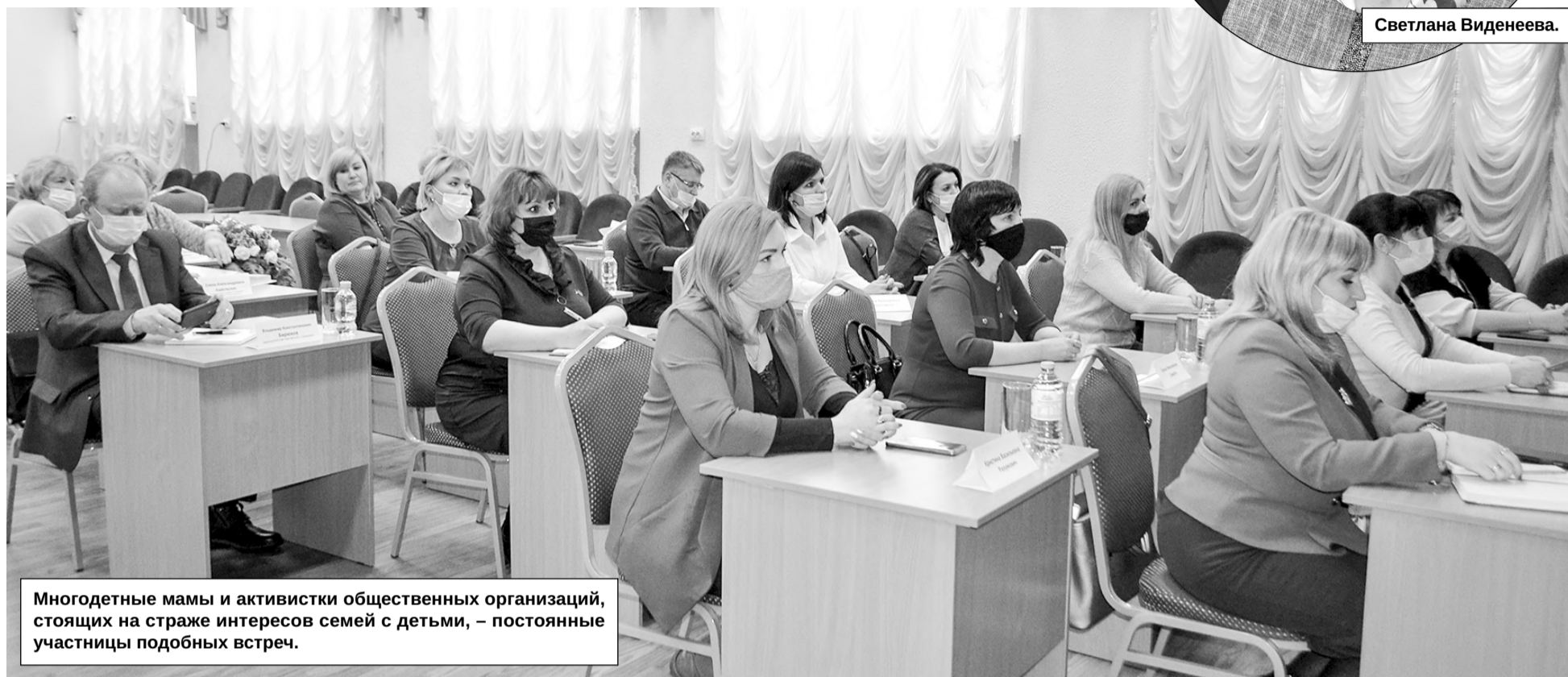
Многолетние мамы и активистки общественных организаций, стоящих на страже интересов семей с детьми, – постоянные участницы подобных встреч.

Продолжение. Начало в «СВ» №8 от 26.02.2021 года.