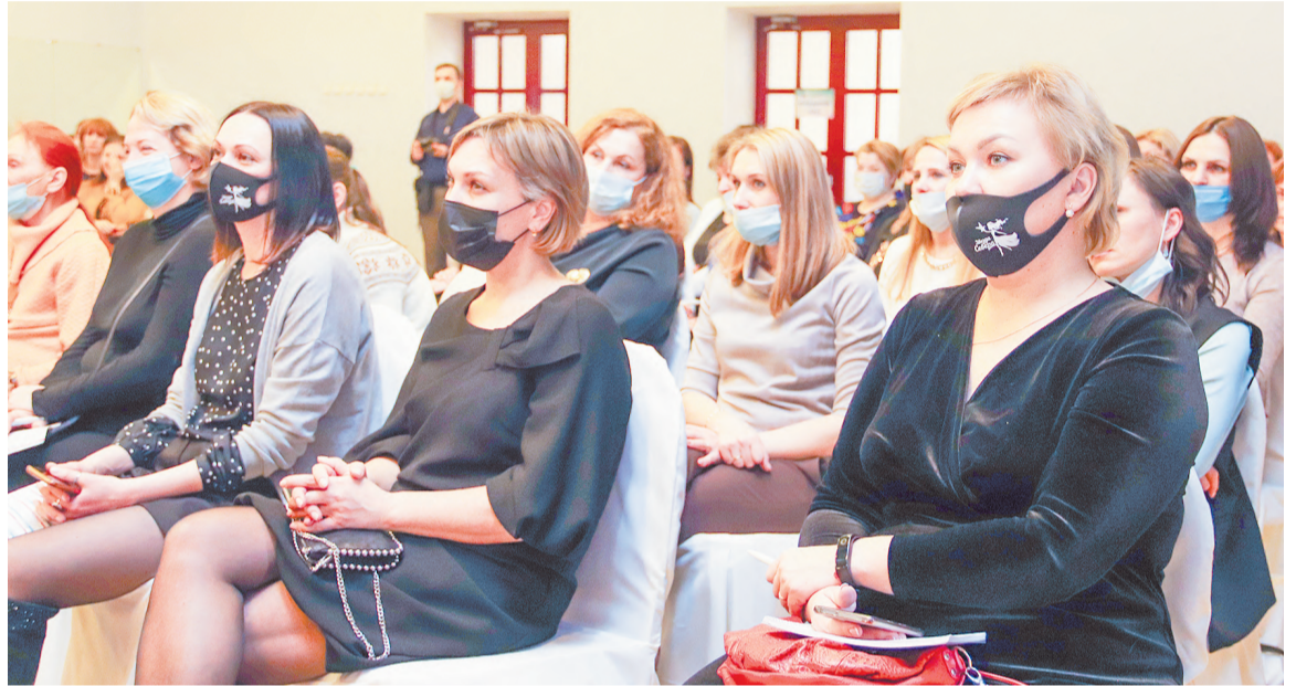
Полный зал - красноречивая оценка мероприятию.