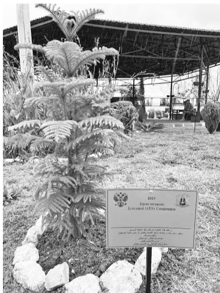
Дерево, высаженное на Аллее дружбы североморской делегацией.

О том, что ресурсы росляковского кладбища заканчиваются и Североморску необходимо новое место для захоронений, известно не первый год. И вот строительство нового кладбища началось.