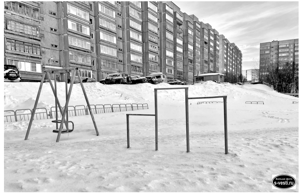
На этом месте планируется оборудовать современную детскую площадку.