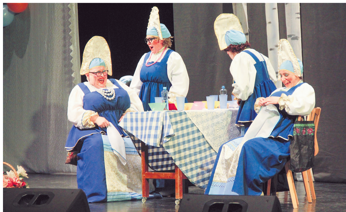
«Баба Шанель» - яркая точка женского форума.