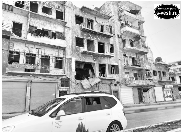
Жизнь едва теплится в домах, попавших в зону боевых действий.

– Наши ребята в Сирии приходится довольно тяжело, служат практически без выходных, постоянно в напряжении. Вместе с тем я испытал гордость за российские Вооруженные силы. Мне рассказа-